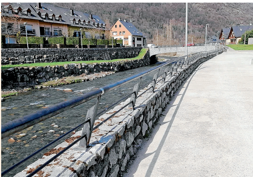
AJUNTAMENT DE LES

Eth consistori de Les dejà a acabat es trabalhs de neteja e es òbres d'estabilizació des murs qu'entornegen eth cementèri municipau. Ues accions fòrça de besonh qu'an auut per objècte era assolidatge dera estabilitat des murs e er apraiament d'aqueri trams que se trapauen en un estat mauement a causa d'agents extèrns coma es umiditats e eth gèu. D'aguesta manèra, se dignifique aguest espaci ath viatge que s'incremente era seguretat.