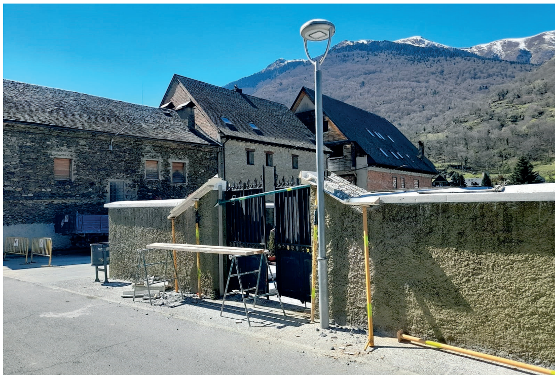
AJUNTAMENT DE LES

Er Ajuntament de Les encara non a prenut era decisió sus era celebracion o suspensió sus dues hèstes insignia deth municipi: era Shasclada (eth dusau disabte de mai) e era Crema der Haro (net de Sant Joan). Est an passat ambdues hèstes aueren d'èster anulades pr'amor dera incompatibilitat dera situacion de pandèmia damb es aglomeracions qu'abituauments se formen en aguesti eveniments. Se demore qu'eth consistori prengue ua decisió definitiva pròplements.