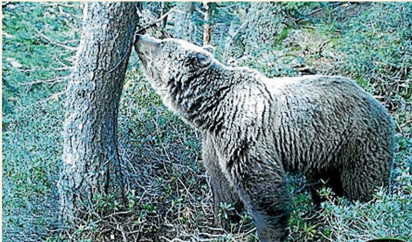
CONSELH GENERAU D'ARAN