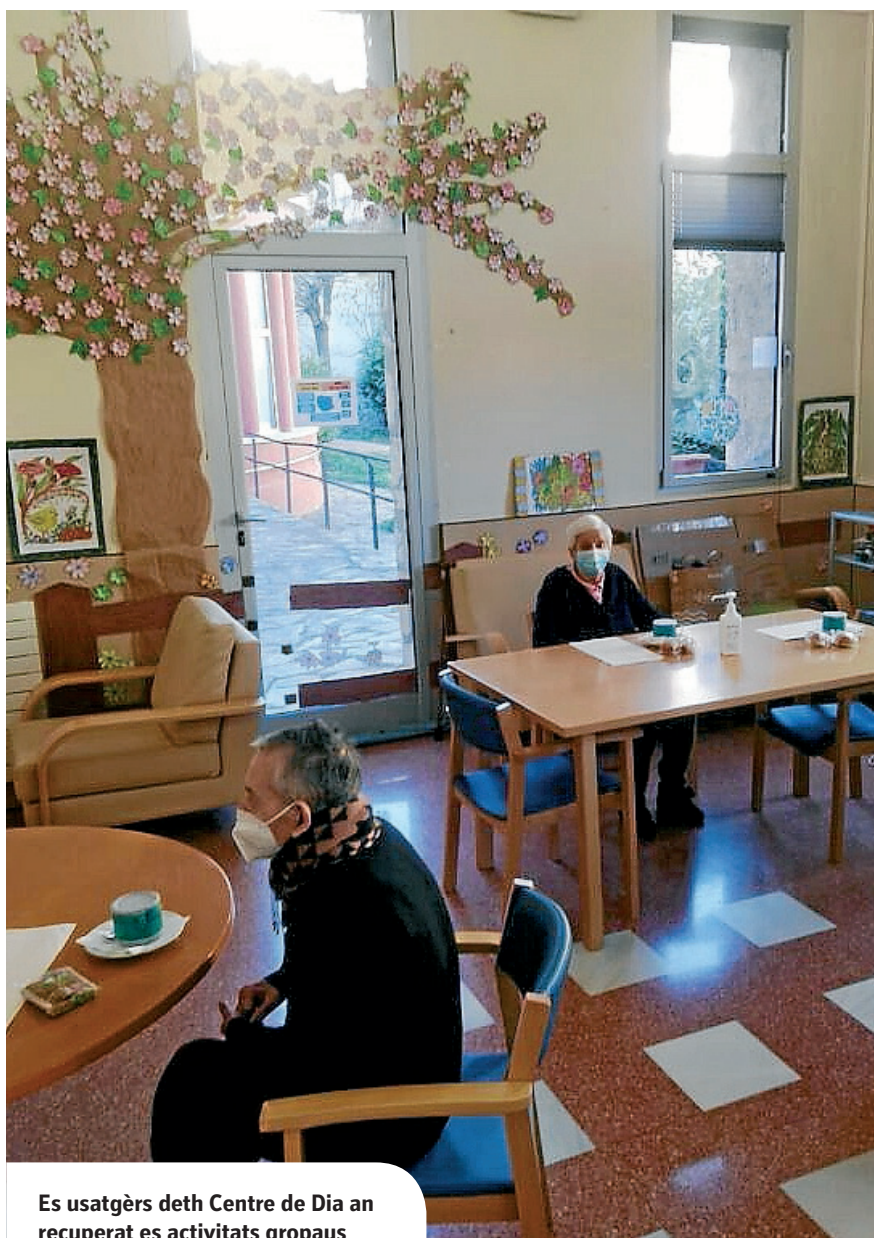
Es usatgèrs deth Centre de Dia an recuperat es activitats gropaus