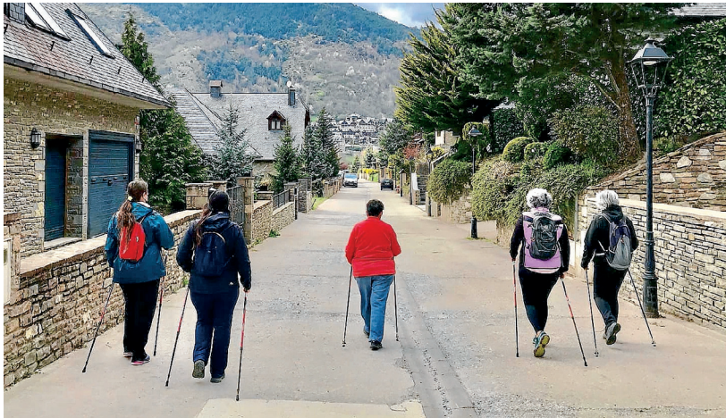
AJUNTAMENT DE VIELHA E MIJARAN

Er equip de govèrn de Vielha e Mijaran s'a amassat damb Caritas Val d'Aran entà seguir en tot colaborar en ajudar as familhes mès vulnerables deth municipi. Ena amassada s'a analizat era intervencion a compdar dera aportacion economica qu'eth consistòri hec en 2020 e s'a tractat quini son es besonhs qu'era associacion a entà enguan. Eth consistòri tanben a liurat un lòt de masquetes de proteccion dera COVID-19 destinades ara ciutadania en risc d'exclusion social.