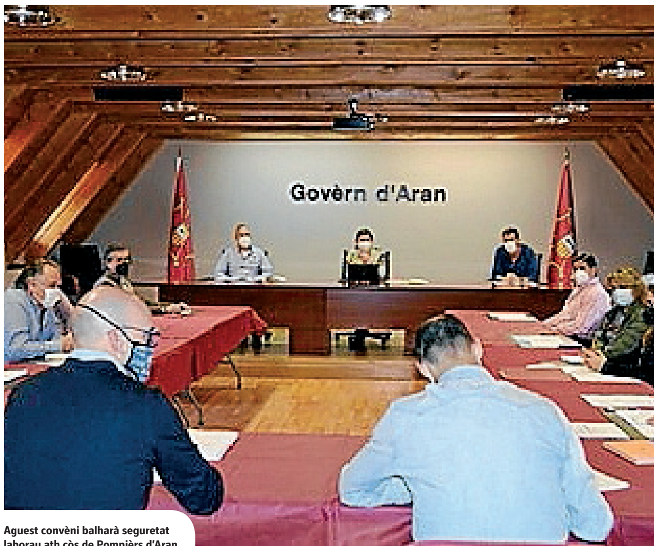
Aguest convèni balharà seguretat laborau ath còs de Pompièrs d'Aran

Eth Conselh d'Administracion de Pompièrs Emergències (CAPE) a aprovat eth primèr convèni collectiu dera istòria des Pompièrs en Aran, dempús de dus ans de negociacions damb es representants des treballadors. Damb era implementacion deth nau modèl de gestion integrat d'emergències en Aran, s'inicièc eth procès d'integracion des diferents collectius qu'operauen enes emergències deth territòri, qu'enquith moment auien situacions laboraus diferents, en tot arténher agropar tot eth personau ena madeisha empresa, Pompièrs Emergències SL. En aguest sens, eth convèni aprovat, frut der acòrd entre era mesa negociadora de Pompièrs Emergències SL e es representants des treballadors deth còs, regularize aguesta situacion e servís entà balhar seguretat laborau per un costat e entà definir Grops Professionaus per aute, en tot perméter atau possibles promocions ena plantilha per miei des convocatòries oportunes. Maria Vergés, sindica d'Aran, declaraue que "aguest convèni represente un cas singular e unic, pr'amor que non i a antecedents de cap empresa qu'age ua cartèra tant variada coma era de Pompièrs Emergències SL,".