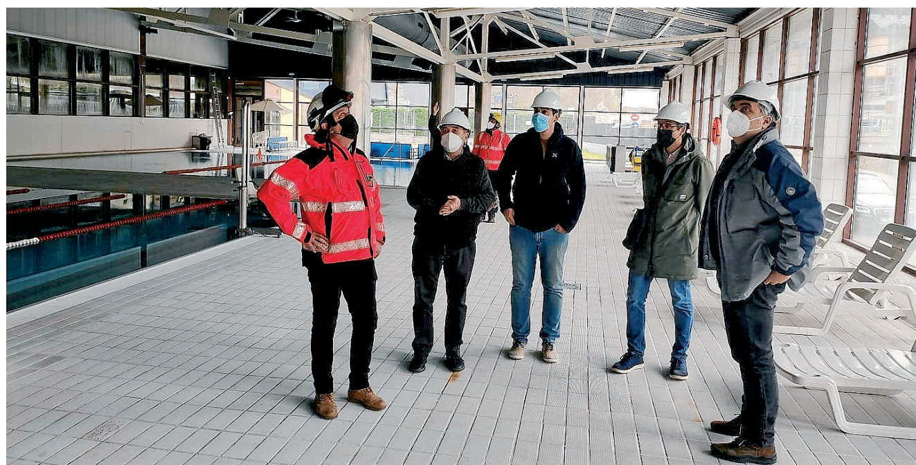
AJUNTAMENT DE VIELHA E MIJARAN