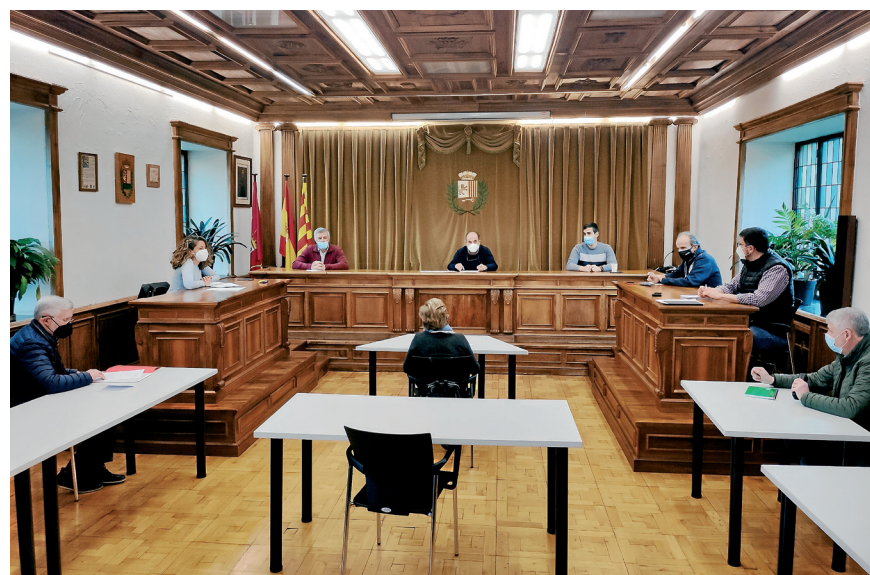
AJUNTAMENT DE VIELHA E MIJARAN

Eth Conselh dera Vila a constituït era Comission dera Nhèu, qu'ei un nau organ de participacion ciutadana qu'aurà coma objectiu hèr prepauses en servici de neteja e mantenement dera nhèu, autant coma ena melhora dera sua ordenança municipau. En aguest sens, era Comission debaterà mesures des der airau civic entà confeccionar un seguit de prepauses qu'an de servir entà melhorar en futur eth servici de neteja e mantenement des accèssi, des carrèrs principaus e des trepadèrs de toti es pòbles deth municipi en iuèrn, entà poder informar ath maxim organ de consulta e participacion ciutadana, eth Conselh dera Vila.