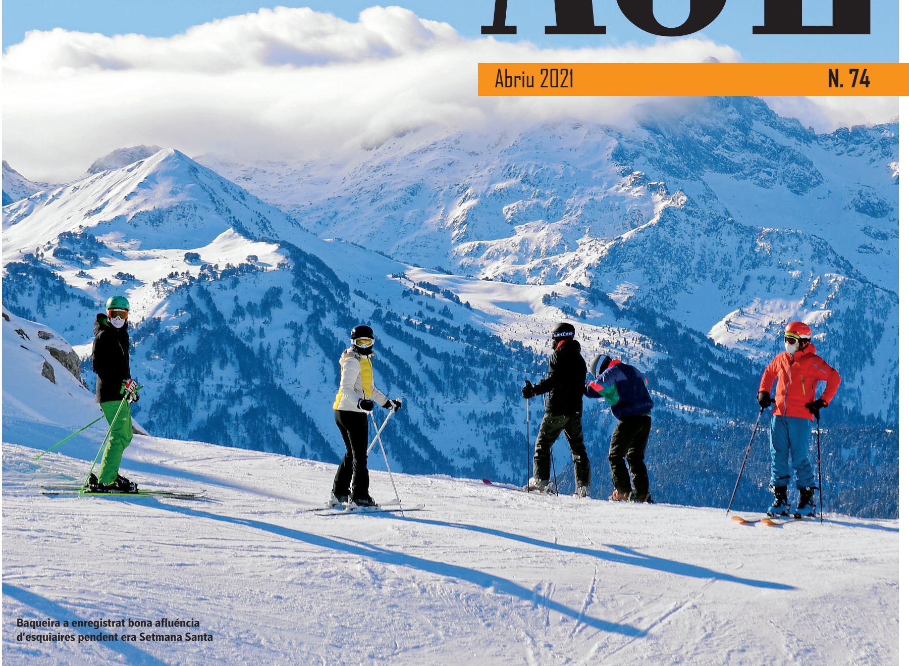
Baqueira a enregistrat bona afluència d'esquiaires pendent era Setmana Santa