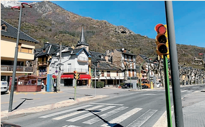
AJUNTAMENT DE BOSSÒST