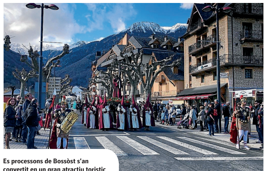
Es processons de Bossòst s'an convertit en un gran atractiu toristic

Cau arrebrebar que Bossòst ei er unic pòble aranés qu'a conservat aguestes processons, des que se n'a constància, aumens, d'ençà de 1879. En aguest sens, mès de 200 vesins e vesies deth pòble participen cada an en aguesti passi tan singulars. Çò que se celebrèc sigueren es oficis religiosi, mès en tot respectar es mesures de prevencion dauant era Covid-19, coma er emplec dera masqueta e era distància de seguretat. Ath delà er aforament se redusic ath 30%.