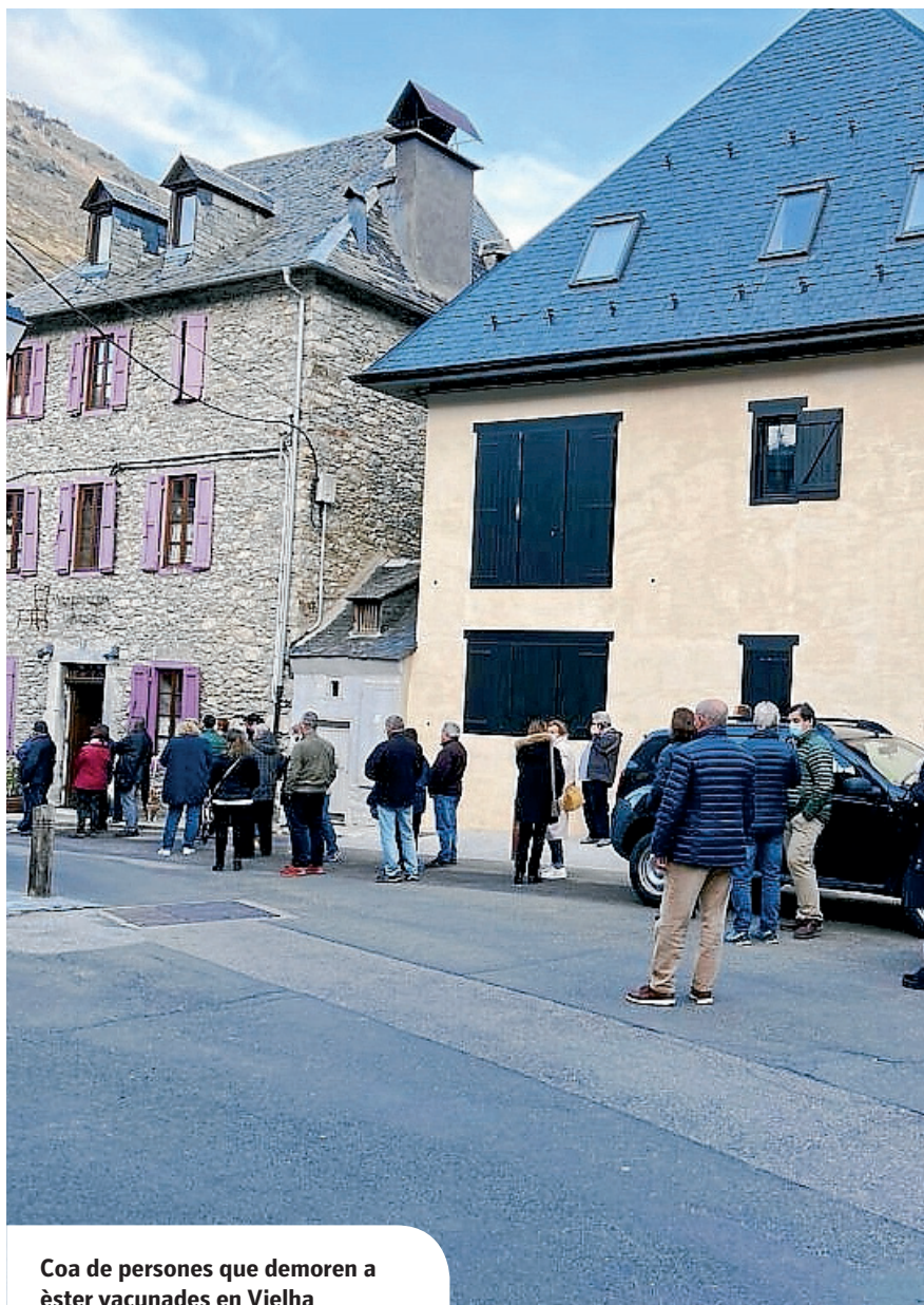
Coa de personas que demoren a èster vacunades en Vielha