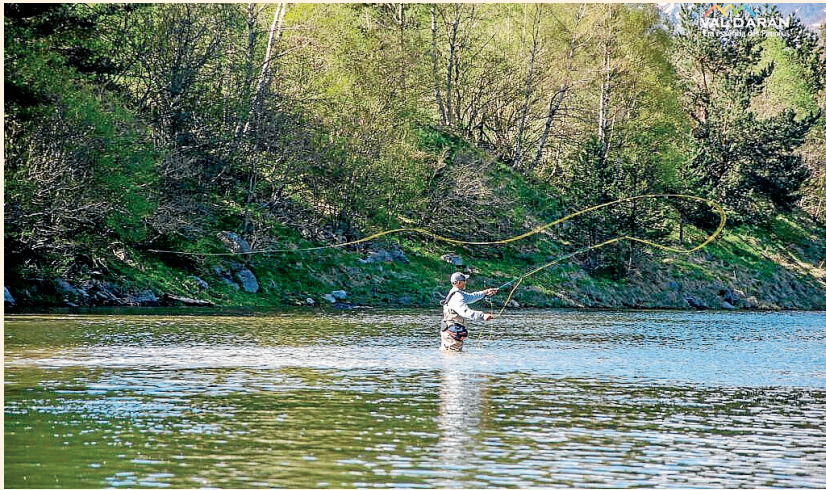
CONSELH GENERAU D'ARAN