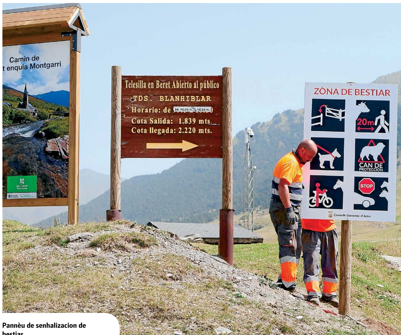
Pannèu de senhalizacion de bestiar.

En emplaçaments coma eth Plan de Beret, i pèishen ath torn de 600 caps de bestiar entre vaques e shivaus e ei un des emplaçaments a on s'a amiat a tèrme ua major incidència.