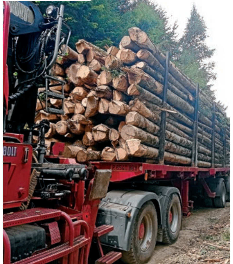
CONSE LH GENERAU D'ARAN