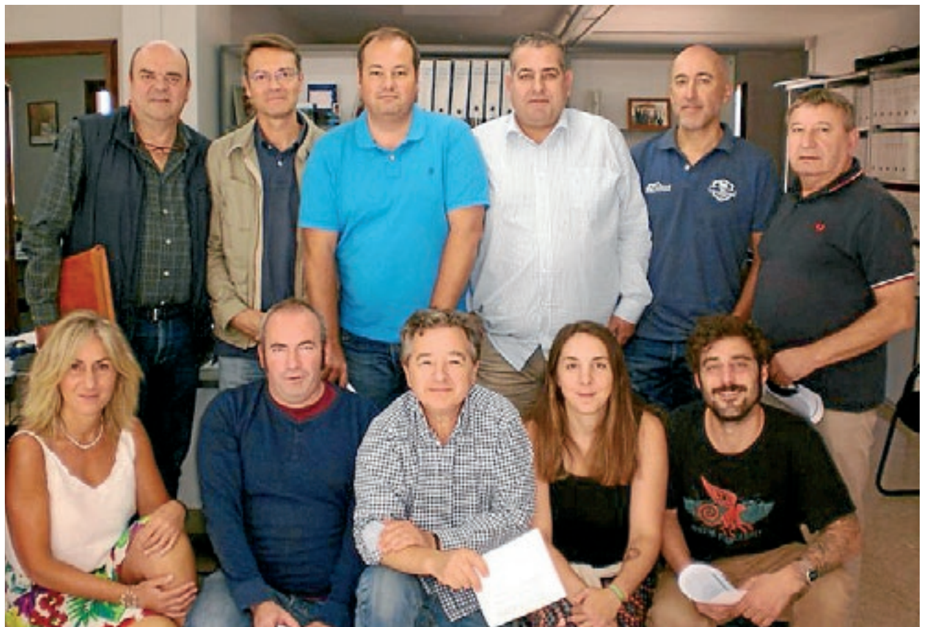
GRÈMI D'OSTALARIA D'ARAN

Des deth Grèmi d'Ostalària, considèren qu'an ua planta hotelera de fòrça bona qualitat e, ath delà, se compde damb er unic hotèl 5 estèles de gran luxe de montanha en tota Espanha. Ath delà, destaquen qu'era aufèrta gastronòmica qu'aufrís era Val d'Aran ei un des màgers valors ahijuts damb es que compden e qu'ei un gran referent de qualitat que gaudissen es clients que s'apròpen ad aguest emplaçament. Sus açò, afirmen qu'es sòns sòcis son plenament conscients des standards de qualitat qu'an d'aufrir e per açò era Val ei un territòri tant desirat.