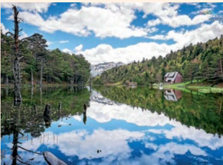
CONSE LH GENERAU D'ARAN

ENTÀ APUNTAR-SE CAU ENVIAR UN CORRÈU ELECTRONIC ENTARA DIRECCION EDUCA.AMBIENTAU.ARAN@GMAIL.COM. ES PLACES SON LIMITADES