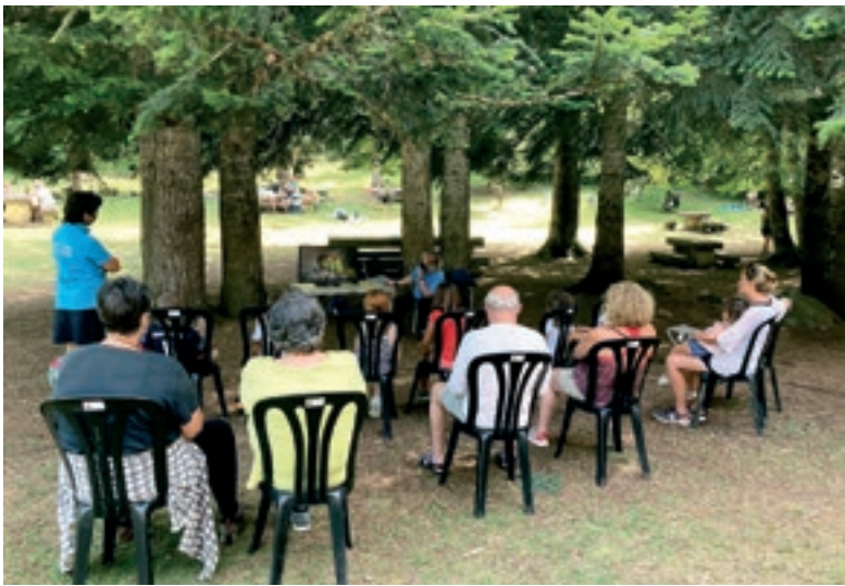
CONSE LH GENERAU D'ARAN

Eth Conselh Generau d'Aran aufrís aguest ostiu activitats d'educacion ambientau en orari de 10:15 e 11:15 ena Bassa d'Oles e entàs 15:30 en Plan Batalhèr de deluns a dimenge. Entre es activitats que s'aufrissen i a talhèrs d'orientacion, gimcanes de rastres, formacions sus fauna e flora deth territòri, e jòcs de misteri entà resòler toti amassa! Ath delà, ena Bassa d'Oles se pòt trapar ua exposicion permanenta sus es libellules e en Plan Batalhèr toti es dijaus entàs 17:00 ores i a conferéncias sus era natura e er entorn. Era iniciativa contemple era creacion de lòcs de trabalh entàs joeni