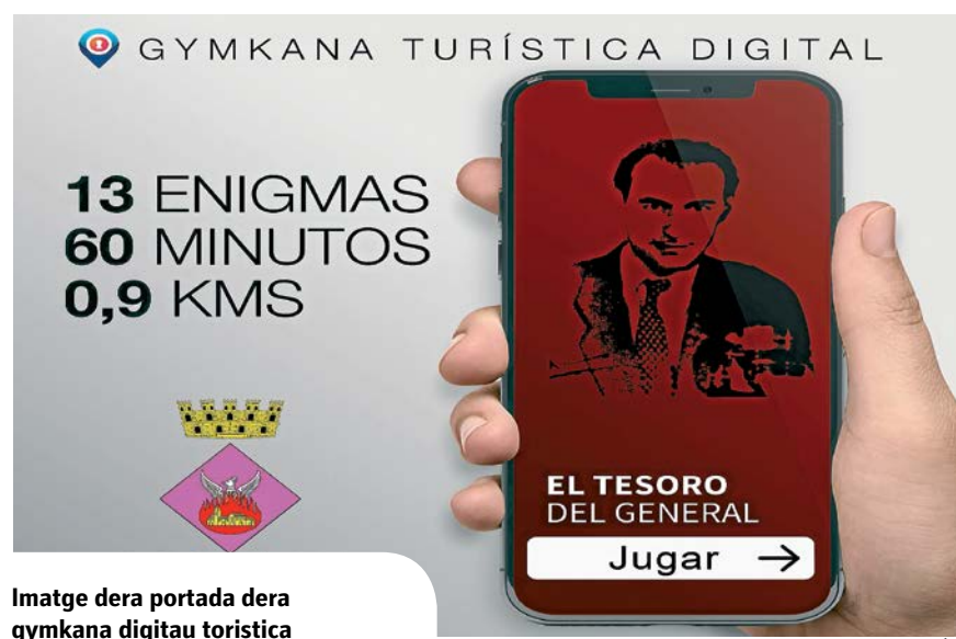
Imatge dera portada dera gymkana digitau toristica

Bossòst ven de celebrar era sua hèsta major, en aunor a Sant Ròc, laguens d'ua situacion encara fòrça excepcional per mor des restriccions vigentes per toti coneishudes. A despiech d'aguestes, eth municipi a pogut aufrir ues hèstes fòrça dignes, gràcies ar esfòrc, as talents e era illusion dera comission organizadora atau coma de toti es vesins e vesies qu'i an volut préner part. Es activitats qu'an agut lòc pendent aguesti dies d'agost atau ac demòstren, damb era prudència e era responsabilitat qu'a caracterizat eth comportament des vesins e es visitants deth municipi. Totun, auem fòrça talents de recuperar era celebracion collectiva, qu'ei, ara fin, ua celebracion dera vida compartida, pr'amor qu'era hèsta ei afirmacion vitau, coma credien es vielhs sapients. Encara mès, en moments coma es que viuem, era celebracion hè mès patenta era vida, en tot ratificar-la, en conformitat damb eth devier der univèrs, coma aqueri mos an ensenhat. En aguest contèxte, tanben auem podut comprovar un major dinamisme toristic e economic en nòste parçan, totun eth mes d'agost sòl èster propici entad aguesta activitat. Demorem qu'es setmanes pròplèus siguen tanben favorables entà ua gestion mès suenhada e compatible dera crisi que patim per part, sustot, des autoritats franceses, qu'encara mantien barrada era termièra deth Portilhon, atau coma d'un procès de vacunacion e combat eficaç contra era pandèmia.