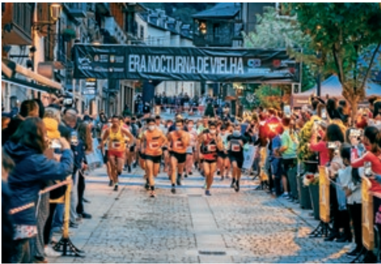
ERA NOCTURNA DE VIELHA

Es carrèrs de Vielha acuelheren eth passat 7 d'agost era 8au edicion d'Era Nocturna de Vielha, ua des corses classiques der ostiu ena Val d'Aran, organizada peth Club Athletic Val d'Aran. 500 participaires preneren part enes desparières distàncies premanides: Corses de 5 e 10 kms e Caminada populara "Paquita Gracia" de 5 kms. Atau madeish, era mainadèra tanben auec eth sòn espaci damb diuèrses corses infantiles per edats, en tot participar-i mès de 100 corredors. Est an passat non se podec celebrar aguesta pròva pera COVID-19, mès enguan s'a recuperat, en tot supausar un exit de participacion.