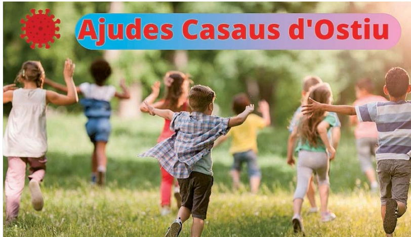
VIELHA E MIJARAN

Pendent aguesti darrèri dies, er Ajuntament de Vielha e Mijaran a realizat trabalhs en depòsit d'aigua de Vilac, entà garantir era seguretat. Damb aguesta intervencion s'a amiat a tèrme era separacion deth sistèma des valvules deth dera cloracion. D'aguesta manèra, s'assolide un bon foncionament des valvules, en tot evitar eth sòn contacte dirècte damb era cloracion. En aguesta actuacion s'a comptat damb eth personau dera brigada municipau e deth plan aucupacionau.