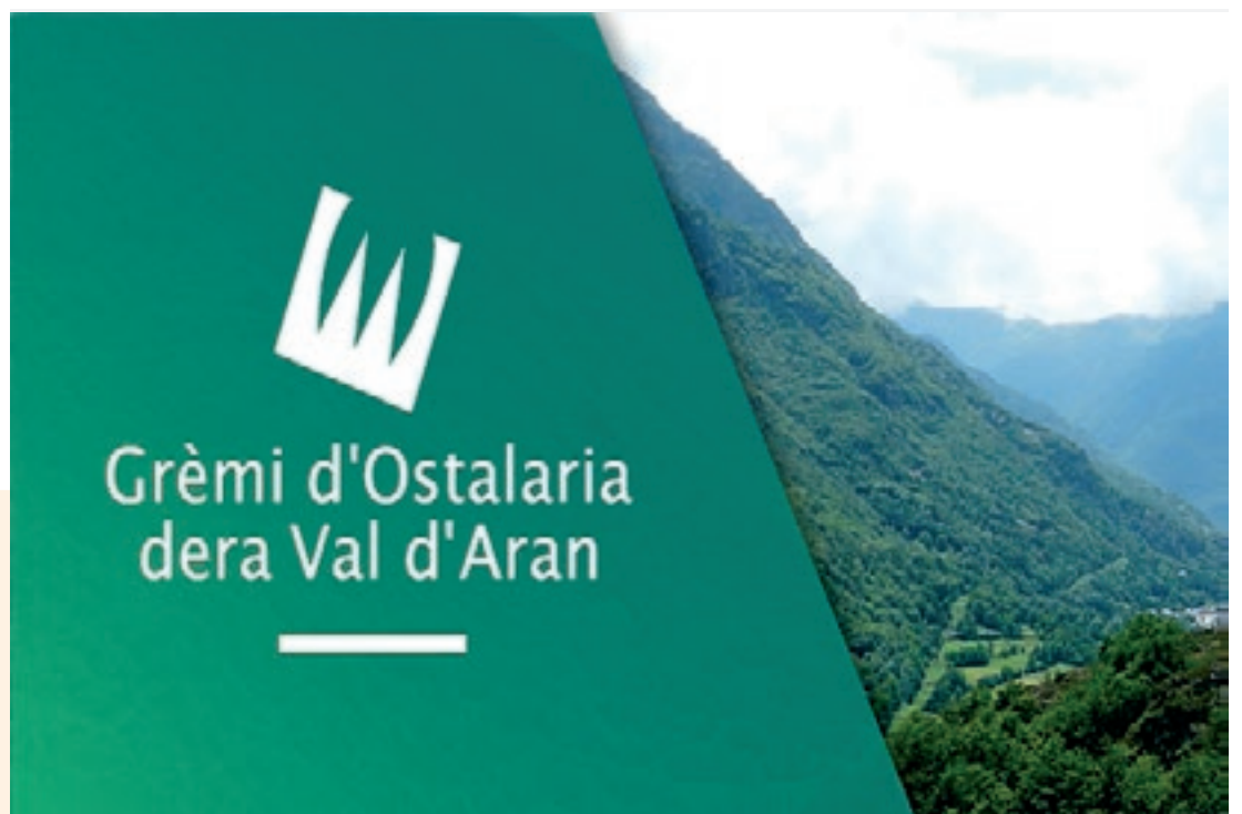
GRÈMI D'OSTALARIA D'ARAN