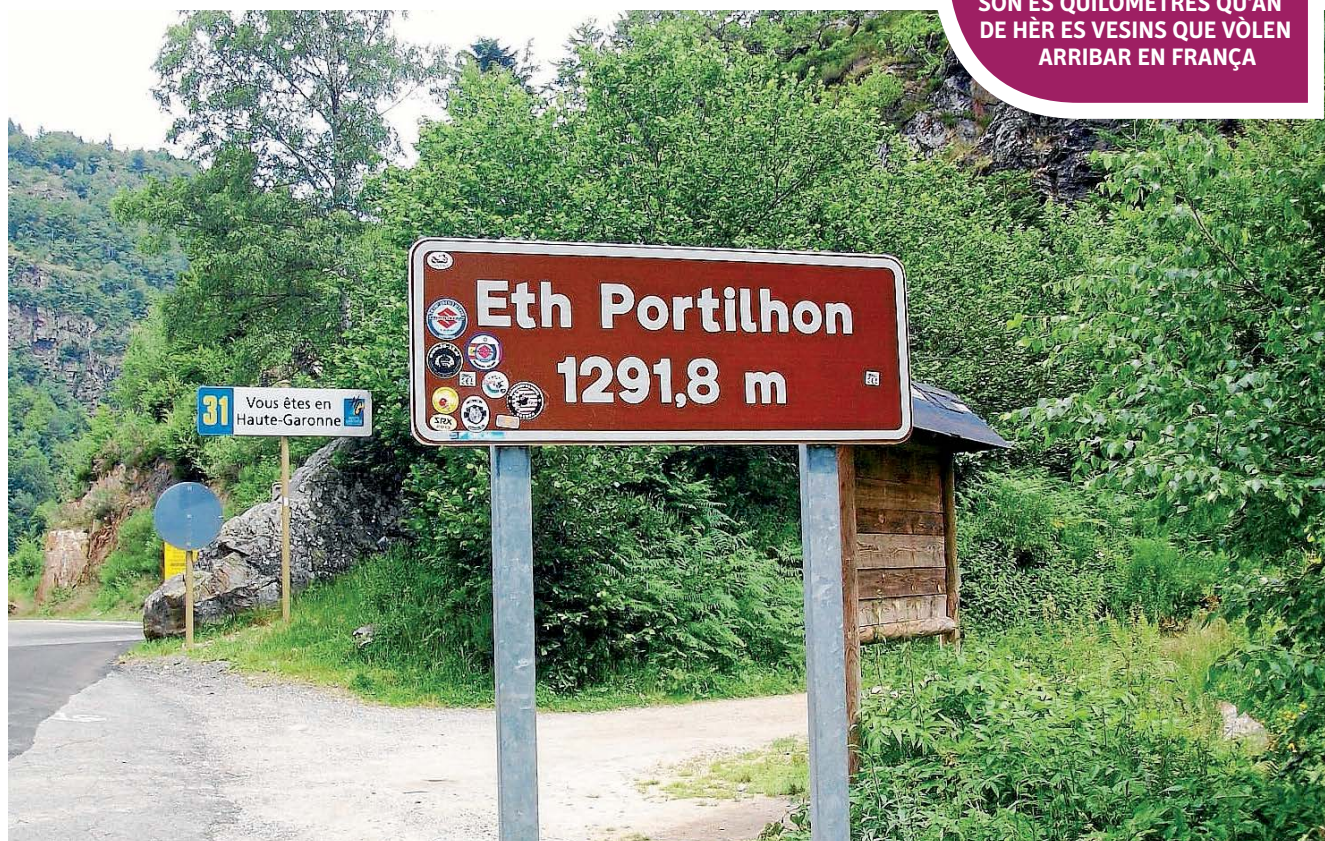
CONSEILH GENEALU D'ARAN

Eth govèrn d'Aran non desistirà ena demana de restituïr era circulacion en aguesta importanta via tara gent deth nòste territòri.