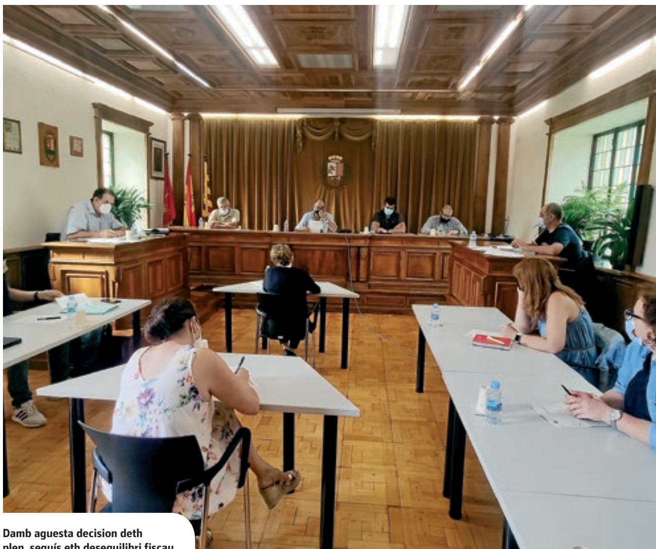
Damb aquesta decision deth plen, seguís eth desequilibri fiscau

Eth plen der Ajuntament de Vielha e Mijaran aprovèc eth passat 16 d'agost, en session extraordinaria, era revocacion dera pujada d'impòsti de cara a 2022, que siguec aprovada iniciaument en plen deth 28 de junhsèga. Aquesta decision generèc un debat public en diuèrsi sectors dera societat e, ara, aquesta suspensio supausarà qu'eth consistòri mantierà un grèu desequilibri fiscau rosigat hè mes de 30 ans e que seguirà de cara as pròplèu ans, e genèrè eth besonh de que s'age de daurir un debat public entà poder establir naues mesures e solucions entà poder reprèner er equilibri des compdes publics de Vielha e Mijaran. Sense aquesta pujada des impòsti i aurà dificultat entà poder amiar a tèrme actuacions importantes en servicis basics, coma ei eth mantenement e melhora deth hilat e des depòsits d'aigua. En aquest sens, s'an realizat granes inversions en subministrament d'aigües mès contunhe pendent actuar en 30% deth hilat municipau entà actualizar-lo, ath delà d'intervier en 11 des 14 depòsits d'aigua existents qu'an mès de 50 ans e presenten damatges estructuraus, pr'amor que non an rebut inversions des deth sòn bastiment.