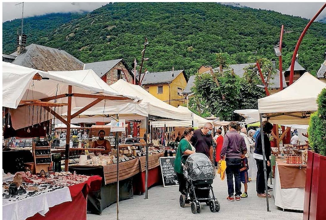
AJUNTAMENT DE LES

Cada deluns d'aguest mes d'agost, Les recep era activitat "Mercats d'Aran" prebotjada peth Conselh Generau d'Aran e per Foment Torisme Val d'Aran, damb era que se preten méter en valor es productors d'alimentacion, artesanía e d'auti elements autoctòns dera Val d'Aran, en tot profitar era nauta preséncia de torisme que i a en territòri pendent er ostiu. Era prumèra jornada siguec eth passat 2 d'agost, e en totau son 5 jornades que i aurà enquia finalizar eth pròplèu 30 d'agost. Pendent aquestes sessions, tanben se pòt gaudir de musica e balhs aranesi, coma siguec eth cas dera Còlha Santa Maria de Mijaran, que sigueren presents ena jornada inaugurau.