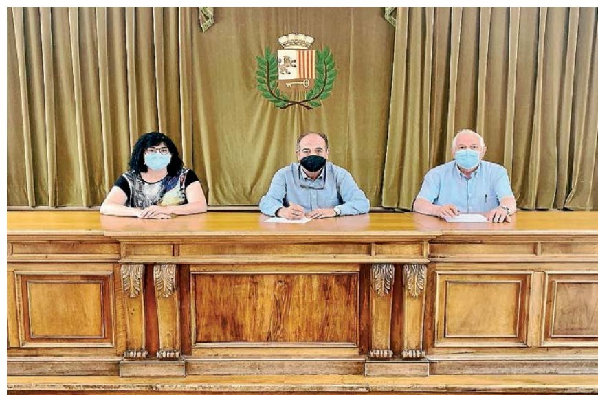
VIELHA E MIJARAN

Er Ajuntament de Vielha e Mijaran a renauit eth convèni de colaboracion damb era entitat Càritas d'Urgell, entà ajudar as familhes vulnerables e en risc d'exclusion sociau deth municipi qu'an estat afectades pera aparicion dera COVID-19. Aguesta iniciativa s'inicièc est an passat, damb ua ajuda de 10.000 €, e enguan s'a ampliat damb ua partida de 15.000 €, en tot plaçar-se en dus ans en un totau de 25.000 €. En 2020, gràcies a d'aguest convèni, se podec ajudar a 26 familhes, damb un totau de 78 beneficiaris, en un totau de 50 ajudes dirèctes. Aguesta ajuda va dirigida ath loguèr, subministraments deth larèr e aqueriment d'aliments fresqui.