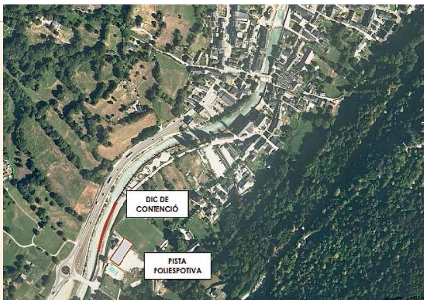
AJUNTAMENT DE LES

Pendent es dimenjades, Les acuelh era celebracion des mercats artesenaus e de productes de proximitat deth Pirenèu. Ua escasença entà qu'es vesins e visitaires qu'acuelh eth pòble pendent eth mes d'agost, poguen gèsser pes carrèrs, en tot auer era possibilitat de crompar tot tipe de productes de 2au man, minjar, artesanía, e d'auti productes a bon prètz. Aguest mercat s'inicièc eth passat dissabte 7 d'agost e se poderà gaudir e visitar enquiath pròplèu dimenge 29 d'agost.