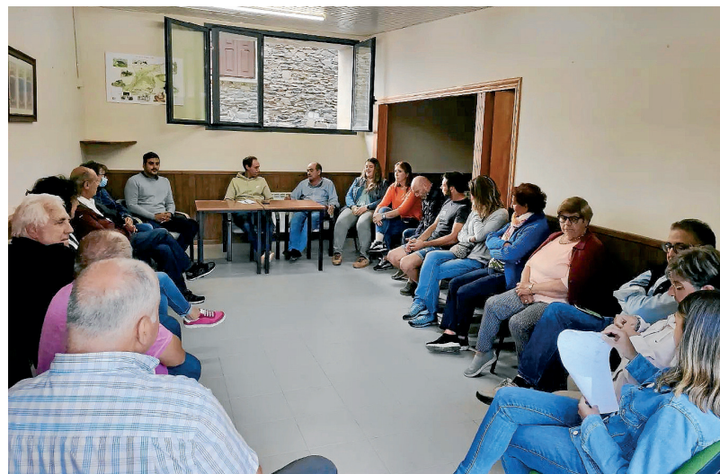
AJUNTAMENT DE VIELHA E MIJARAN

Er equip de govèrn der Ajuntament de Vielha e Mijaran a iniciat pendent aguesta primavera un cicle d'amassades damb es vesins/ies des diuèrsi pòbles deth municipi, en tot informar sus es accions realizades pendent es darrèri 3 ans, e escambiar opinions damb eri sus es besonhs deth pòble. En aguest sens, ja s'an realizat amassades en Betren, Casau, Arròs e Vila e Vilac, e ei previst que pendent es pròplèu setmanes s'amien a tèrme era rèsta de pòbles. En tot cas, des deth consistòri s'informarà as vesins deth dia, ora e lòc dera amassada, en tot hèr-lis arribar un comunicat. Aguesta accion ja s'auie amiat a tèrme ans endarrèr, abantes dera arribada dera pandèmia.