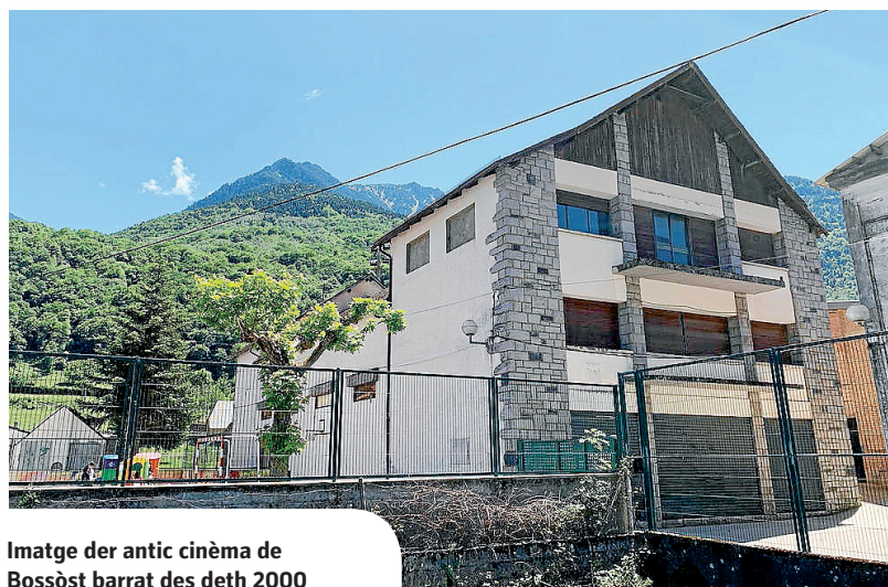
Imatge der antic cinèma de Bossòst barrat des deth 2000

Eth plan de dinamizacion comercial entà Bossòst a començat a caminar, un plan que venguem de compartir entre er Ajuntament e eth Conselh General, per miei d'un vidèu promocional e dera iniciativa entà hèr de Bossòst un espaci dubèrt ara creacion der art murau enes veirines deth pòble, entà combàter er efècte dera persiana barrada e hèr agradiua era passejada pes nòsti carrèrs. Totun, Bossòst aufrís dejà ua bona experiéncia comercial per miei der extens hilat de botigues damb ua ofèrta de qualitat, variada, suenhada, e un tracte propèr, que la singularizen. De hèt, aguesta campanha met er accent en papèr deth comèrç coma experiéncia d'autenticitat, singularitat e diferenciacion, restacada, ath delà, damb es valors patrimonius, naturaus e culturaus deth municipi, pr'amor qu'enten Bossòst de forma integráu. En aquest sens, es administracions publiques, dera man deth sector comercial, an de susvelhar per crear es condicions possibles entà un entorn favorable ad aguesta experiéncia, que met de relèu era qualitat deth servici comercial. Bossòst pòt devier atau un municipi renovat, que manten eth sòn caractèr eminentment comercial en plen sègle XXI, damb diuèrsi atractius per pòden perméter captar nau visitaires e generar naues propòstes, em tot restacar eth comèrç, era restauracion, era ostalaria, un entorn excepcional, laguens d'un mercat globau qu'a cambiat eth paradigma deth comèrç.