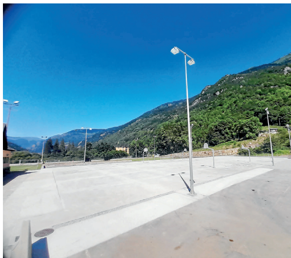
AJUNTAMENT DE LES

Era següenta fasa supausarà eth liurament dera plataforma damb es superfícies der entorn e es accèssi ara pista. Era pintura dera plataforma e eth barrament metallic perimetrau se realizarà pendent er ostiu quan s'age assolidat era plataforma. En un costat s'i plaçarà ua pista half-pipe e ua estacion outdoor de calistènia.