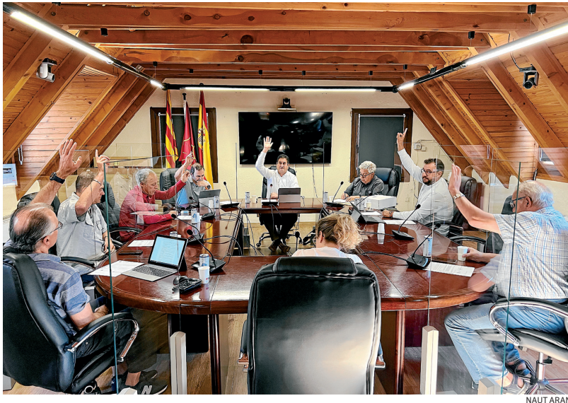
Imatge deth darrèr Plen der Ajuntament de Naut Aran

ETH MACROCOMPLÈX DE 4500 MÈTRES QUARRATS SEGUÍS ENDAUNT GRÀCIES ARA APROBACION DETH PLEN PER UNANIMITAT