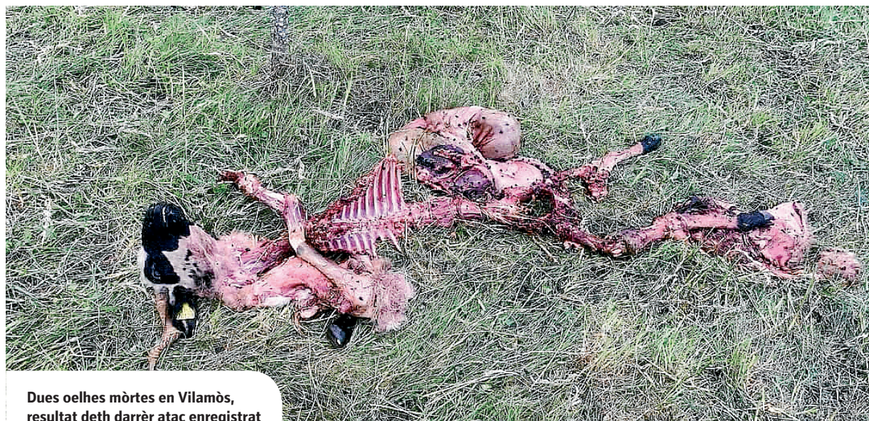
Dues oelhes mòrtes en Vilamòs, resultat deth darrèr atac enregistrat

ENGUAN S'AN DETECTAT UN TOTAU DE SÈT ATACS D'OS EN DESPARIÈRS PARÇANS DERA VAL D'ARAN, MÈS SE DECONEISH QUIN OS PÒT AUER ESTAT ER AUTOR DES EVENIMENTS