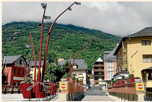
AJUNTAMENT DE LES