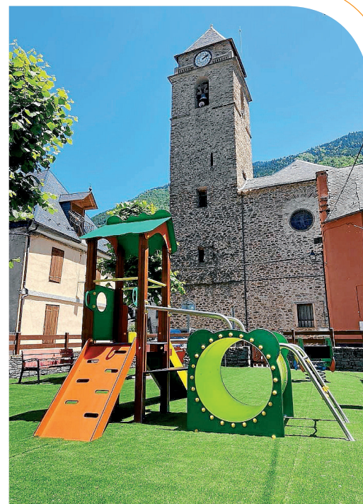
AJUNTAMENT DE LES

Er Ajuntament de Les a procedit a plaçar nau mobiliari urban en carrer Aran (jardinèras, entre d'altre). Tanben s'an realizat prètzhèts de pintura viau e places de parcatge, atau coma zònes de carga/descarga en carrer Aran e Plaça deth Conselh, en tot generar passi alternatiu e restriccions de veïculs.