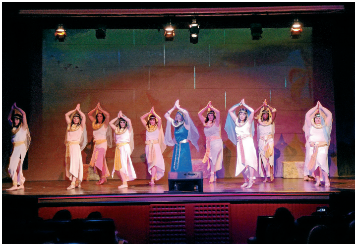
AJUNTAMENT DE VIELHA E MIJARAN

Deth 9 ath 12 de junh, Era Audiovisuau de vielha a acuelhut era representacion dera òbra de teatre musicau "Kytzia", creada e dirigida per Miguel Pineda. Ua òbra representada per ua trentia de persones, adults e mainadèra, ena que s'a recreat ua polida istòria ambientada ena cultura egipciana, mès damb un papèr fòrça important dera Val d'Aran, coma escenari fictici. Pendent es quate dies dera foncion, era sala pengèc eth pannèu d'entrades venudes. Es sòs requectadi anaràn destinadi ara mainadèra dera Associacion Espanhòla Contra eth Cancer que realize es colònies d'ostiu en Aran.