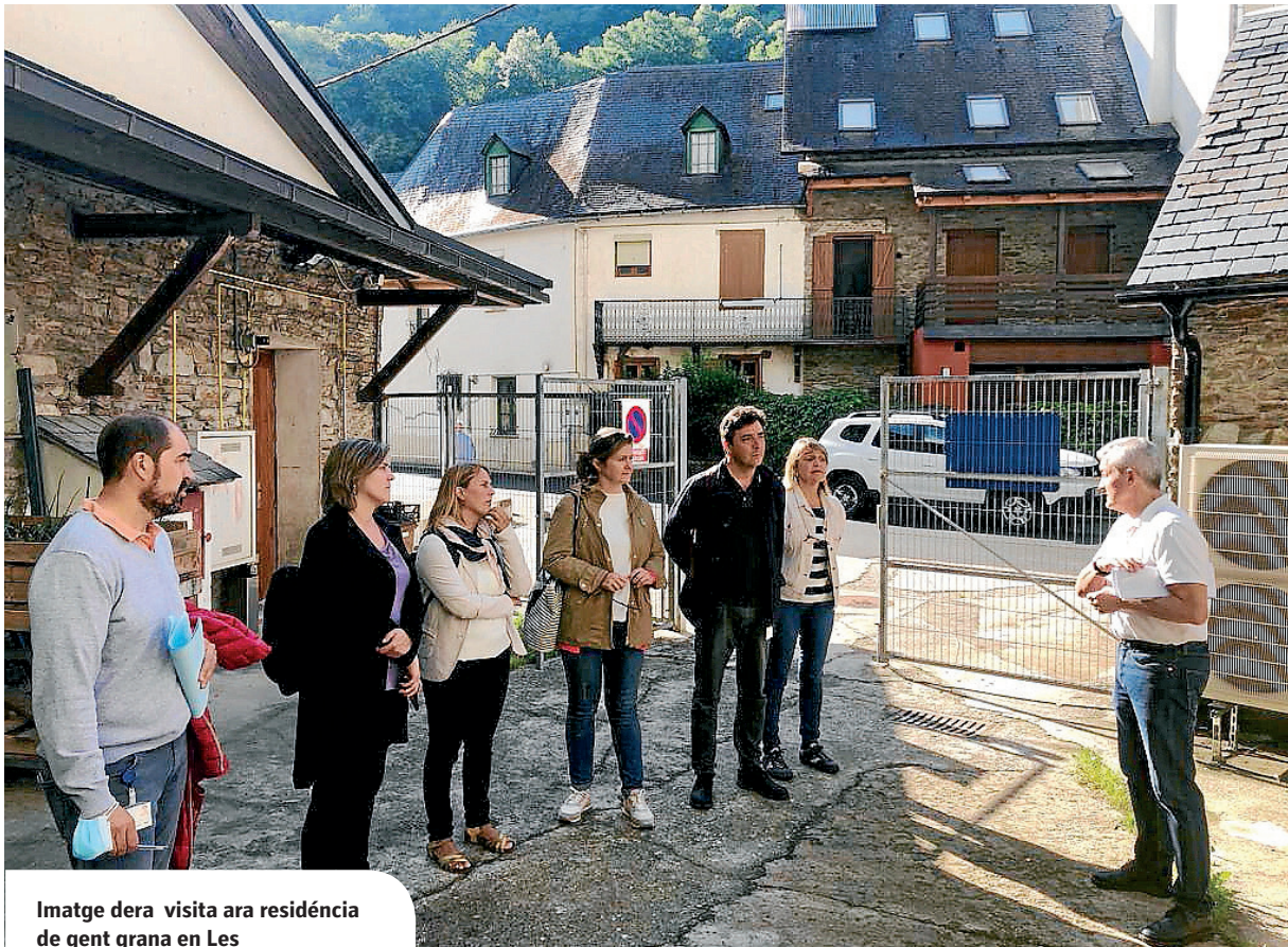
Imatge dera visita ara residència de gent grana en Les

Era residència compde actuauments damb 60 places e era possibilitat d'un convèni damb era Generalitat de Catalunya entath cofinançament des places concertades.