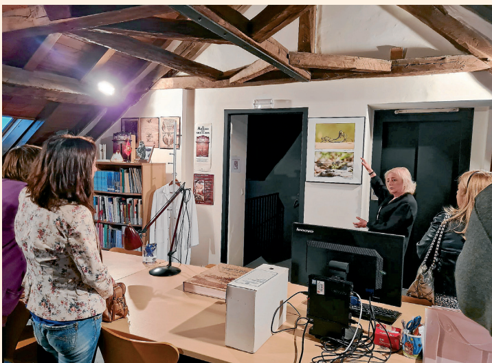
ARCHIU GENERAU D'ARAN

"KYTZIA" A ESTAT UN EXIT DE CONVOCATÒRIA, EN TOT AUMPLIR ERA SALA PENDENT ES QUATE DIES DE REPRESENTACION, A ON ERA IGUALTAT D'OPORTUNITATS ENTRE SÈXES A MERCAT ERA ISTÒRIA