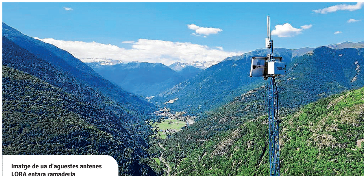
Imatge de ua d'aguestes antenas LORA entara ramaderia

SE PLAÇARÀN DUES NAUES ANTENES MEJANÇANT UA INTERVENCIÓN DETH CONSELH GENERAU D'ARAN ENTÀ PODER MILHORAR ERA EFICIÈNCIA EN AGUEST AIRAU