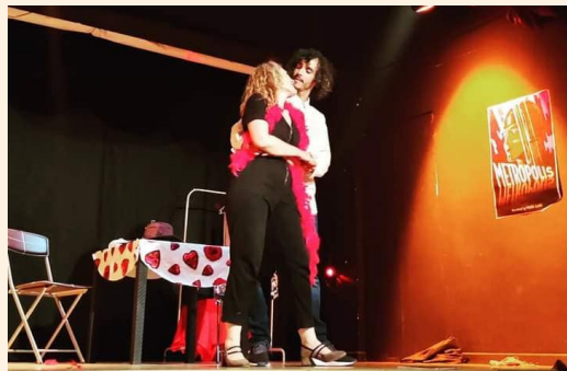
AJUNTAMENT DE LES