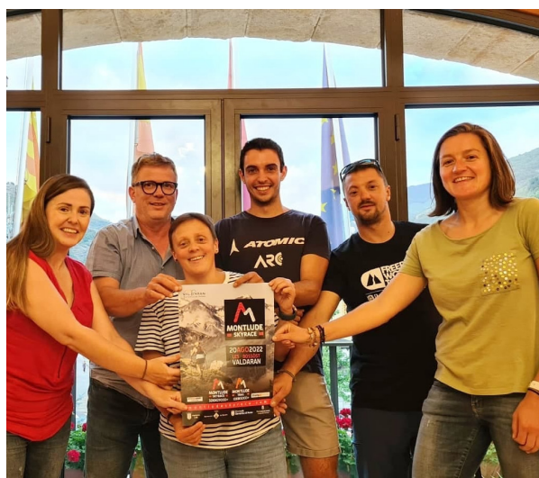
AJUNTAMENT DE LES

Era Montlude Skyrace torne e se celebrà eth 20 d'agost. Dempús de dus ans sense accion, enguan se recupèrè aguest eveniment que trauèsse bona part des endrets de Baish Aran. I aurà dues modalitats: era Montlude Skyrace (32 kms e 2900 mètres de desnivèu positiu), e era Montlude Trail (10 kms e 500 mètres de desnivèu positiu). Amdues damb gessuda en Bossòst e arribada en Les. Des der Ajuntament de Les s'an amiat a tèrme amassades damb era Associacion Gent de Montlude, organizadora des corses, entà premanir era planificacion e coordinacion der eveniment.