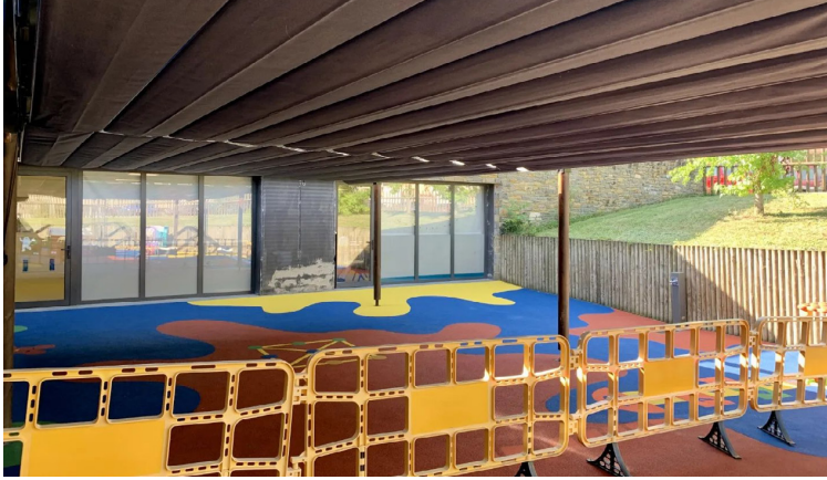
AJUNTAMENT DE VIELHA E MIJARAN

Er Ajuntament de Vielha e Mijaran a instalat un radar pedagògic ena Avenguda Pas d'Arrò de Vielha (ath cant des antigues casèrnes militars). Aguest nau pannèu informatiu mòstre era velocitat ara que circulen es veïculs per laguens deth pòble, damb er objectiu de conscienciar as conductors de qu'an d'anar ara velocitat avienta e, per tant, aumeute era seguretat ena via. Damb aguesta accion se vò sensibilizar ara ciutadania en tot fomentar era convivència de coches e pedons.