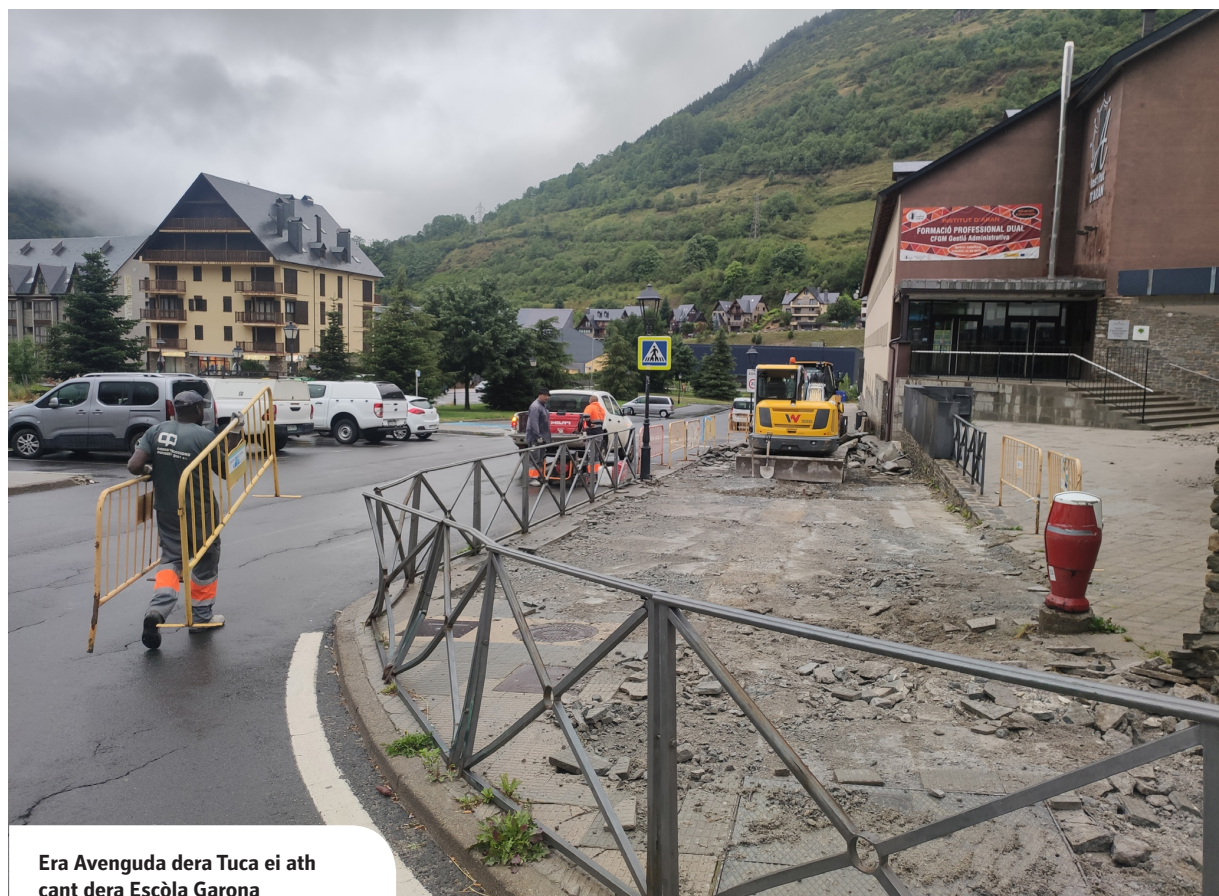
Era Avenguda dera Tuca ei ath cant dera Escòla Garona