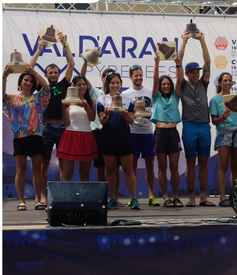
AJUNTAMENT DE VIELHA E MIJARAN

Participeren 3700 corredors arribadi de 71 nacionalitats