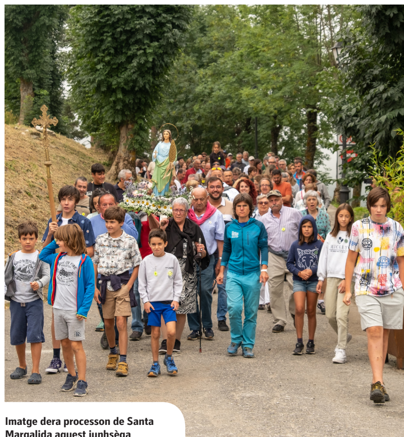
Imatge dera procession de Santa Margalida aguest junhsèga

tard, en an 1962, un grop de vesins, de manèra voluntària, decidic tornar a bastir era ermita de Santa Margalida entà poder tornar-la dignificar e aufrir un nau espaci de devocion. En aguest madeish periòde, se hèc ua procession commemoratiua damb ua Vèrge que siguec aufrida ara EMD per part d'un òme que hège extraccion de jançana ena madeisha poblacion de Bagergue. Ara, 60 ans mès tard per primèr viatge en tot aguest temps, se torne a recuperar aguesta tradicion en tot commemorar justaments era data deth lheuament dera ermita.