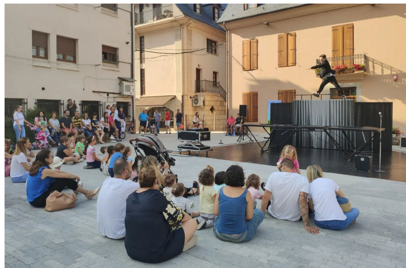
AJUNTAMENT DE VIELHA E MIJARAN

Pendent es mesi de junhsèga e agost, er Ajuntament de Vielha e Mijaran aufrís un ample calendari d'activitats gratuïtes entà tota era família, laguens deth projècte "Ostiu en Família". En aguest cicle d'activitats se pòt gaudir de teatre familiar en carrèr (9 de junhsèga, 7 e 21 d'agost), jòcs infantils de husta (2, 16 e 30 de junhsèga e 27 d'agost), concèrt familiar (2 d'agost ena glèisa de Mijaran), Biblio-Piscina (toti es dimèrcles ena piscina exteriora deth Palai de Gèu), er arbe des chuquetes (11 d'agost en Plan Batalhèr) e era Hèira deth Playmobil (deth 12 ath 15 d'agost en Centre Polivalent). Cada setmana traparatz activitats tà realizar en família.