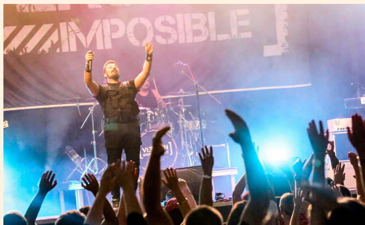
AJUNTAMENT DE BOSSÒST