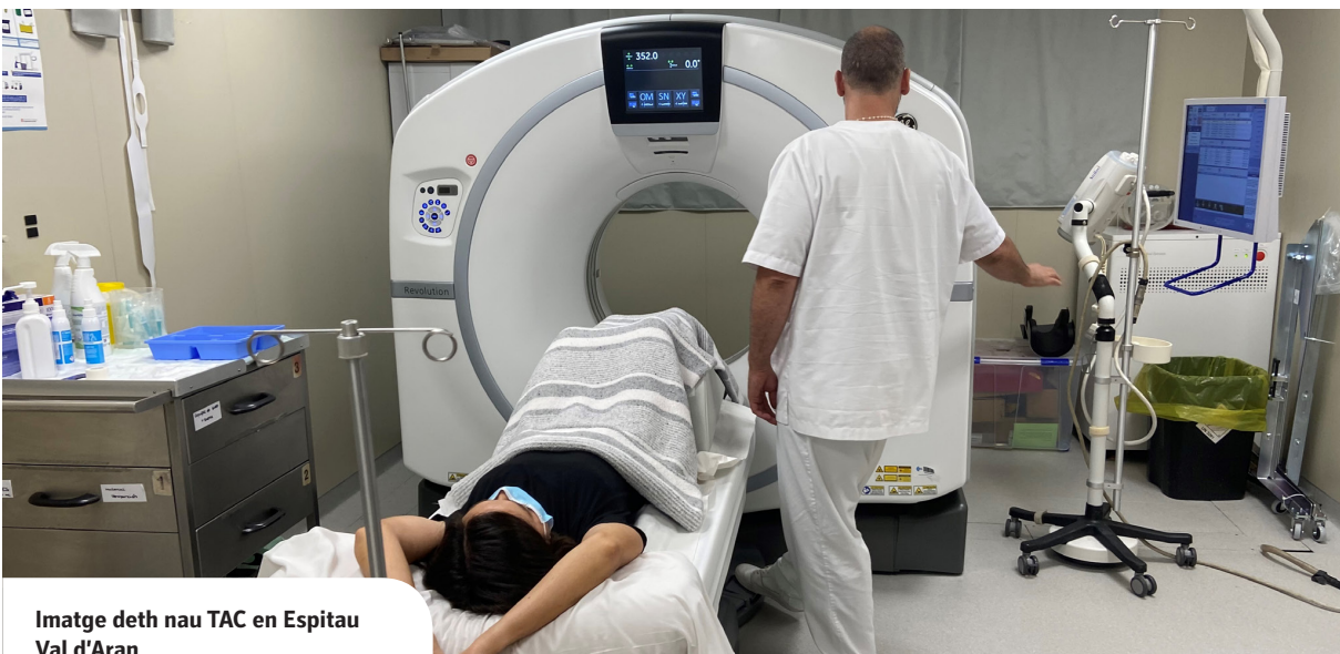
Imatge deth nau TAC en Espitau Val d'Aran

GRÀCIES ARA SUBVENCION DERA DEPUTACION DE LHÈIDA DE 246.000 ÈUROS S'A POGUT AMIAR A TÈRME AQUESTA INVERSION D'URGÈNCIA ENTARA MILHORA DERA VIDA DES ARANESI