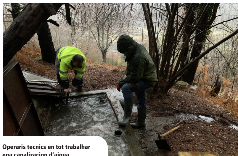
Operaris tecnicos en tot trebalhar ena canalizacion d'aigua

cion deth plan d'inversions (PUOSC), e des carrèrs de Marra, trauèssa de Sorieus e deth carrèr Sant Fabian damb subvencion dera Deputacion de Lhèida. Ath delà, tanben s'invertirà ena milhora des infraestructures de captacion e distribucion d'aigua de consum atau coma enes pretractaments procedenti des hònts superficials, damb finançament dera Deputacion e era Agencia Catalana der Aigua. Tanben se repararà era cabana deth Cric e s'acondicionarà Camon.