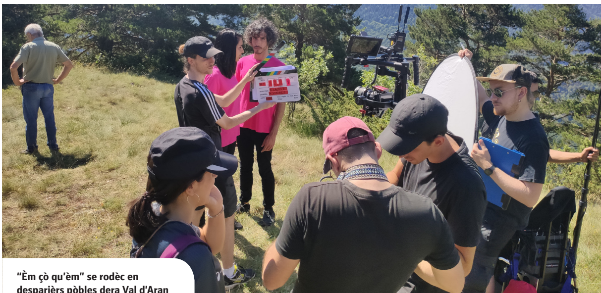
"Èm çò qu'èm" se rodèc en desparièrs pòbles dera Val d'Aran

AGUESTA SÈRIE ARANESA IMPULSADA PETH GOVÈRN DETH CONSELH GENERAU D'ARAN DERA MAN DE LLEIDA TV, COMPDE DAMB 12 CAPITOLS ENA NAUA SASON, QUE SE PODERÀ VEIR ENA PRÒPLÈU TARDOR