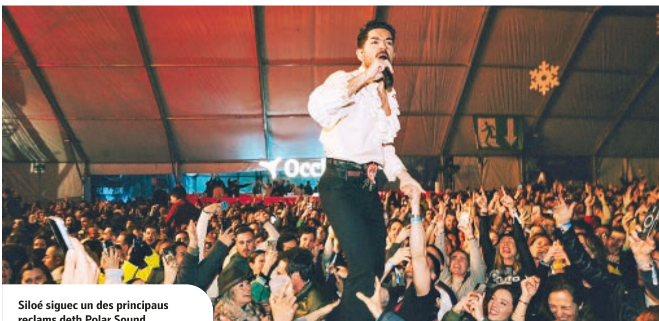
Siloé siguec un des principaus reclams deth Polar Sound

ETH PARCATGE DERA CÒTA 1.500 DE BAQUEIRA S'AUMPLIC ES DUES JORNADES DETH HESTAU ES DIES 13 E 14 DE MARÇ, E JA S'A CONFIRMAT ERA 7AU EDICION ENTÀ 2027