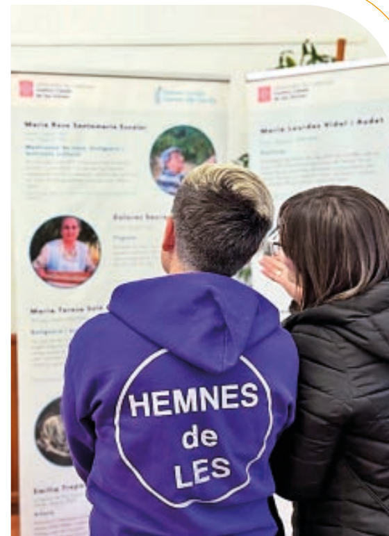
HEMNES DE LES

Pendent es darrèri dies s'a apariat ua pana que produsie ua pèrta d'aigua en subministrament ena zòna de Benqué. S'amièren a tèrme trabalhs d'excavacion e reparacion, en tot restablir eth servici. Atau madeish, tanben s'a abilitat er accès as finques rustiques de Benqué a traùs deth Plan des Sucs.