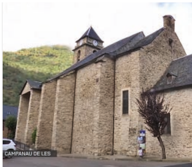
CAMPANAU DE LES

Es òbres en campanau dera glèisa de Sant Joan Baptista de Les auancen en sòn procès de reabilitacion. Actuaument se trabalhe ena estructura dera naua escala e ena consolidacion des murs a on s'auien detectat quauques henerècles. Quan finalizen es òbres, eth campanau poderà èster visitable damb visites programades e es campanes e eth relòtge tornaràn a foncionar. "D'ençà der Ajuntament de Les contunham en tot apostar pera conservacion deth nòste patrimòni coma motor culturau e economic deth municipi", soslinhe eth baile der Ajuntament de Les, Andreu Cortés.