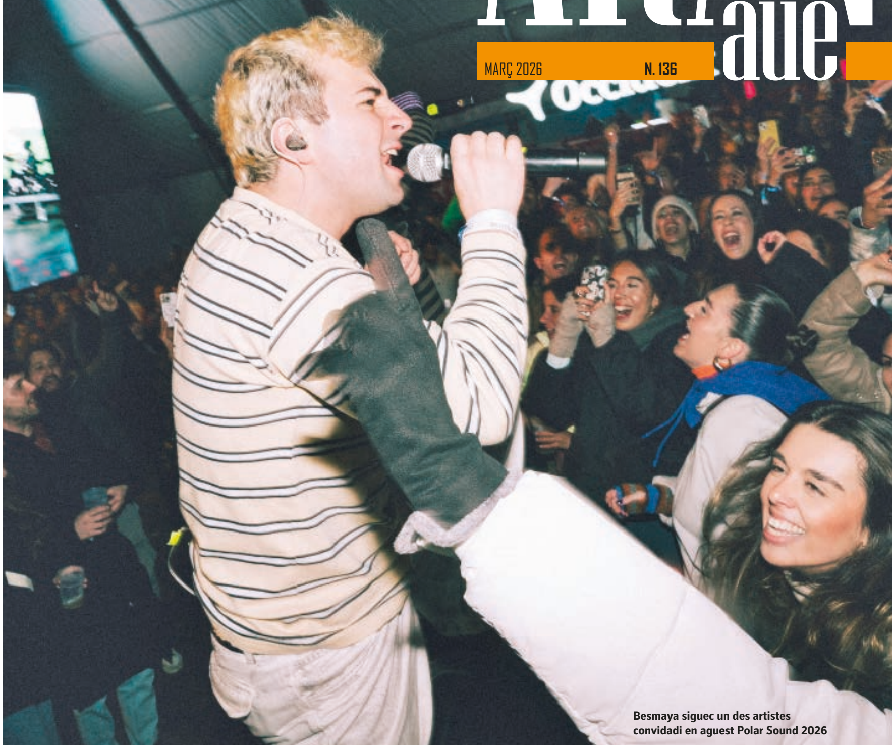
Besmaya siguec un des artistes convidadi en aguest Polar Sound 2026