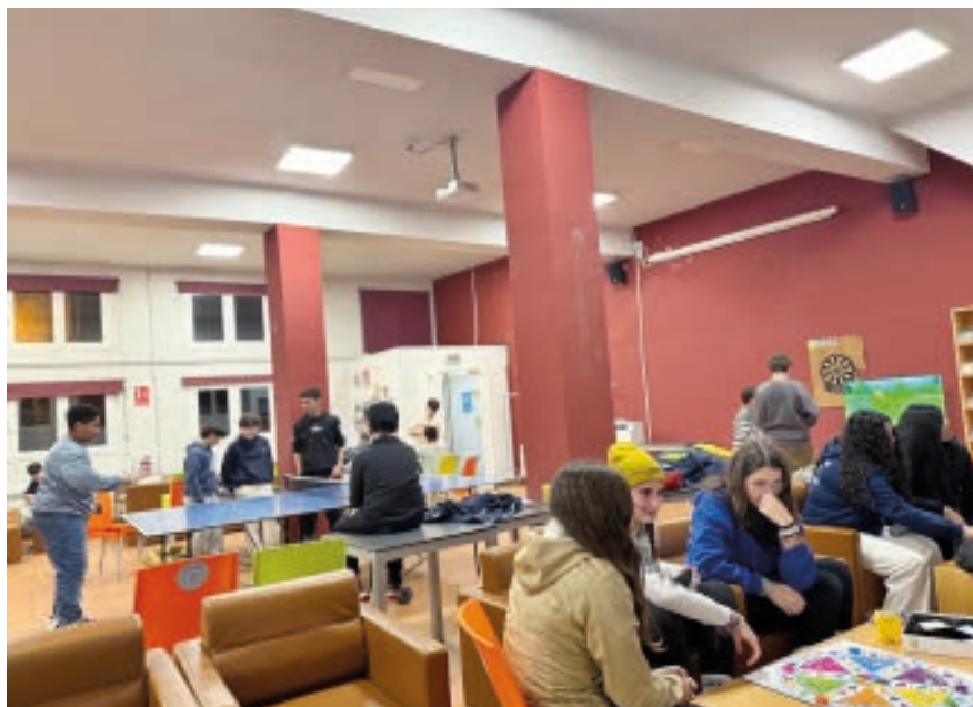
AJUNTAMENT DE VIELHA E MIJARAN

S'omogeneizarà eth reglament des equipaments esportius