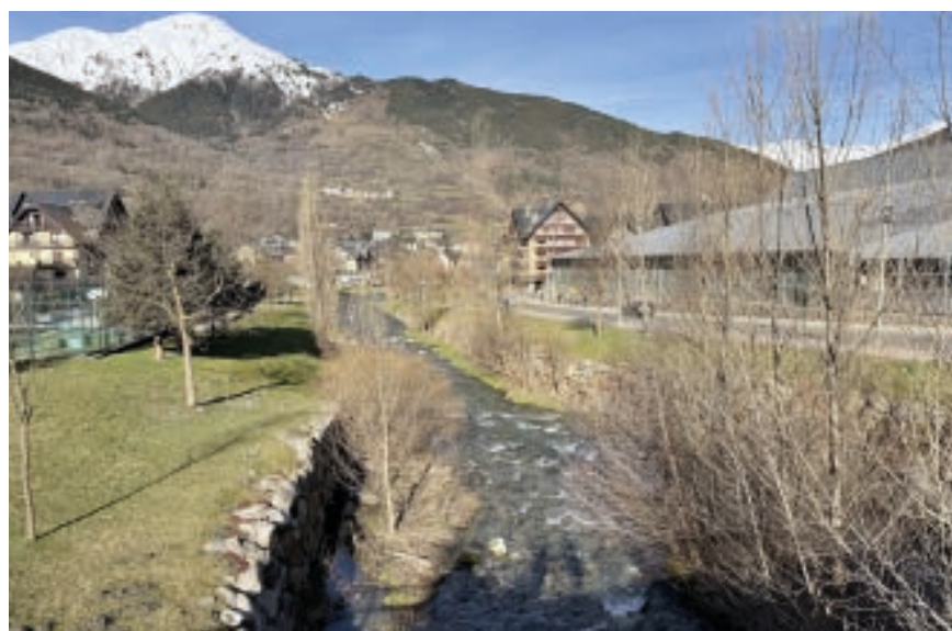
AJUNTAMENT DE VIELHA E MIJARAN

Er Ajuntament de Vielha e Mijaran recep era autorizacion dera Confederación Hidrográfica del Ebro entà desvolopar milhores en lhèt der arriu Garona en Vielha e Betren, dempús de 3 ans de demanes e amassades entre andues administracions entà desencalhar aguesta problematica mediambientau. Es actuacions comprenen trams urbans e interurbans d'ua longada de 2.957 mètres e ua superfícia totau de 5.294,84 m2 en zònes afectades per inundacions. Es trabalhs consistiràn ena retirada de rominguères invasives qu'aucupen eth laterau der arriu, era neteja de marges e des pònts tà evitar acantieraments vegetaus, e era retirada d'arbes mòrti.