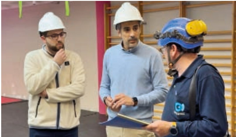
AJUNTAMENT DE VIELHA E MIJARAN

Er Ajuntament de Vielha e Mijaran a iniciat ua pròva pilòt damb era installacion de cinc paperères intelligentes distribuïdes en èish comerciau de Vielha, damb er objectu de millorar era eficiència deth servici de neteja e era qualitat der espaci public. Incorporèn placa solara e un sistèma de compactacion que redusís eth volum des residus depausadi, en tot aumentar era capacitat utila de cada paperèra e en tot amendir era freqüència de uedat.