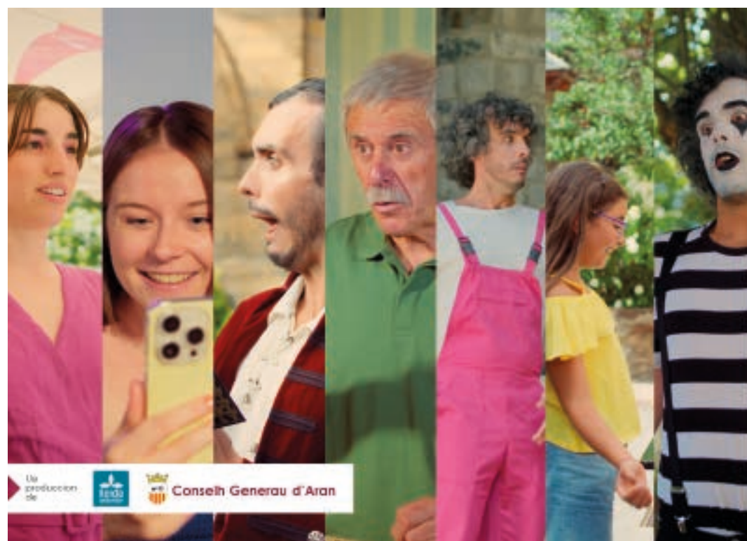
Una produccion de Conselh Generau d'Aran