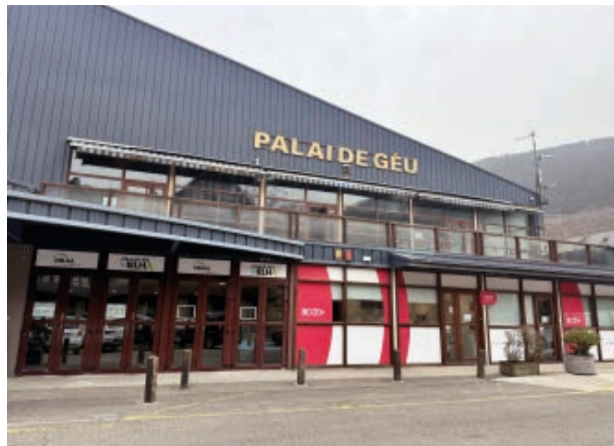
AJUNTAMENT DE VIELHA E MIJARAN

S'omogeneizarà eth reglament des equipaments esportius