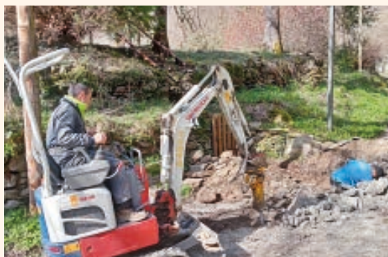
AJUNTAMENT DE LES