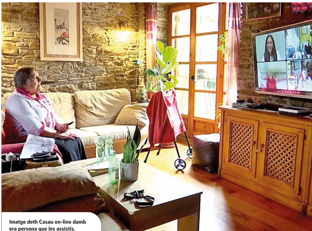
Imatge deth Casau on-line damb era persona que les assistís.