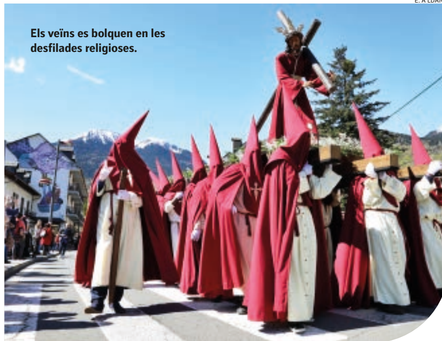
Els veïns es bolquen en les desfilades religioses.

Divendres Sant hi ha dos cites gravades a foc. La primera, la processó del Viacrucis, que arranca a les deu. La segona, ja de negra nit, la processó del Sant Enterrament o del Silenci, que es posa en marxa a dos quarts d'onze. Centenars de veïns de la localitat s'uneixen per portar els passos i es retroben el Diumenge de Pasqua, convocats per la processó deth Sant