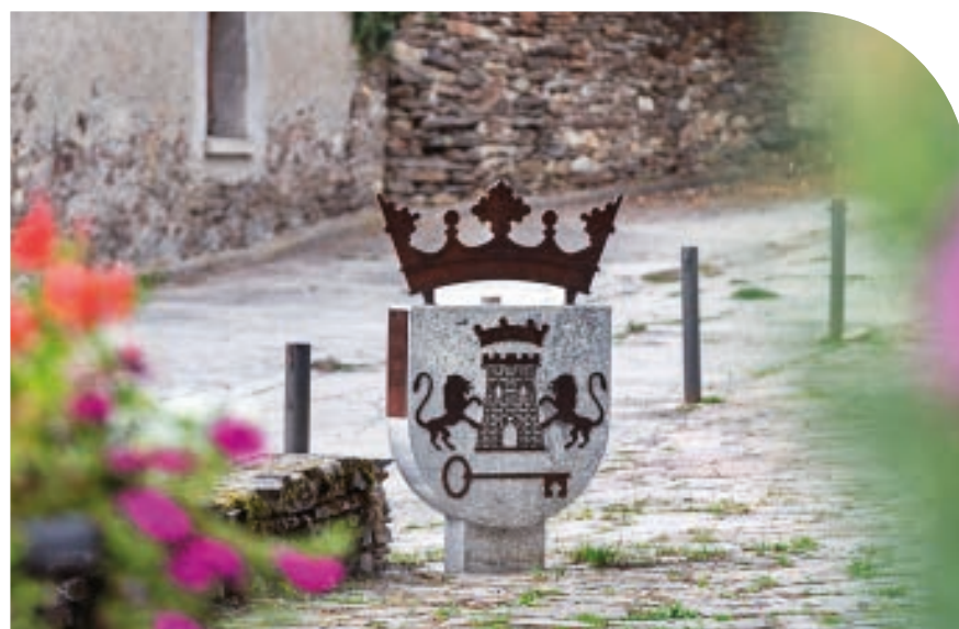
Les es transporta al passat medieval amb 'Castèth'.

metres es troben diferents fites, com una recreació de l'espasa del segle XV que va sortir a la llum arran d'una excavació arqueològica; un mapa de la Val; l'Haro; la flauta, jocs de taula com el tres en ratlla; el galin, una mesura originària de l'Aran; l'escut local o reproduccions de canals i projectils. Més distància, 3,2 km, s'ha de cobrir en la ruta dedicada a la fauna salvatge, que arranca de Bossòst fins al barranc de Margalida i torna al punt inicial. Mitjançant diverses escultures repartides per tot el trajecte es desvetllen curiositats, hàbits i l'hàbitat