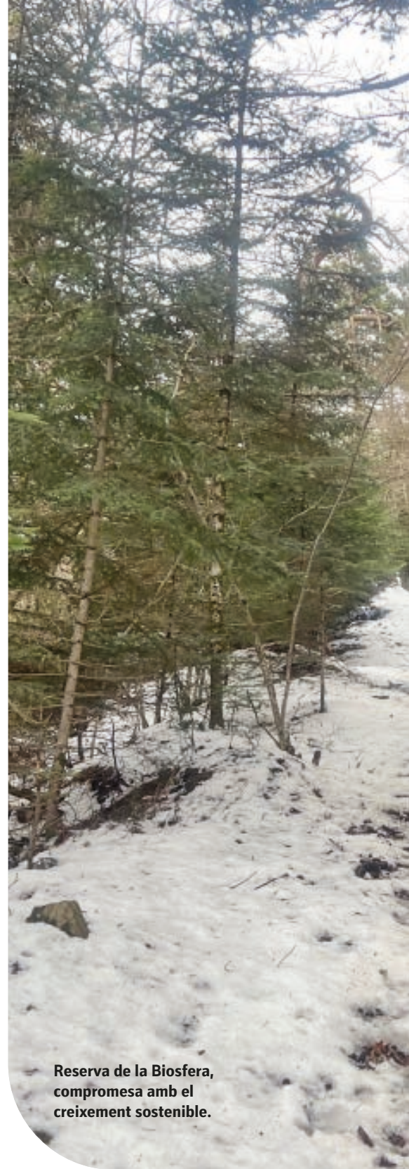
Reserva de la Biosfera, compromesa amb el creixement sostenible.

Una rica gastronomia que tant sedueix amb sabors ancestrals com amb cuina d'autor; artesans que treballen materials vinculats a la terra o un comerç on la qualitat i varietat és la tònica identifiquen l'oferta aranesa. I per postres, més de 10.000 places d'allotjament turístic, als quals se sumen uns 22.000 llits en segones residències. Fet i fet, són els vímets amb què la Val basteix el seu atractiu. I que ha estat reconegut com a Reserva de la Biosfera. Tot plegat implica un compromís amb la conservació de la biodiversitat i garanteix que les pròximes generacions en puguin fruit. Diversos projectes en marxa aporten el seu gra (o grans) de sorra al creixement sostenible. Aran vol volar alt, però no a qualsevol preu.