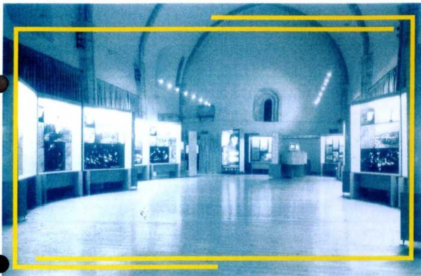
Exposicion "Art Rupèstre"

Actualment s'esta treballant ena exposicion "Bruisheria, insolitos objetos y fantasticas criaturas" que s'inagurarà eth pròplèu 28 de noveme e era exposicion "Fauna amenaçada" que la presentaram eth 19 de hereuèr de 2003.