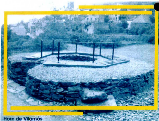
Horn de Vilamòs

Fundació Catalana per la Recerca, se daurirà era Fabrica dera Lan.