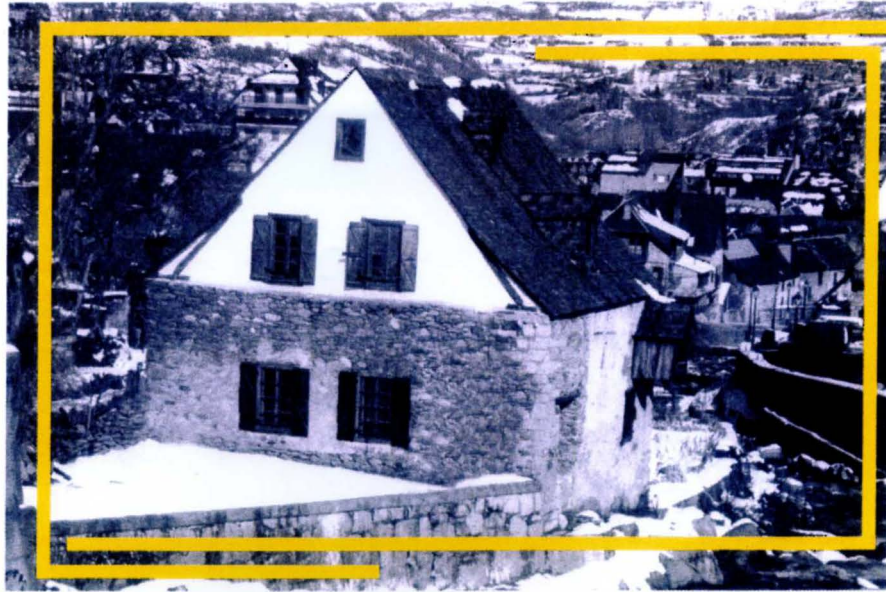
Fabrica dera Lan