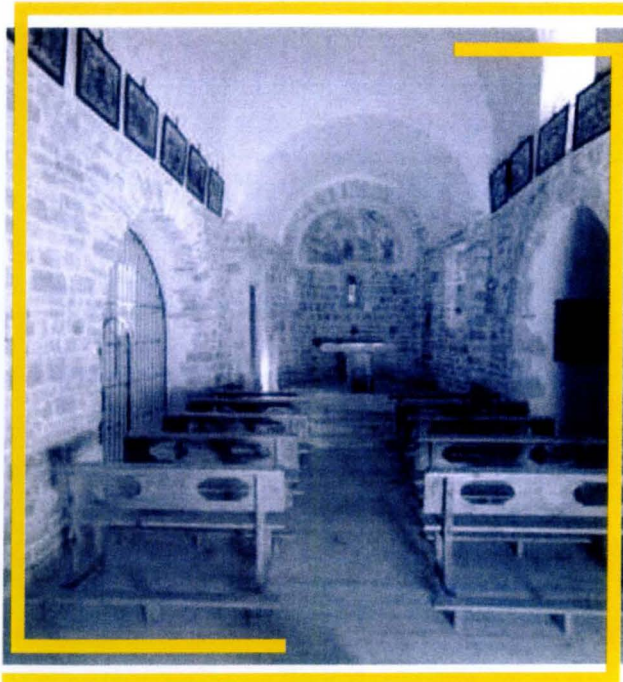
Era glèisa de Betlan ena actualitat

intervencion pugèc 4 milions de pessetes qu'a sufragat ena sua totalitat era Conselheria de Cultura deth Conselh Generau d'Aran.