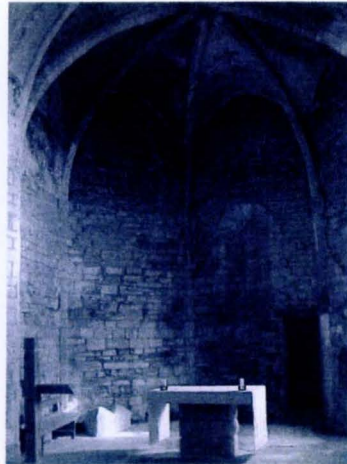
Era Glèisa de Sant Estèue ena actualitat e abans dera restauracion