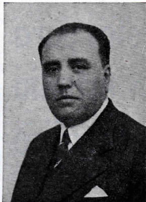
Excmo. Sr. D. Eduardo Aunós

Hijo de padre aranes, en su casa solariega de Las Bordas, captó de la lira perenne de aquellos montañes toda la poesía que encierra su nutrida producción literaria, que comenzó editando el periódico escolar «Ráfagas», en multicopista, siendo aventajado alumno del Colegio leridano de los Hermanos Maristas. Después, El Escorial, la pluma y el verbo. El éxito luego: Ministro, Embajador, político, publicista, músico y siempre poeta.