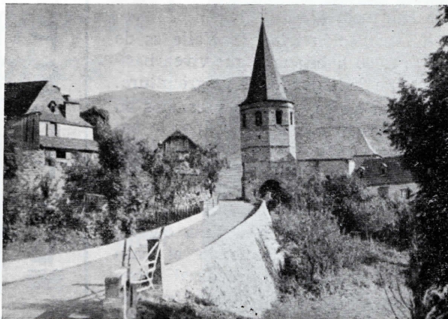
Camino de Gausach

El Valle de Arán es el único valle pirenaico de carácter atlántico perteneciente a España. Integrado en la provincia de Lérida (partido de Viella), se halla situado en el extremo noroeste de Cataluña, entre los 42°, 30' y 42° 50' de latitud Norte y los 1° 5' y 0° 35' de longitud Este de Greenwich, y limita al Norte y Oeste con los departamentos franceses de Ariège y Haute Garonne y al Este, Sur y Sudoeste con Cataluña.