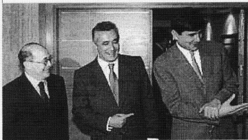
Javier Arenas, er enquia ara ministre de Tralalh, acompanyat deth secretari generau de Tralalh e eth sòn successor en Ministèri de Tralalh, Manuel Pimentel, ena sedença dera CEOE tath eth sòn president, José María Cuevas.

Er exministre de Tralalh e Ahèrs Sociaus, Javier Arenas, que serà eth nau secretari generau deth PP, a dit adiu personauments as secretaris d'UGT e CCOO, Cándido Méndez e Antonio Gutiérrez, respectivaments, e ath president dera CEOE, José María Cuevas, damb paraules d'arregraïment.