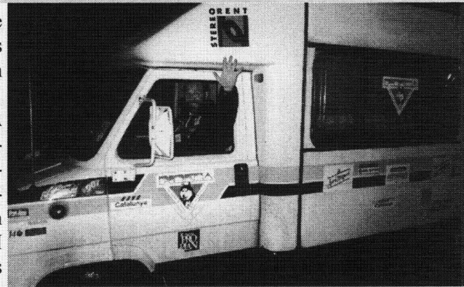
Es participaires de PIRENA en tot arribar ena Val.

Ager que se vederen per tot Aran es 4x4, es caravanes, es remòrques tamb cans e luges que venguien entà participar ena corsa d'aué. Tota ua nòta de color que se des-