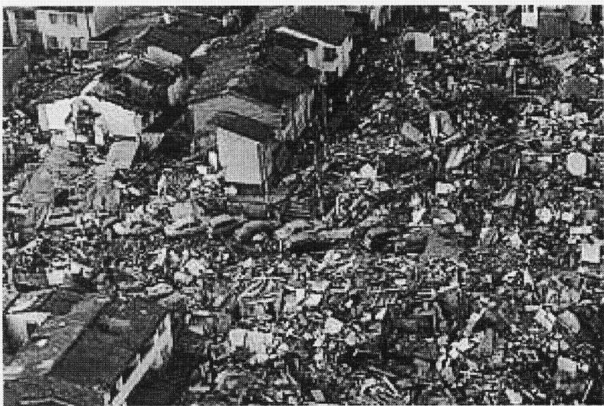
Podem veir com a quedat un barri residencial d'Armènia, a 110 quilomètres de Bogotà (Colòmbia), ua des zònes mès afectades dempús eth terratrem.

Era magnitud dera tragedia non pare de créisher