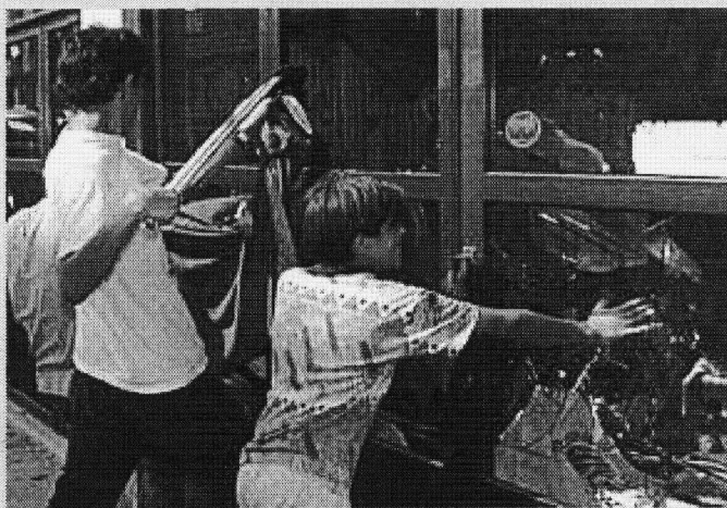
Es comèrci d'Armènia (Colòmbia) an estat assautadi pes ciutadans, que dauant era mancança de viuers an gessut tath carrèr entà cercar minjar. Pr'amor dera pòga organizacion, era ajuda umanitària enviada a estat magasemada pendent dus dies.