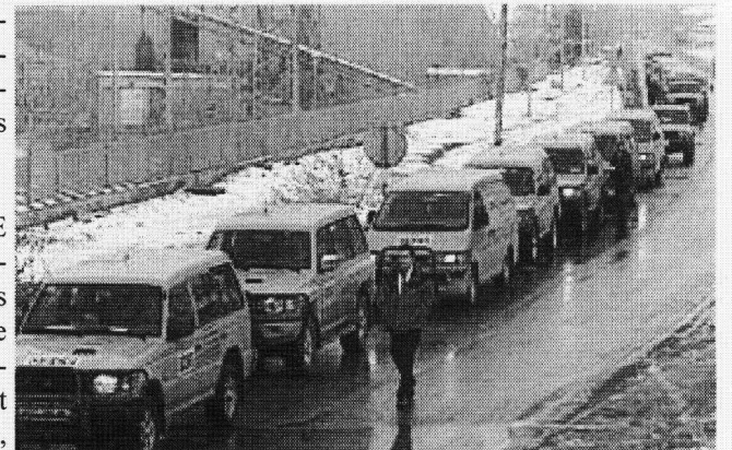
Es verificadors dera OSCE dèishen Kosòvo.

Mentretant, eth president de Iugoslàvia, Slobodan Milosevic, persute en refusar er acòrd de patz entà Kosòvo, que prevé ua substan-