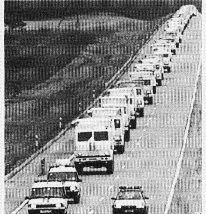
Ua caravana de camions russi pòrte ajuda umanitària entà Iogoslàvia

Mès eth Kremlin ac neguèc posteriorament, e era veu de Seleznyov dèc marcha endarrèr, en tot dèder qu'eth sòn cap auie estat malinterpretat. Foncionaris russi tanben tirèren 'aigua heireda' sus era possibilitat d'ua union tamb Iogoslàvia en un pròpleu fu-