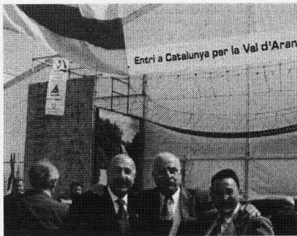
Eth president deth SITC, Sr. Bagó, entre eth sindic Barrera e eth conselhèr Batalla; ath hons eth 'pònt malai'.

Tanben se realizèc ua enquesta sus eth coneishement qu'es visitants en Saló auie sus era Val, des quaus se ne hèren ues mil. Eth dia 1 de mai eth SITC celebrèc eth "Dia de la Val d'Aran" tanben actes especiaus. Ath delà de hèr era pujada dera bandèra en tot s'entene er imne dera Val, se mestrèc un aperitiu -premanit peth Grèmi d'Ostalariá dera Val-, se hèren dances deth país en nomenat "balcó del món" dera Fira e ath delà -tamb toti es aunors- hec un recorrut peth Saló eth sindic acompanhat peth president e director deth SITC. Tanben se hec era dobla presentacion deth Plan de gestion mediambientau Val d'Aran sègle XXI e deth Plan d'acions de Torisme Val d'Aran. Coma actes prèvis e complementaris s'auie inaugurat en Palau Robert de Barcelona -dera Generalitat de Catalonha- ua exposicion fotografica sus era Val nomenada "Val d'Aran, un destí a descobrir" que restarà dubèrta enquiath dia 16 d'aguest mes. Ath delà, tanben eth dia 30 se celebrèc un sopar d'afrairament tanben es aranesi que demoren en Barcelona, en Hotel Hilton.