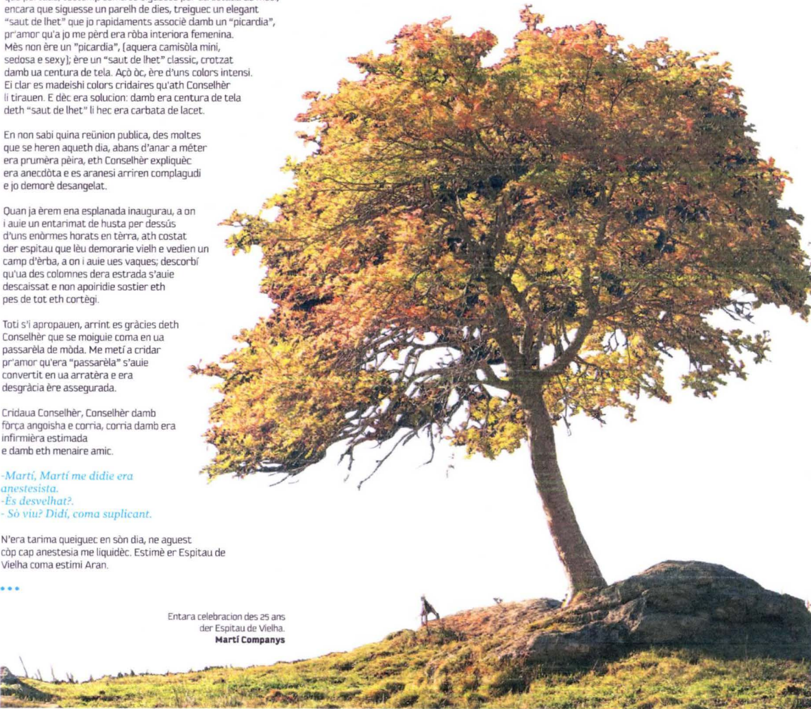
CC. Almazán. Era Artiga de Lin.

Entara celebracion des 25 ans der Espitau de Vielha. Martí Companys