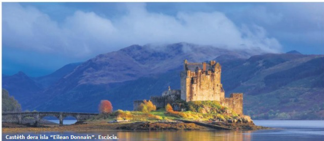
Castèth dera isla “Eilean Donnain”. Escòcia.

Engenhere industriau e licenciat en istòria. Ena Generalitat de Catalunya: Conselhèr d'Innovacion, Universitats e Empreses (2006-2010), Conselhèr de Comèrç, Torisme e Consum (2004-2006). En Parlament de Catalunya: Deputat d'ERC (1995-2004).