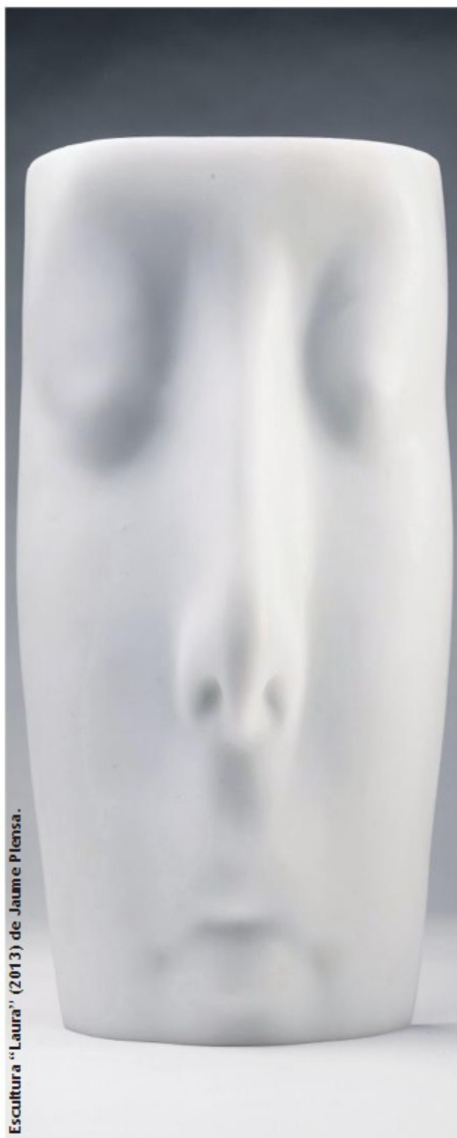
Escultura "Laura" (2013) de Jaume Plensa.