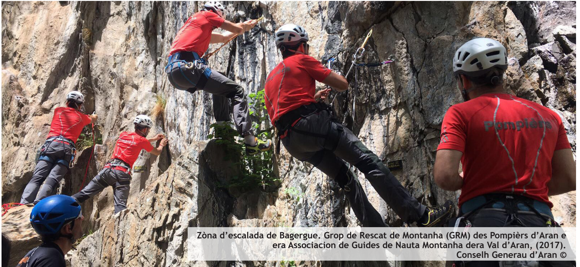
Zòna d'escalada de Bagergue. Grop de Rescat de Montanha (GRM) des Pompiers d'Aran e era Associacion de Guides de Nauta Montanha dera Val d'Aran, (2017).

➔ de professorat, aquerís es competències de besonh entà exercir damb mès garantia era docència.