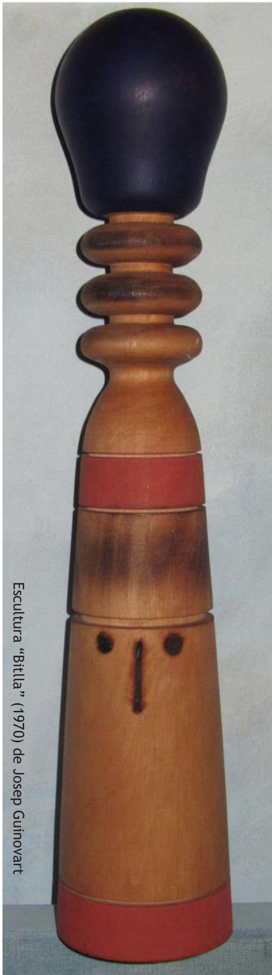
Escultura "Bitlla" (1970) de Josep Guinovart

És ben coneguda la nostra línia editorial però com editors de premsa universitària, dels textos que publiquem, més de 75% nosaltres no els signariem per discrepar-hi. Però això és la democràcia, el debat i la premsa feta per i per a estudiants i professors ha d'enquibir-ho tot. Tothom és benvingut en les nostres publicacions.