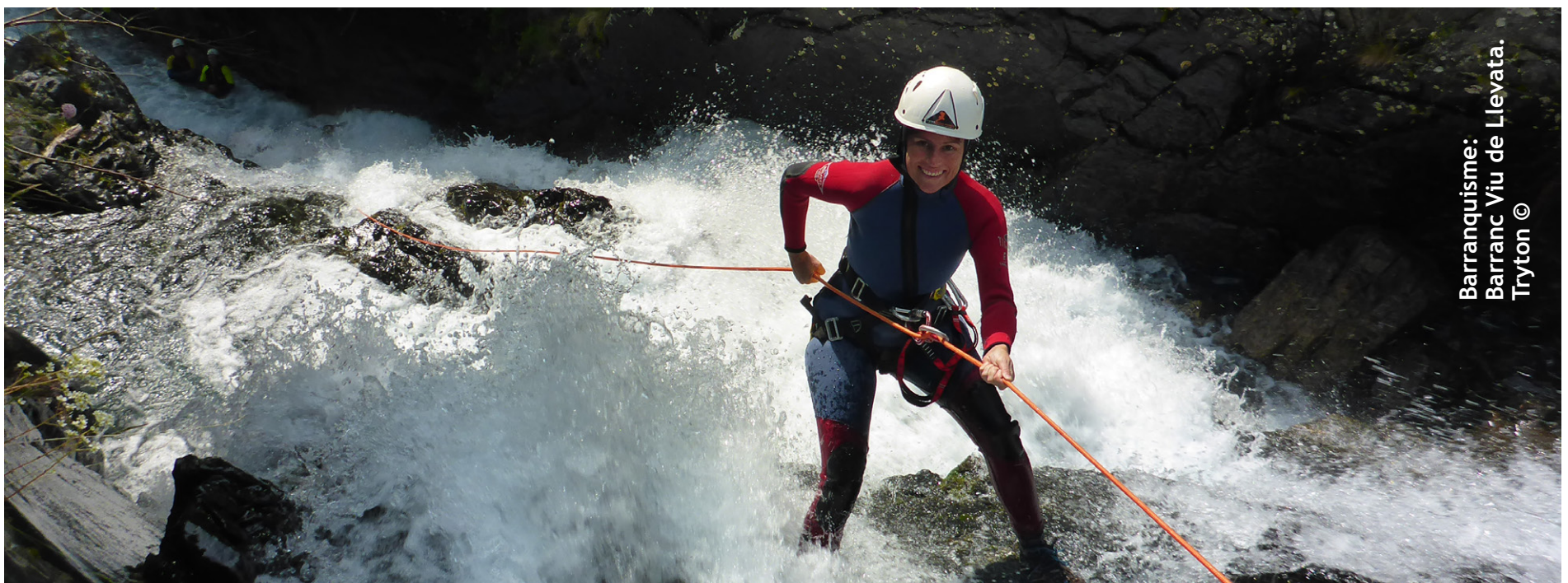
Barranquisme: Barranc Viu de Llevata.

Maugrat tot, pòc a pòc, eth professorat des matèries tècniques, es relacionades dirèctament damb era practica, era demostracion e er ensenhament der esport va canviant, pr'amor qu'incorporam nau docents formats ena naua etapa que damb era exigéncia deth màstèr de formacion