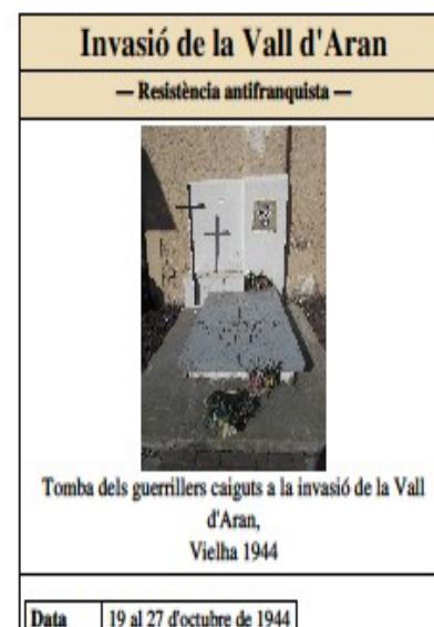
Tomba dels guerrillers caiguts a la invasió de la Vall d'Aran, Vielha 1944