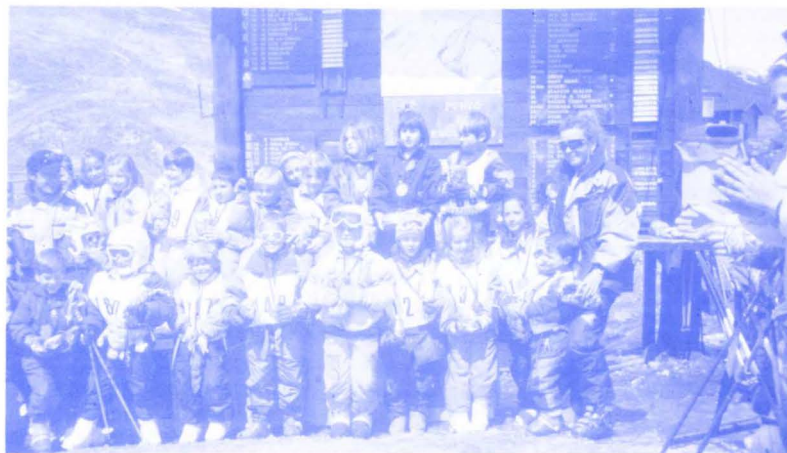
Aquí nuestros pequeños campeones