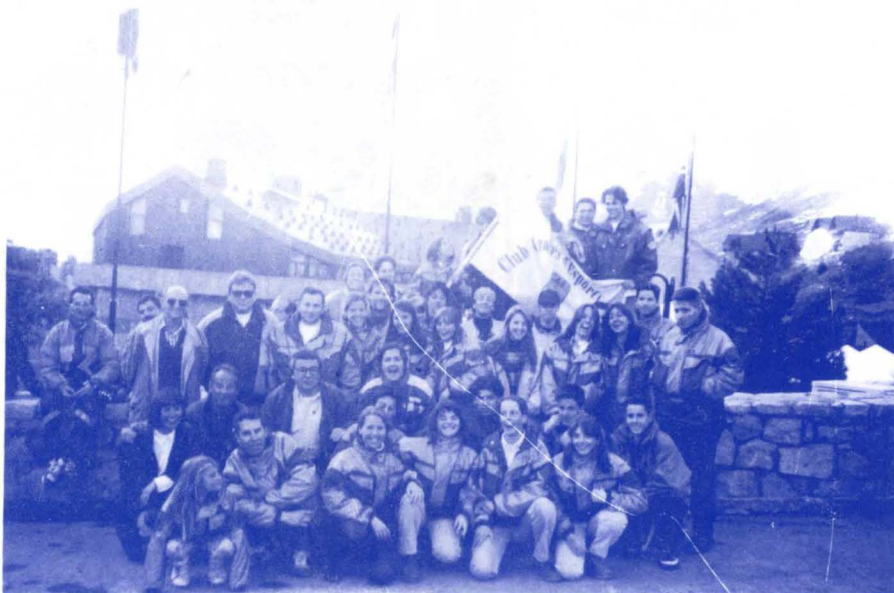
Estos fueron los socios que representaron al C.A.E.I. en el desfile de presentación de "Era Baishada". Esperamos que para la próxima edición seamos más.

Como todos recordareis nuestra carrera social tuvo que ser suspendida por el mal tiempo, pese a que tanto Baqueira como todos los que trabajamos en la organización de esta prueba hicimos lo imposible por esperar a dar por definitiva la anulación de nuestra carrera social, teniéndose que aplazar para quince días más tarde. Lo que no se aplazó y