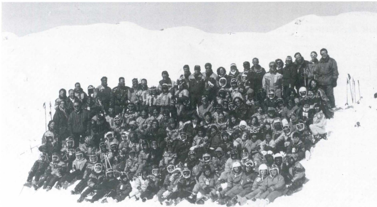
Grupo de entrenamientos 95/96

No falleis, nos veremos el próximo invierno para triplicar los éxitos, entre todos lo conseguiremos!!!.