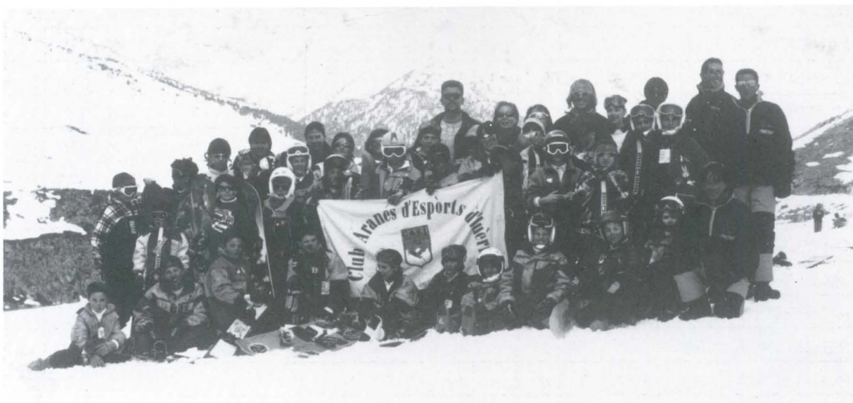
Uno de los grupos de promoción de Snowboard