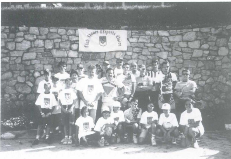
Aguest ei eth grop de gent qu'eren era Baishada des de Baqueira enquia Les.