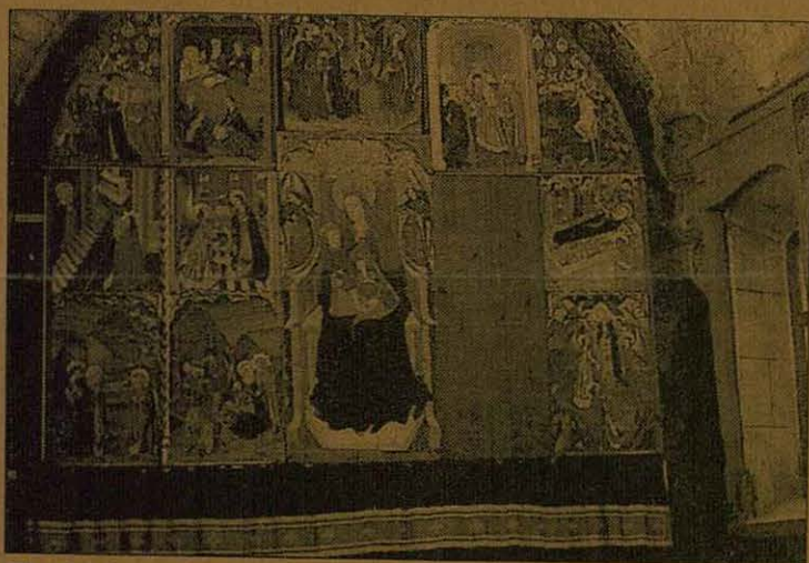
El retaule que va ser col·locat a l'església d'Arties.