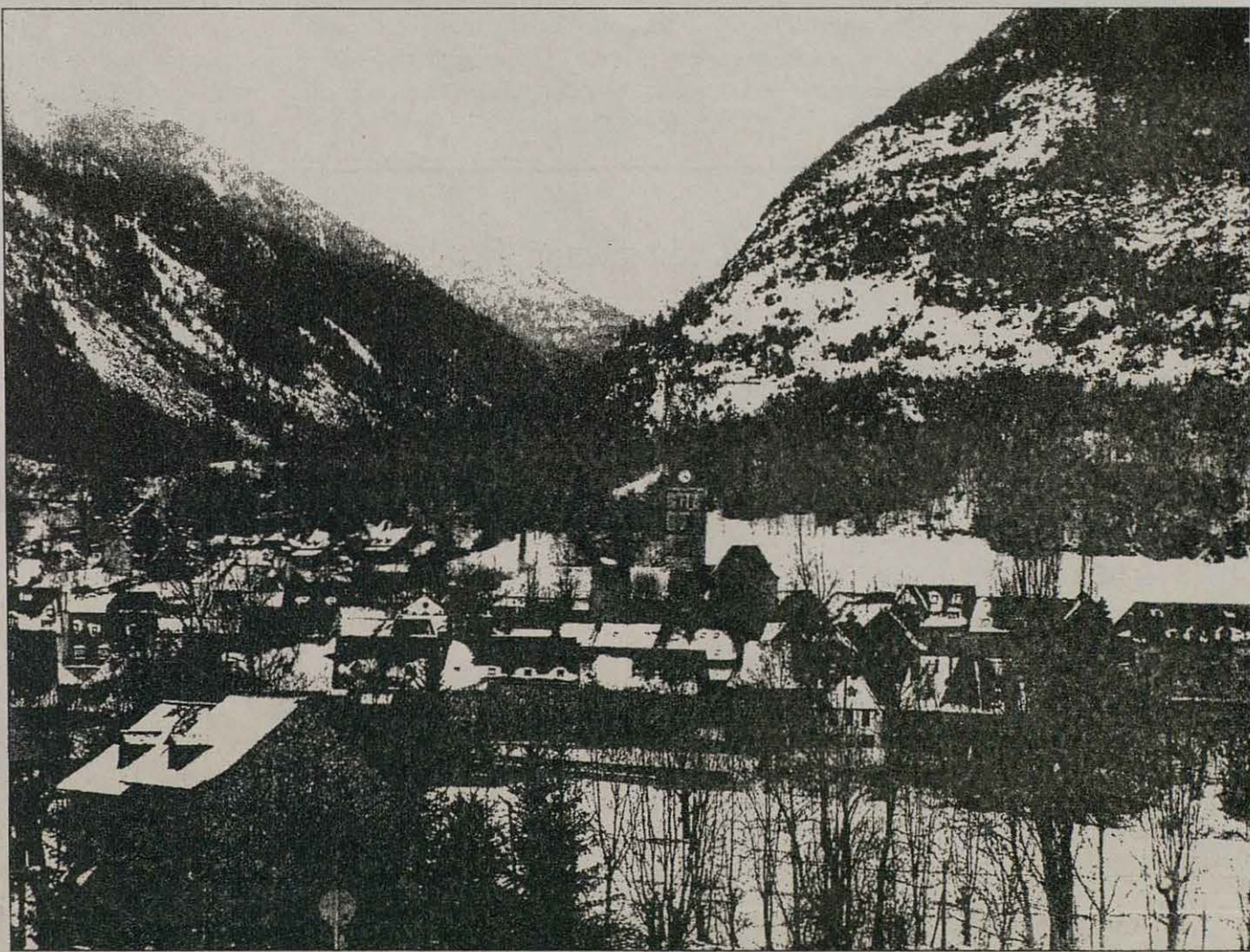
Vista general de Arties, que tiene junto a Garòs una población de unos 600 habitantes