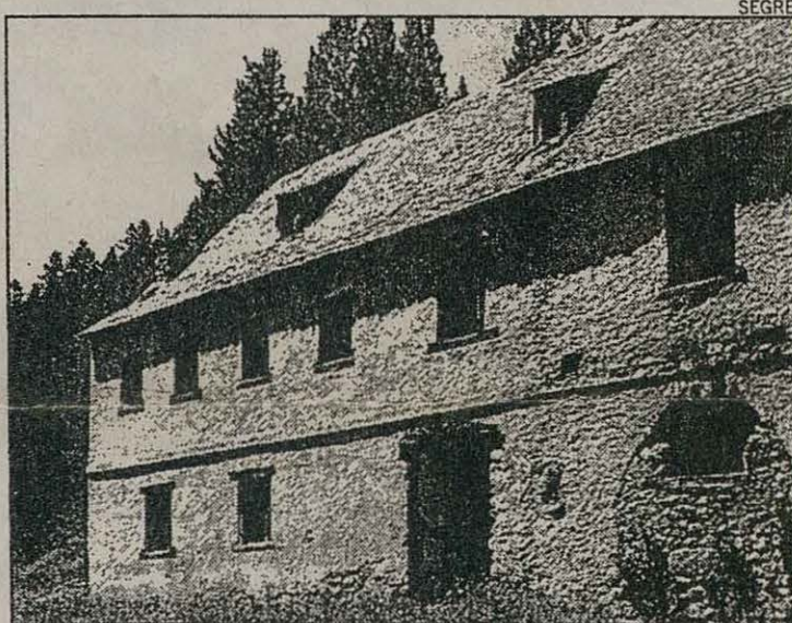
La depuradora està prevista prop dels Bahns d'Arties, a la foto.