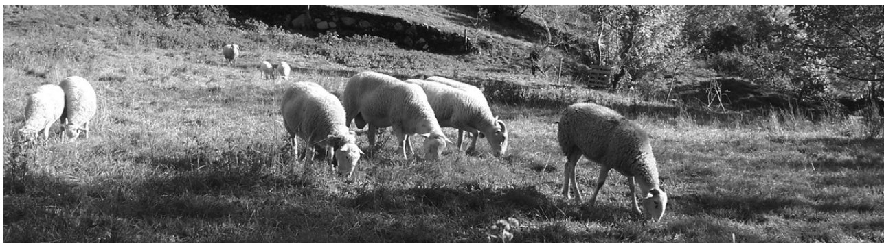
Juanito, el tiene 15 ovejas y 2 corderos de raza aranesa