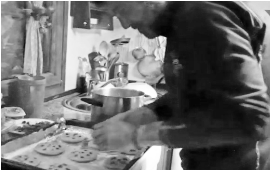
Cocinado galletas (pero muchas)