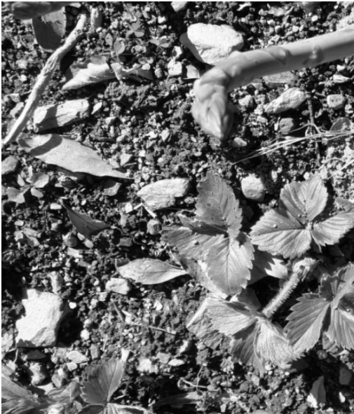
Cuidando el huerto