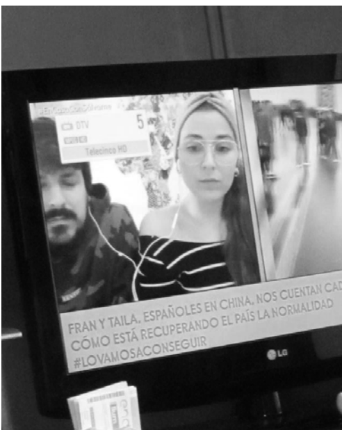
Abusando de la tele