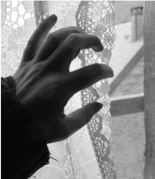
Verificando si hay policia