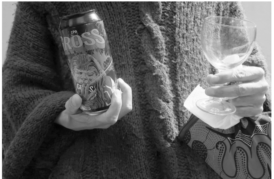
Bebiendo bebiendo cañas