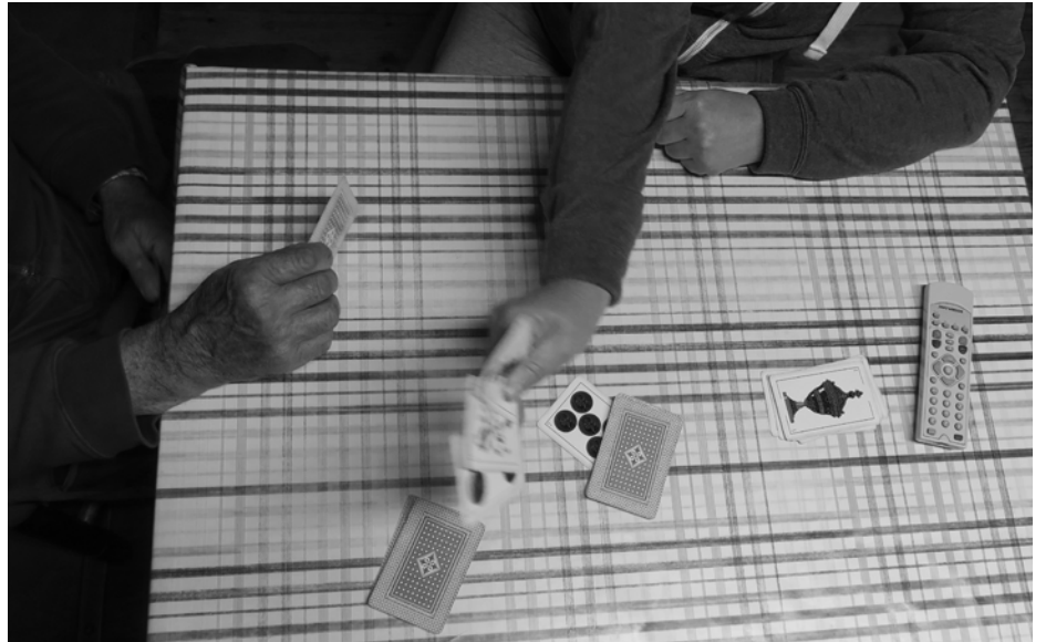
Jugando las cartas