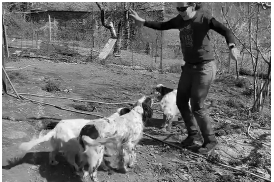
Ballando con perros