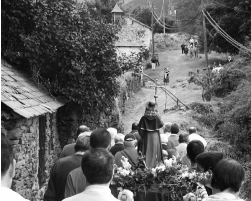
16 de agosto 2008 via crucis la procesion llegando a Coret

Sant Ròc protector deth poble de Bausen protegís-mos deth coronavirus