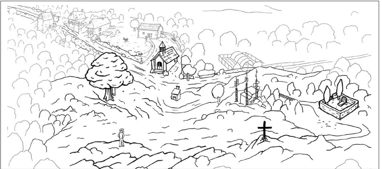
Mapa de Coret, Mathieu