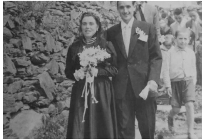
la boda 1955