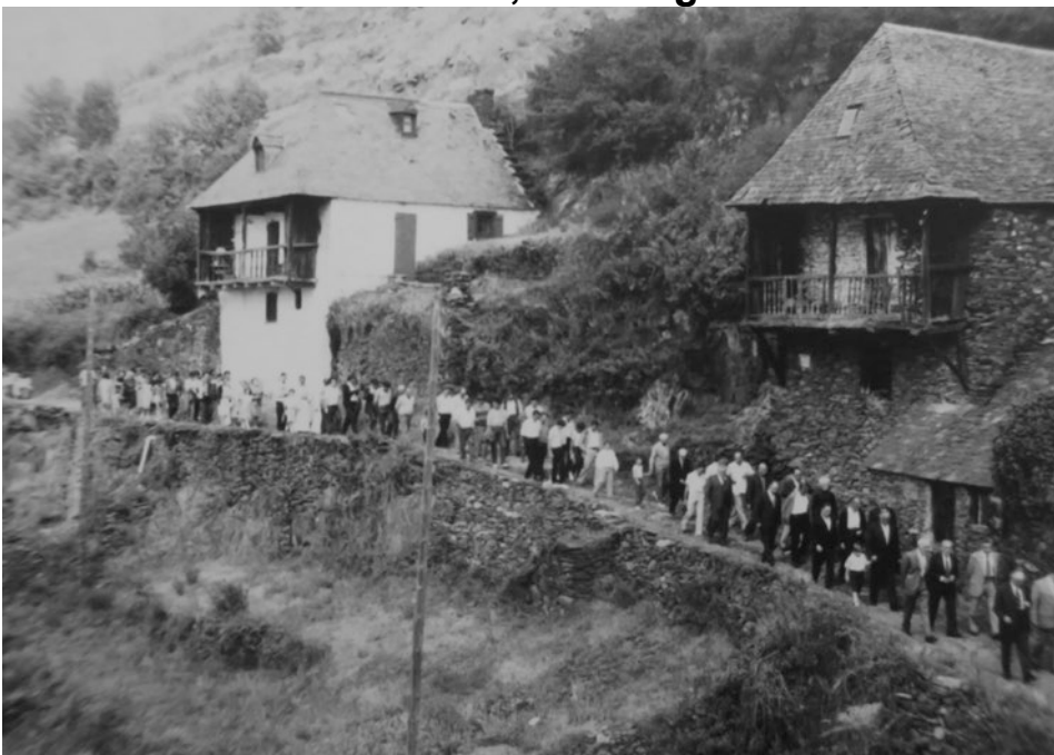
Archivos Caroline - Vía crucis, 1983