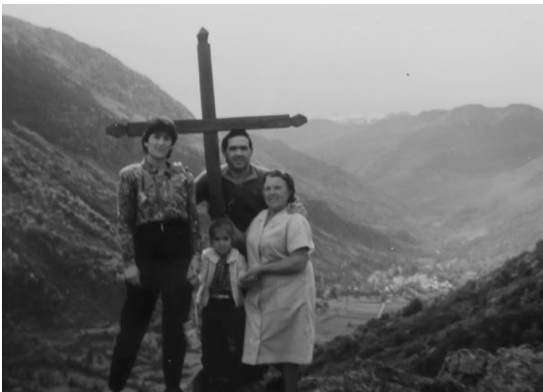
Archivos Tuquera - Panorama

Refiriéndose a nuestro patrimonio material y inmaterial el patrimonio rural son campos, edificios sitios naturales (...) también incluye conocimiento cultural, tradiciones, prácticas, expresiones de las comunidades locales, identidad y pertenencia, valores culturales y sentidos que compartamos tal como nuestra herencia. Universidad Madrid - Patrimonio- gestion y investigacion / Icomos España