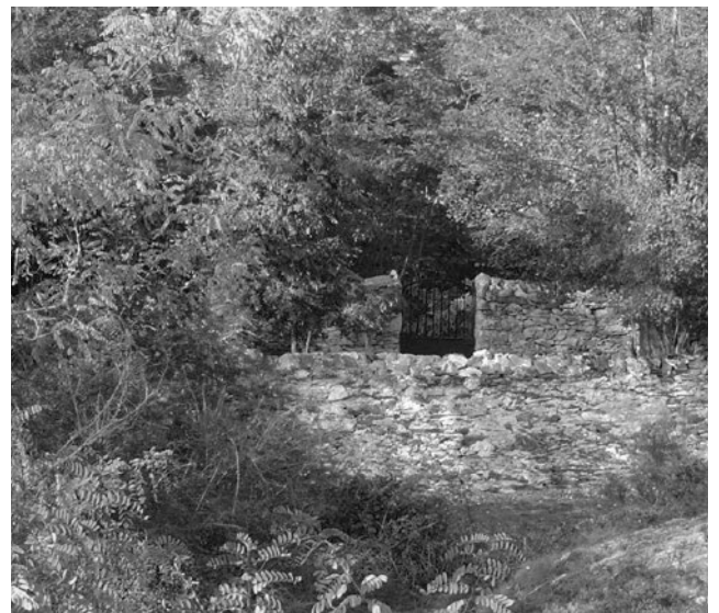
Archivos Dorothée - cementerio civil