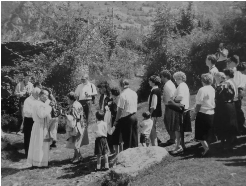
16 de agosto 1992