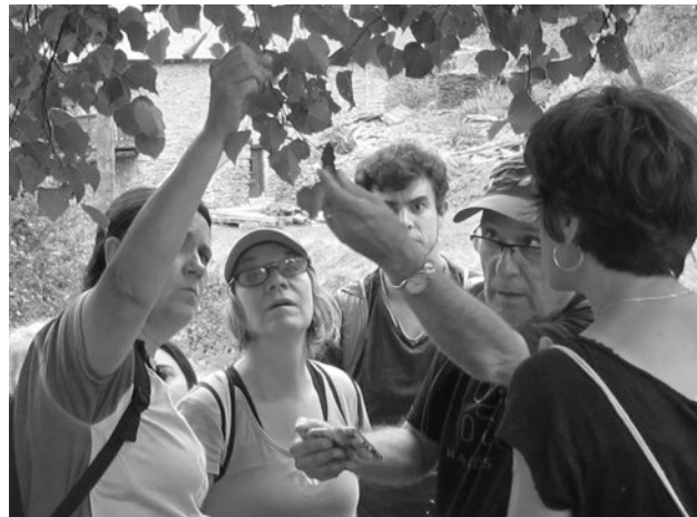
Paseo botánico “ Flora botanica ” en Coret 2019

“ Cuando estoy triste me voy a Coret. Cuando estoy feliz me voy a Coret. Cuando necesito reflexionar o tomar una decisión me voy en Coret. Cuando estoy lejos pienso en Coret, me anima. Me parece que es el lugar mas apreciado por los del pueblo. Si tienes que vivir afuera es Coret que te llevas en el corazón “