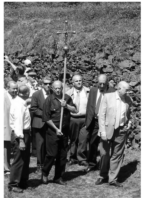
Procesión 200-