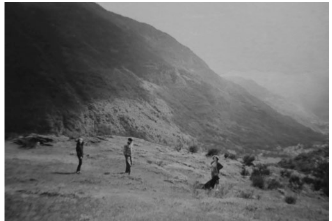
Archivos Bertrand - Coret 199-

“ Eth Haro se ponía en frente de Les así se veía de lejos. Es halhes, se hacían mas abajo donde es más llano. Todos los chicos hacíamos halhes, las chicas mirando y venia un hombre a tocar el acordeón “ Juanito desde Tuquera