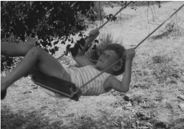
El tilo, Coret 198