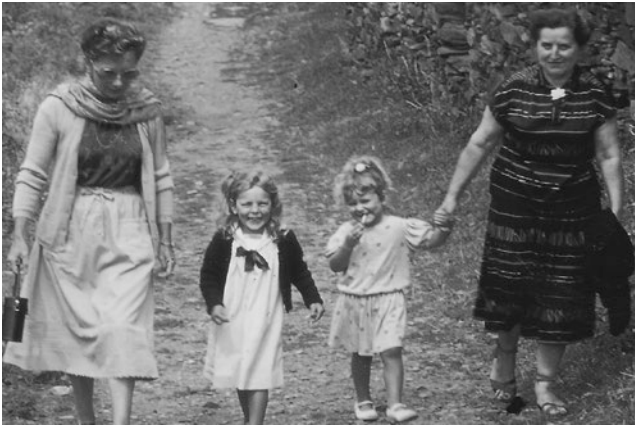
Archivos Marie Hélène, 198-

“ Íbamos a Coret con mi abuela y mis primos, allí bajo el tilo aprendimos a leer y también a identificar las plantas. Nos sentábamos a la sombra del tilo a medio día con los libros para estudiar. De noche volvíamos a Coret con una menta y allí tumbados mirábamos las estrellas hablando del cielo ”