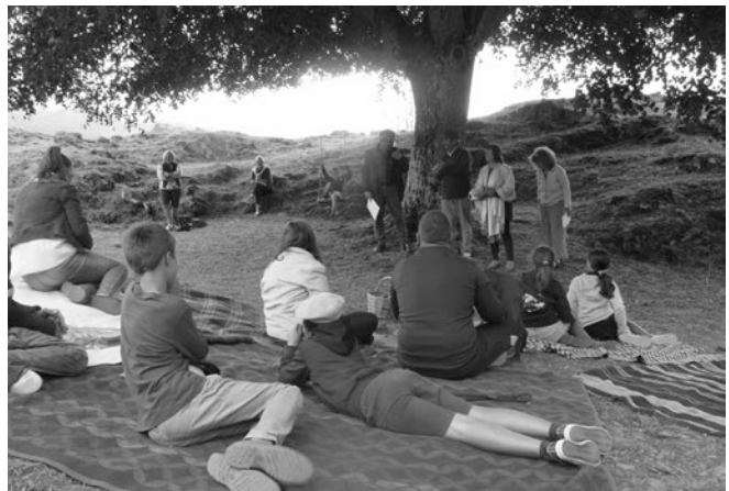
Archivos Caroline - Nocturno de poesia, 2019

“ Eth Haro se ponía en frente de Les así se veía de lejos. Es halhes, se hacían mas abajo donde es más llano. Todos los chicos hacíamos halhes, las chicas mirando y venia un hombre a tocar el acordeón “ Juanito desde Tuquera