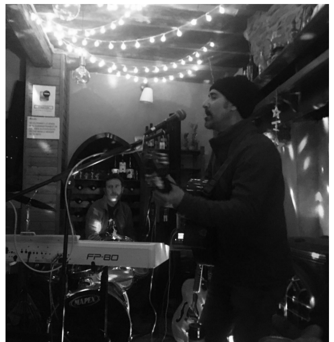
Archivos Vicente - Concierto 2019