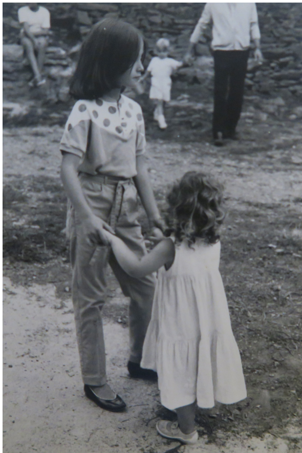
Archivos Caroline - Baile en la plaza 1983