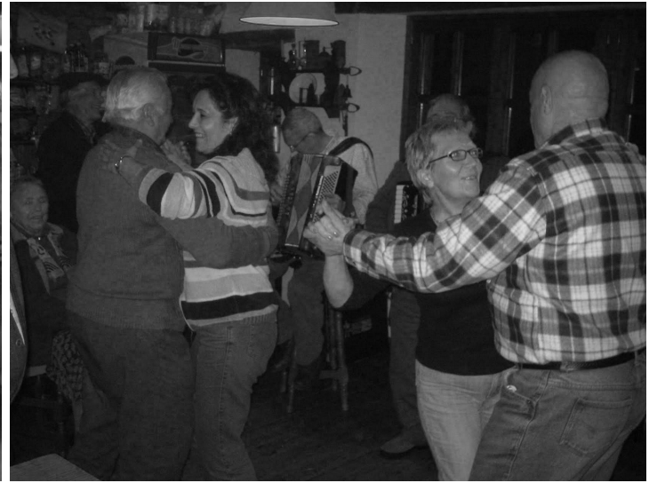
Archivos Ladis - Era Pajareta 2/02/2009 dia de La Candelera dia de pasteres , moscatel y baile