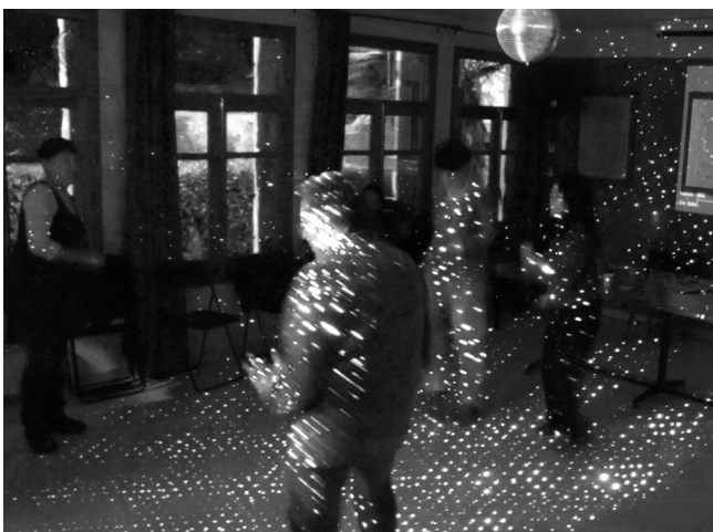
Archivos Caroline - Baile en la Sala Comunal 2011