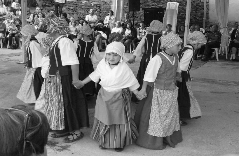
Archivos Bertrand - Baile corbilhuers en la plaza