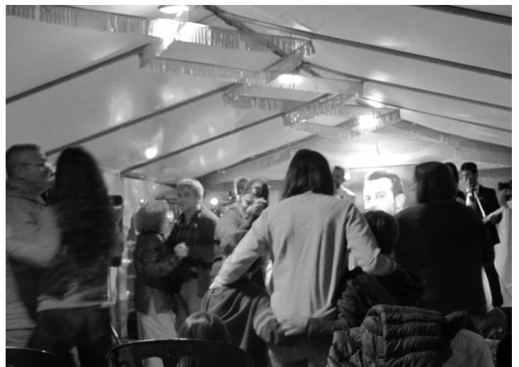
Archivos Caroline - Baile en la plaza 2019