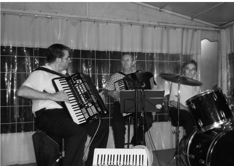
Archivos Bertrand - Baile en la plaza 20- -