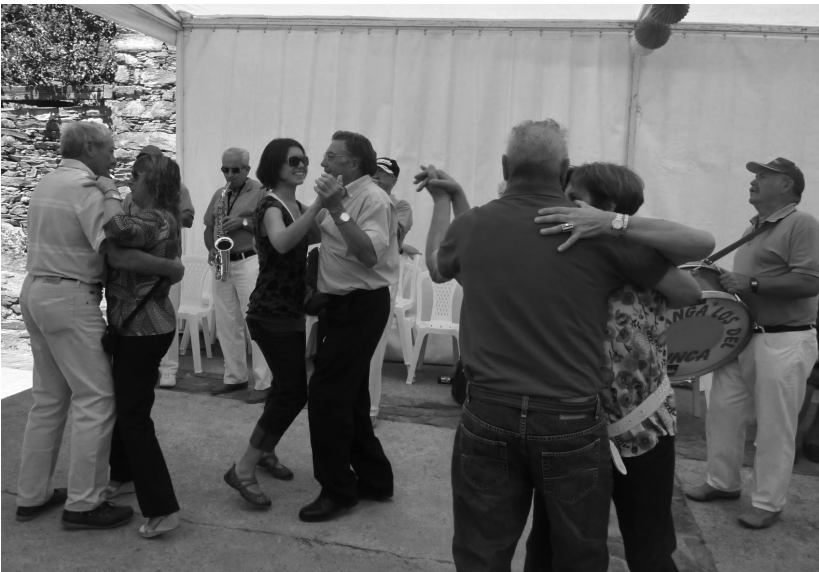
Archivos Bertrand - Baile en la plaza 2011