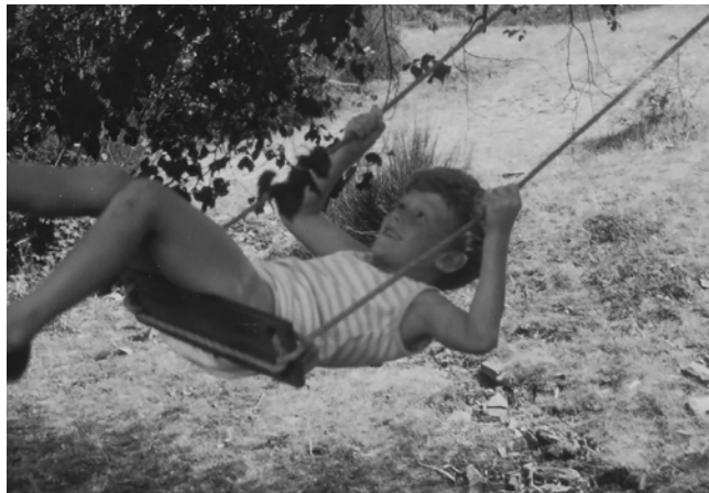
Archivos Caroline - el Tilo, Coret 198-