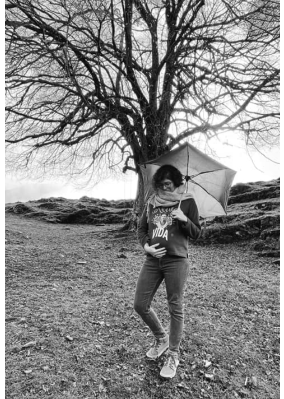
Archivos Albert - Mar (Lua) con el Tilo