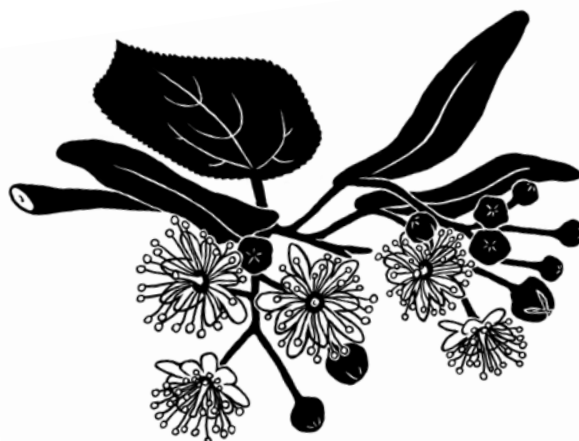
flores de tilo - Mathieu