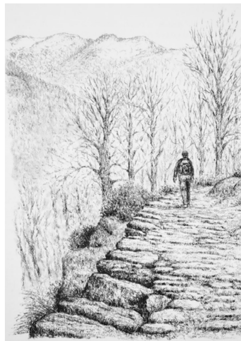
© Ricard Novell iglesia Sant Pèir y costa de Bausen - Saut deth Sargent

Un pueblo al que se conoce a sus habitantes con el nombre de “es cernalhèrs” y como no podía ser menos, una leyenda nos cuenta el porqué: