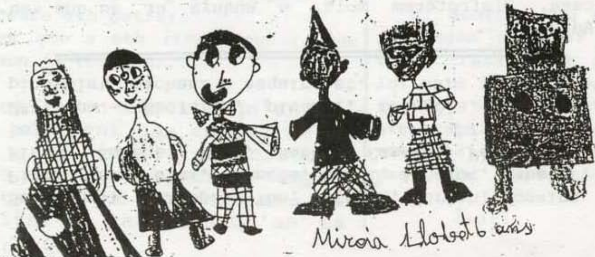
Mireia Lobet 6 anys