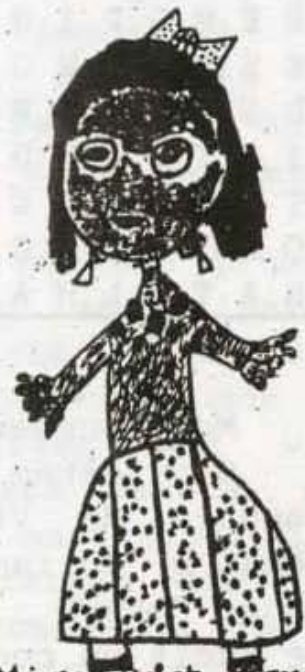
Mireia Lobet 6 anys