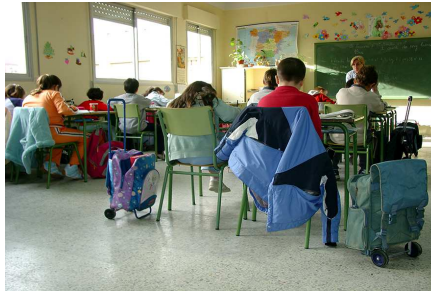
La imatge de la felicitat

On the other hand, we denounce with righteous indignation and dislike men who are so beguiled and demoralized by the charms of pleasure of the moment, so blinded by desire, that they cannot foresee the pain and trouble that are bound to ensue; and equal blame belongs to those who fail in their duty through weakness of will, which is the same as saying through shrinking from toil and pain. These cases are perfectly simple and easy to distinguish. In a free hour, when our power of choice is untrammelled and when nothing prevents our being able to do what we like best, every pleasure is to be welcomed and every pain avoided. But in certain circumstances and owing to the claims of duty or the obligations of business it will frequently occur that pleas-