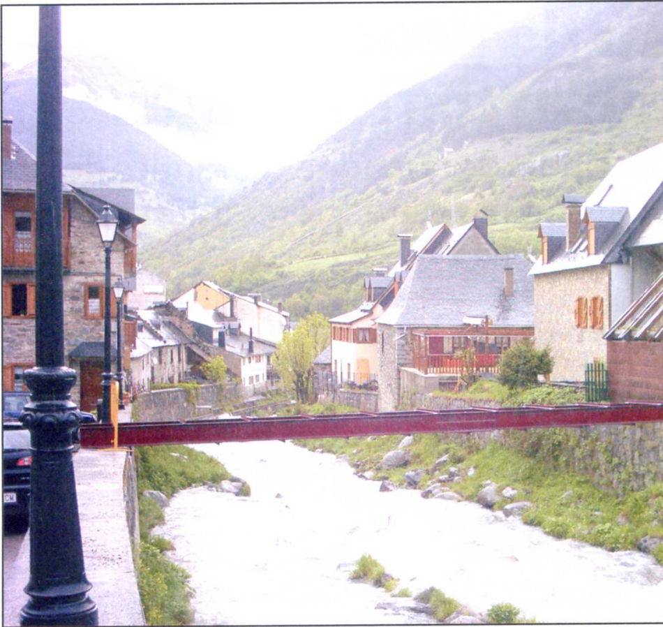
El casco antiguo de la capital aranesa / G. A.