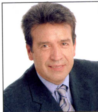
El secretari general d'UA

De fet, la Direcció General d'Arquitectura i Paisatge, que depèn de la conselleria de Política Territorial i Obres Públiques, aplica un programa que preveu la realització de la reproducció de l'esmentat altar, així com quatre actuacions