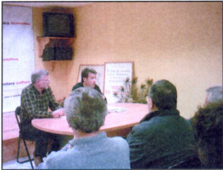
Assemblada de militants d'Unitat d'Aran eth passat dia 6 de mai ena sedença deth partit.