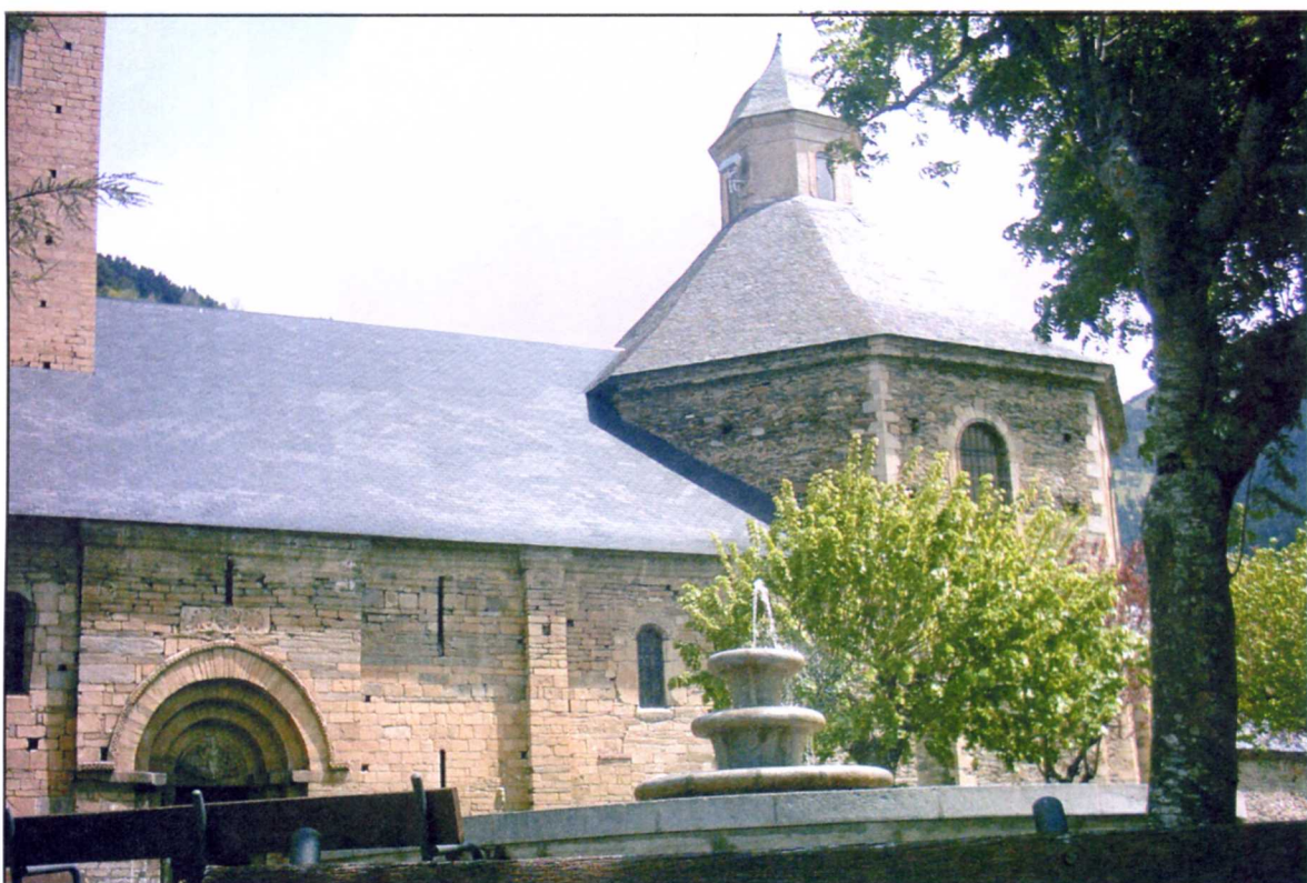
Era glèisa de Vilac / G. A.

aubiatge aranés, de gran valor e dimension. Ne tansevolhe ara glèisa dera Purificacion de Bossòst li an balhat eth reconeishement que se merite coma ua des melhors mòstres deth romanic aranés. v.