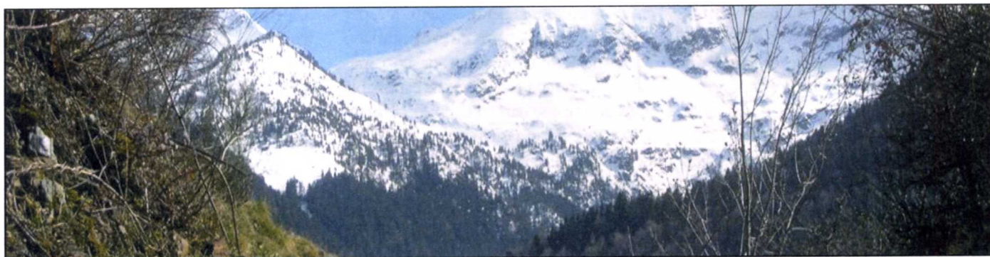
Els valors del paisatge formen part d'un nou concepte de turisme.

L'objectiu és garantir un turisme de qualitat. Hem d'afrontar aquest debat per garantir la creació de riquesa i molt especialment la creació d'oportunitats per als joves que vulguin continuar vivint a la muntanya.