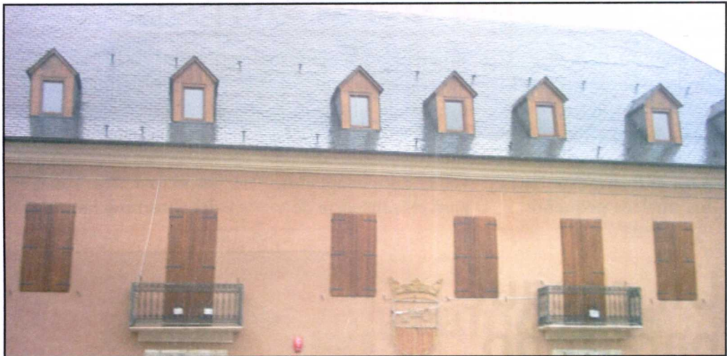
Sedença deth Conselh Generau d'Aran.

Era apòsta d'UA pera bona governança d'Aran passe per «dignificar era figura deth Síndic/a coma maximom representant d'Aran damb un lideratge fòrt peth dessus dera luta partidista diària». Ua des propòstes mès remarcables deth document Nau i tempsi, nau govèrn ei era de «redactar un còdi etic aplicable as persones qu'assomissen responsabilitats de govèrn entà evitar cassi de conflicte d'interèssi» e crear «un registre public sus eth patrimoni des cargues».