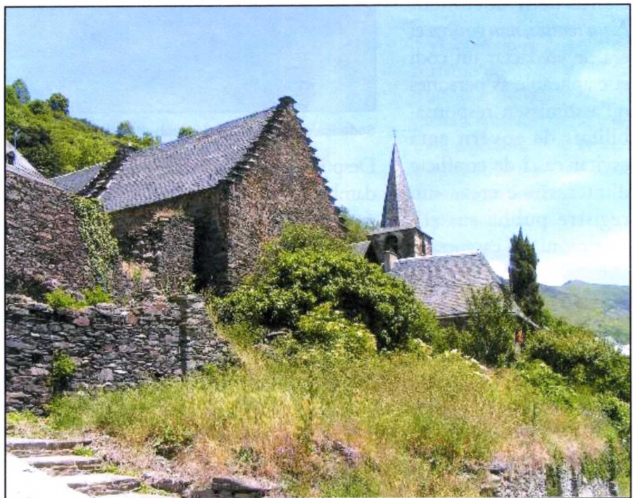
Vista de Bausen (Quate Lòcs), núcleo pequeño que necesita transporte público.