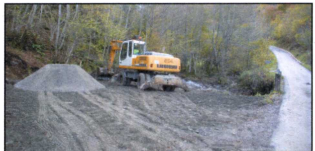
Las obras en la carretera de Toran.

El Ayuntamiento de Canejan está invirtiendo 50.000 euros en la construcción de dos