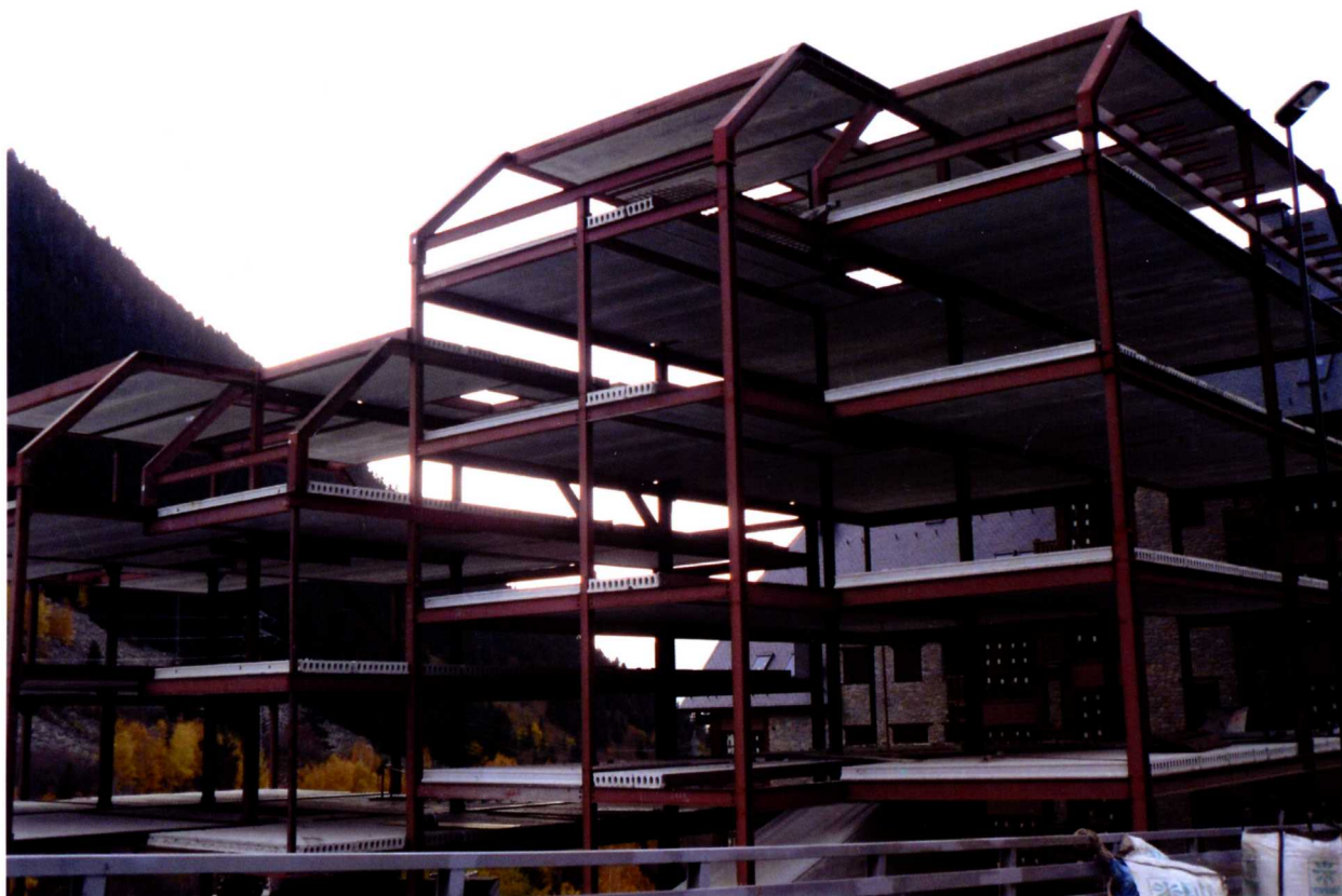
■ Estado actual de la urbanización del Valle de Ruda, con algunas obras paralizadas.