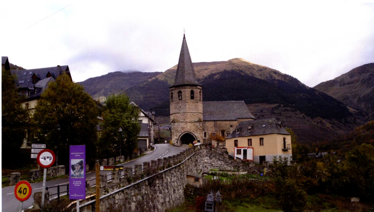
■ El Plan director urbanístico apuesta por respetar la imagen tan característica de los pueblos de Aran

perquè caracteritzen especialment la imatge dels pobles de l'Aran.