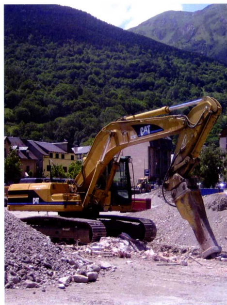
■ Obras de construcción del aparcamiento.

El también secretario de Acción Municipal de UA ha seguido apostando por "consolidar el uso de parking" en el centro de Vielha y ha asegurado que deben evitarse malos ejemplos como el proceso que dio lugar a la construcción de una macrourbanización en el Valle de Ruda, donde no se han visto recompensados en justicia los intereses municipales, agravados por una situación de inseguridad jurídica después de una sentencia adversa del Tribunal Superior de Justicia de Cataluña, que ha anulado la licencia urbanística al no ajustarse a la normativa vigente. | vediau