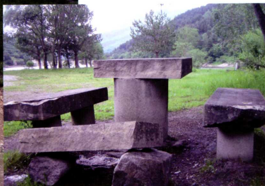
■ Moviment de terra a Aiguamòig, on es volia construir un camp de tir sense permisos i ara es vol construir una àrea de pícnic. L'àrea ja existeix, sense condicionar, a la mateixa zona.