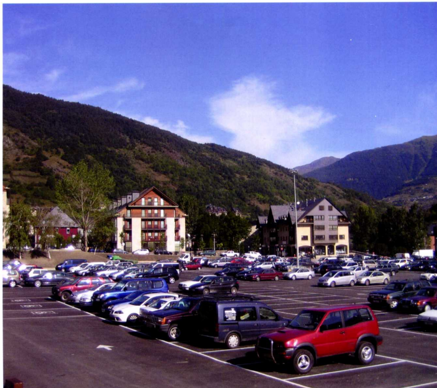
■ Parking de Vielha.

El grupo municipal de Unitat d'Aran entiende que con la subasta se "abre la veda" para que se apliquen los derechos de urbanización que establece el plan parcial para zona verde, equipamientos y usos residenciales, pero, en ningún caso, para aparcamiento público.