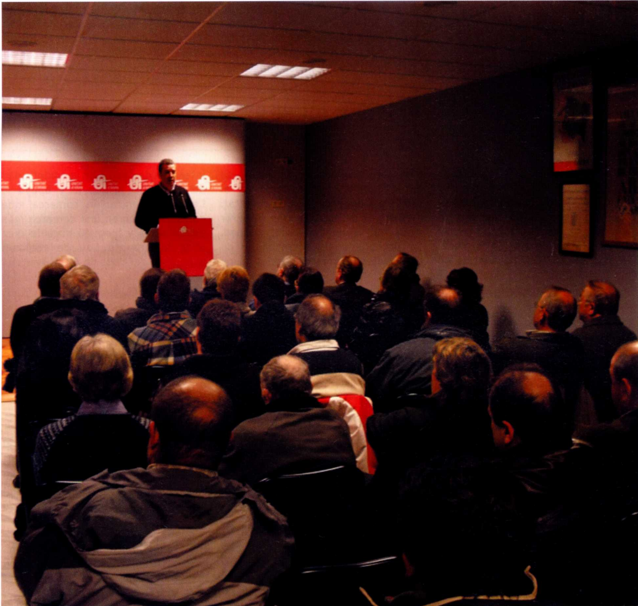
■ Assemblada de militants d'UA.