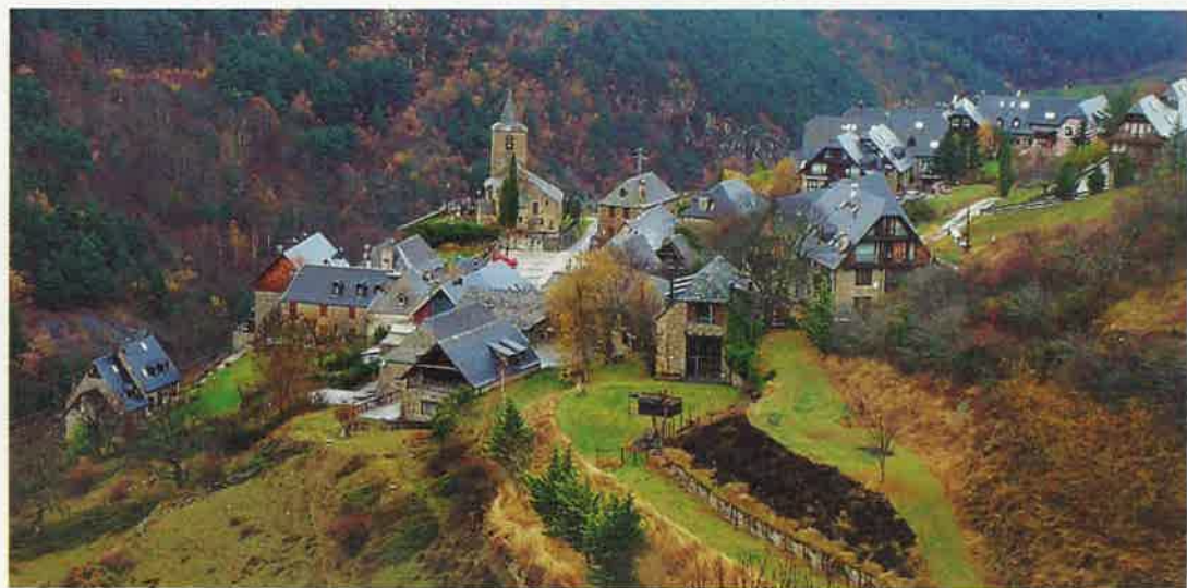
Las EMDs, una de las prioridades para el gobierno municipal

Según el alcalde de Vielha e Mijaran, Juan Antonio Serrano, "los pueblos de nuestro municipio son una de las prioridades del gobierno municipal" y añadió que "este año podemos destinar un poco más de recursos a las EMD para que les gestionen e inviertan en aquello que consideren necesario".