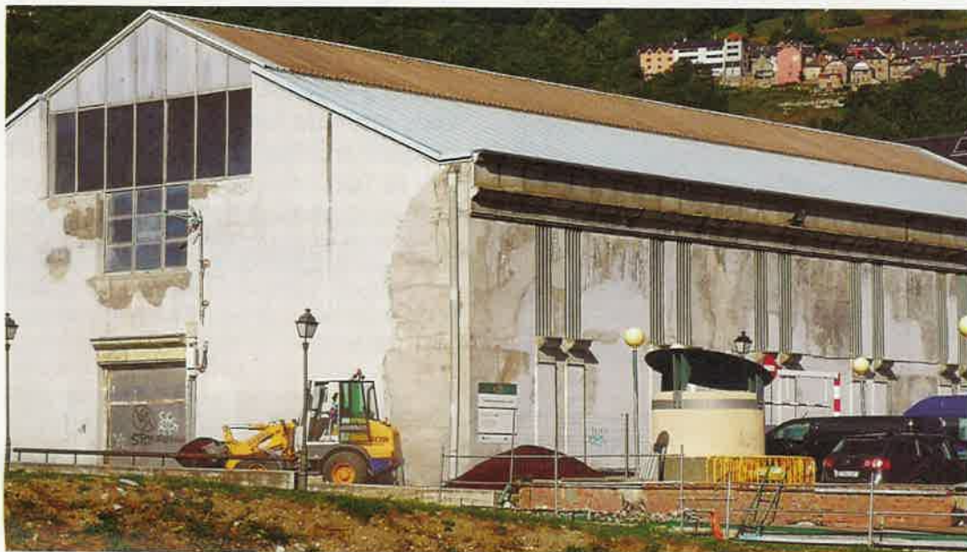
Entre altres millores s'arreglarà el sostre, la il·luminació interior i la façana

Els treballs de millora d'aquest emblemàtic equipament municipal, després de molts anys sense que s'hagin realitzat unes necessàries obres de condicionament, es realitzaran en diverses fases; la primera s'iniciarà aquest l'hivern amb la reparació del sostre, la il·luminació interior i la façana exterior.