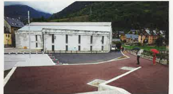
La remodelación de este espacio ha sido integral consiguiendo un espacio funcional, seguro y atractivo

Mejorar la seguridad de las personas y los bienes ha sido una de las prioridades en las obras de remodelación de la Plaza de la Generalitat. Una de las actuaciones más destacables ha sido el arreglo del muro de la plaza donde se juntan los ríos Garona y Nere, para evitar que el agua penetre en el aparcamiento. Se ha levantado el muro a la altura de la plaza y se han instalado vallas metálicas para mejorar la seguridad de la plaza en el aparcamiento y la estética de la misma; también se ha substituido la iluminación de la plaza por otro sistema de alumbrado más sostenible y eficiente.