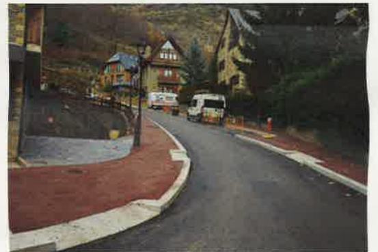
La mejora del suministro de agua y las aceras objeto de la mejora en la calle Montcorbison