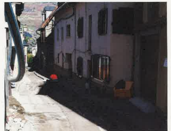
En la calle Bergàs se ha mejorado el alcantarillado y el servicio de agua potable