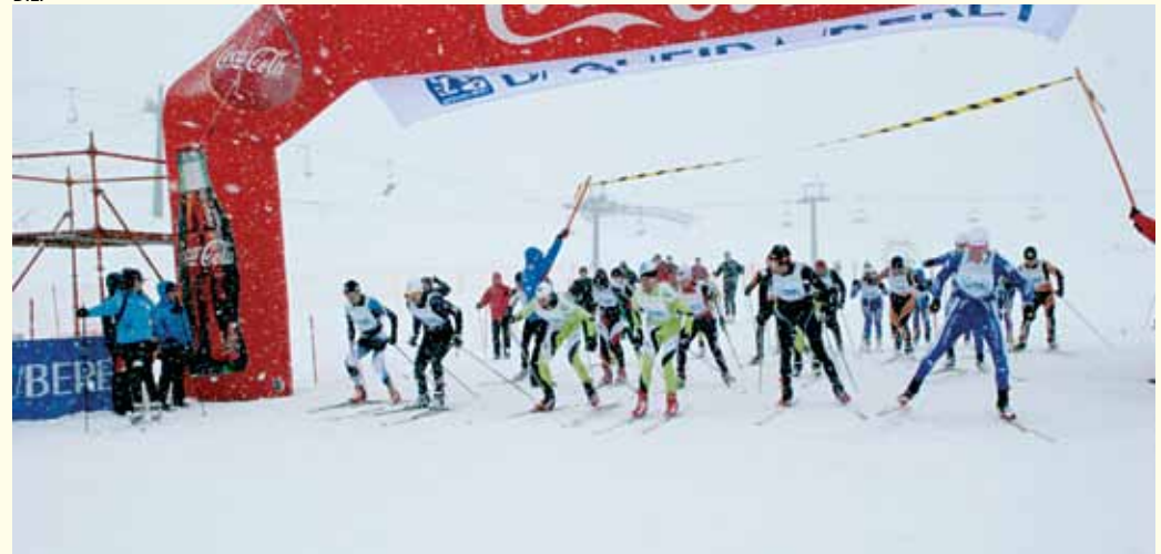
Los participantes pudieron disfrutar de un paisaje espléndido durante toda la prueba