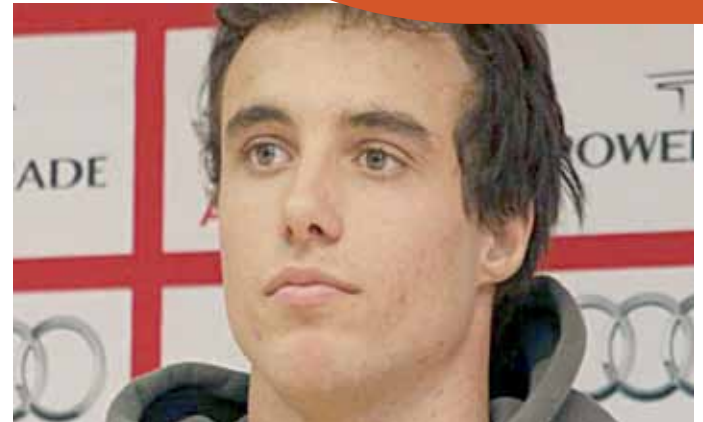
El esquiador español "afronta este reto con ilusión y ganas de competir"