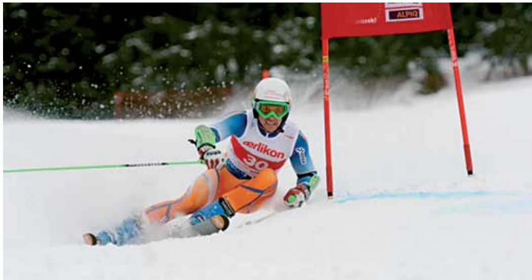
Puente se crió en la Val d'Aran pero reside actualmente en Suiza