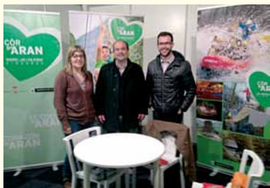
El evento tuvo lugar en las instalaciones de Fira de Lleida