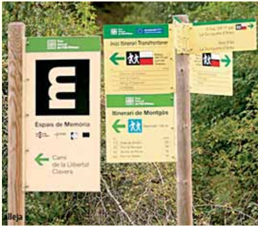
Consta de la señalización de diversas rutas