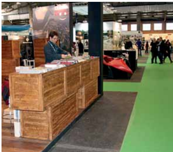
La iniciativa se presentó en el Saló de l'Esport de Lleida

tado su primer producto turístico destinado al deporte en el Prepirineo y el Pirineo de Lleida. Se trata del proyecto Bike & Run,