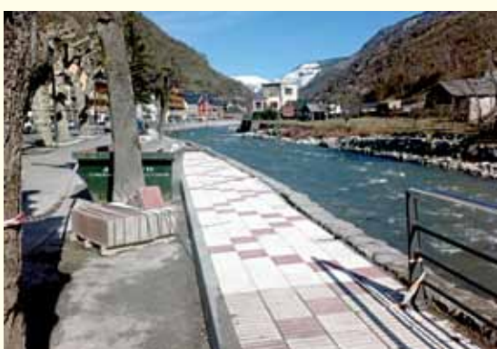
Las obras han comenzado en el paseo Eth Grauèr