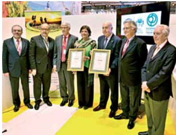
El acto de entrega de la certificación tuvo lugar en FITUR.