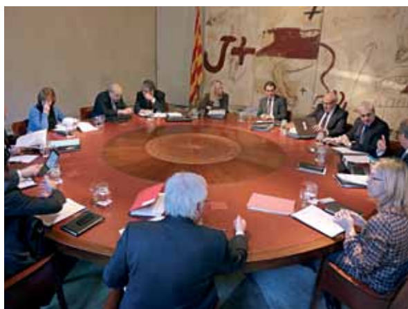
La Generalitat ha dado luz verde al proyecto de lengua.