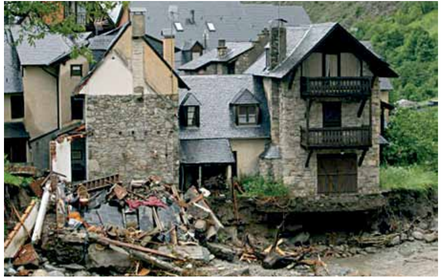
La fuerza del agua destruyó varias viviendas y diversos tramos de carretera de la zona.

Entonces instaló doce grupos electrógenos para garantizar el suministro y a través del ejército se pidió a la Unidad Militar de Emergencias que helicópteros de gran capacidad de carga (un Cougar y un Chinook) transportaran los grupos electrógenos más pesados a puntos donde no se podía acceder de otra manera. De esta manera, se llegó a movilizar un centenar de técnicos y operarios en los trabajos de reposición del suministro y reparación o reconstrucción de infraestructuras eléctricas.