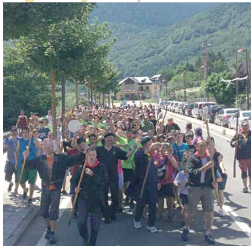
Recorrido de los peñistas por las calles de Bossòst.