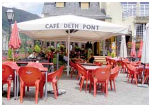
Café Deth Pont

Es tiempo de refresco. Los más famosos son las colas, pero las cervezas vienen imparables. Hay una variedad increíble.