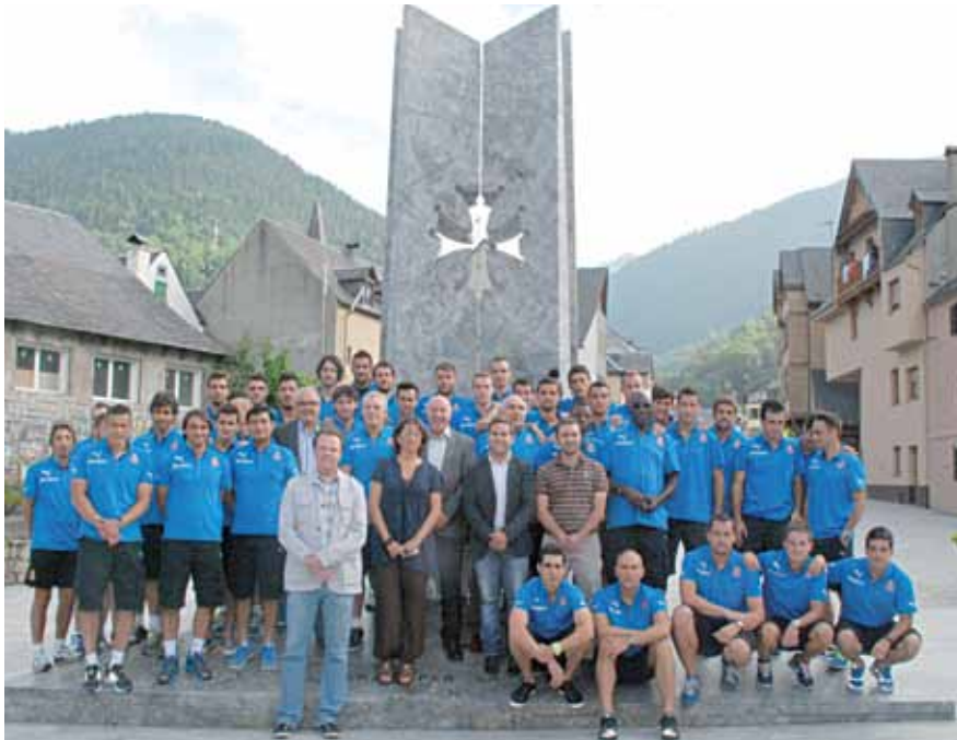
Esta escultura es un regalo del Ayuntamiento de Saint Bèat a los vecinos de Benasque.