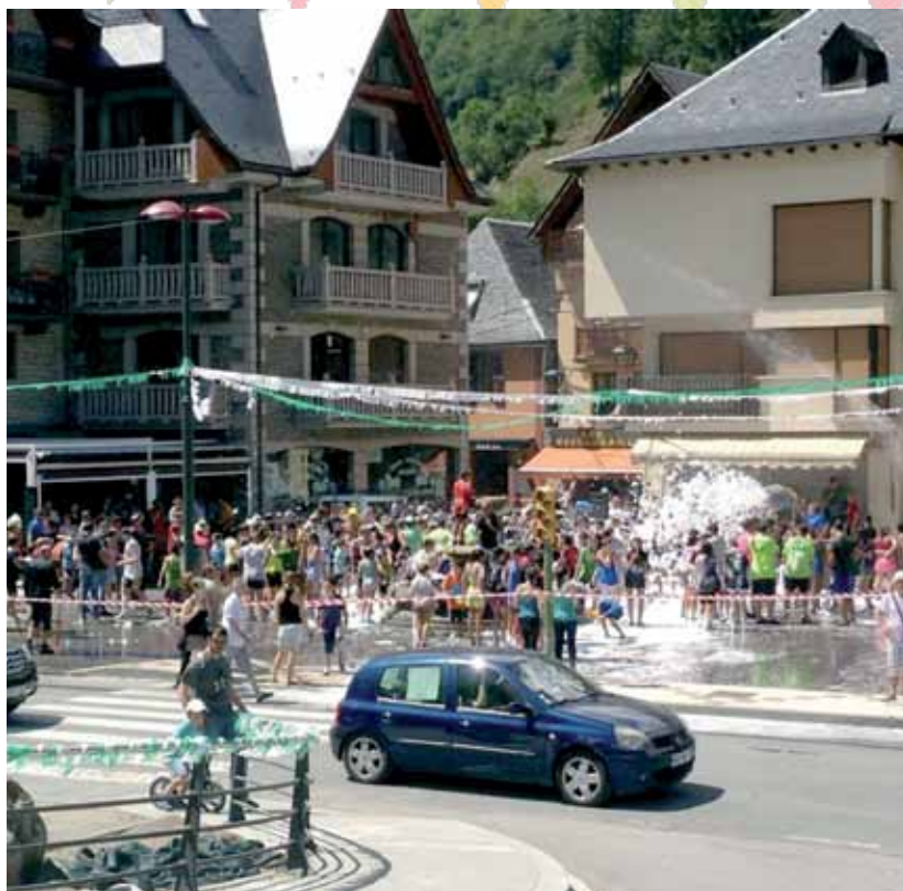
Fiesta de la espuma.