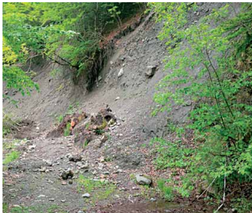
El camino de Margalida, en Bossòst, presenta un estado de degradación evidente.