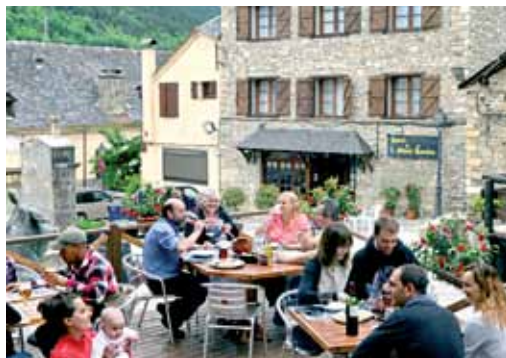
Bar Vinoteca Gris Hotel Montromies

“Especialistas en paellas caseras. Ven, y no dejes de degustar nuestras deliciosas tapas”.