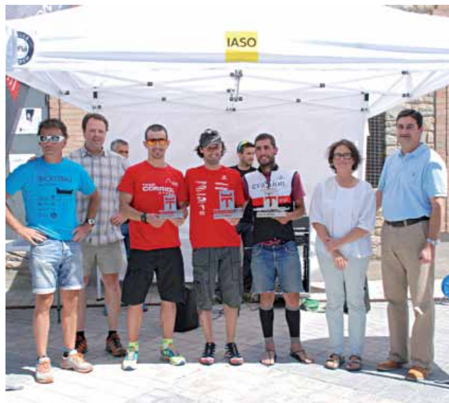
Los ganadores de la segunda edición de esta prueba de la Val d'Aran.

en verano podemos decir que la Val d'Aran cuenta con dos citas deportivas importantes anuales: la