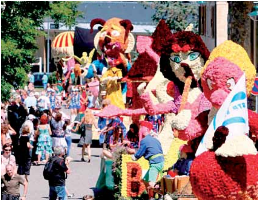
La ciudad se llena de carrozas de flores que engalan esta tradicional fiesta.