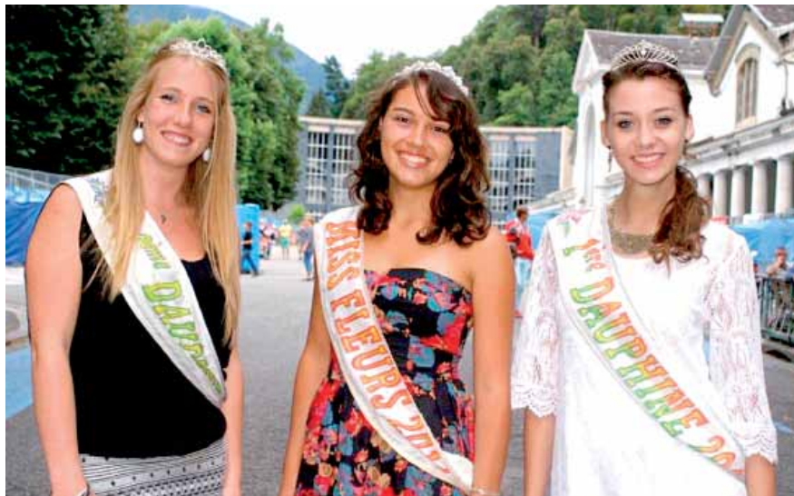
Las 'reinas' elegidas este 2014 para representar la fiesta.