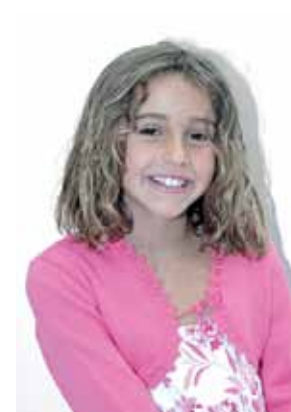
BETH SANJUAN BOTANCH DAUNA INFANTILLA