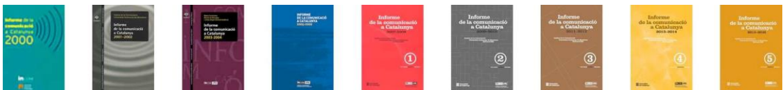
Portades de les nou edicions de l'Informe publicades entre els anys 2000 i 2017

L'objectiu principal de l'Informe és oferir una visió global i sintètica del camp de la comunicació durant el període estudiat, destacant-ne els aspectes i tendències més rellevants, amb anàlisis comparatius per biennis, amb precisió i fonamentació, gràcies a la continuïtat i la tasca de recerca permanent de l'equip humà de l'Informe.