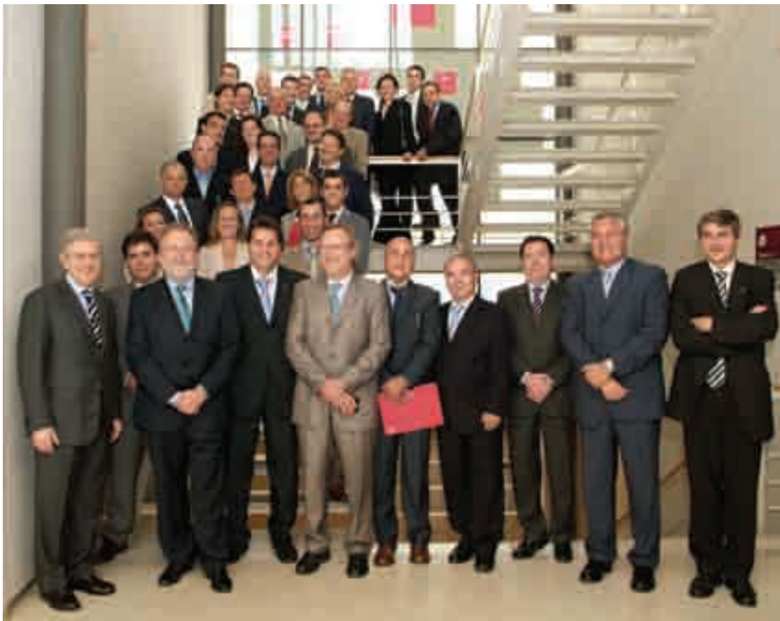
Representants del Ple de la Cambra de Comerç i Indústria de Terrassa