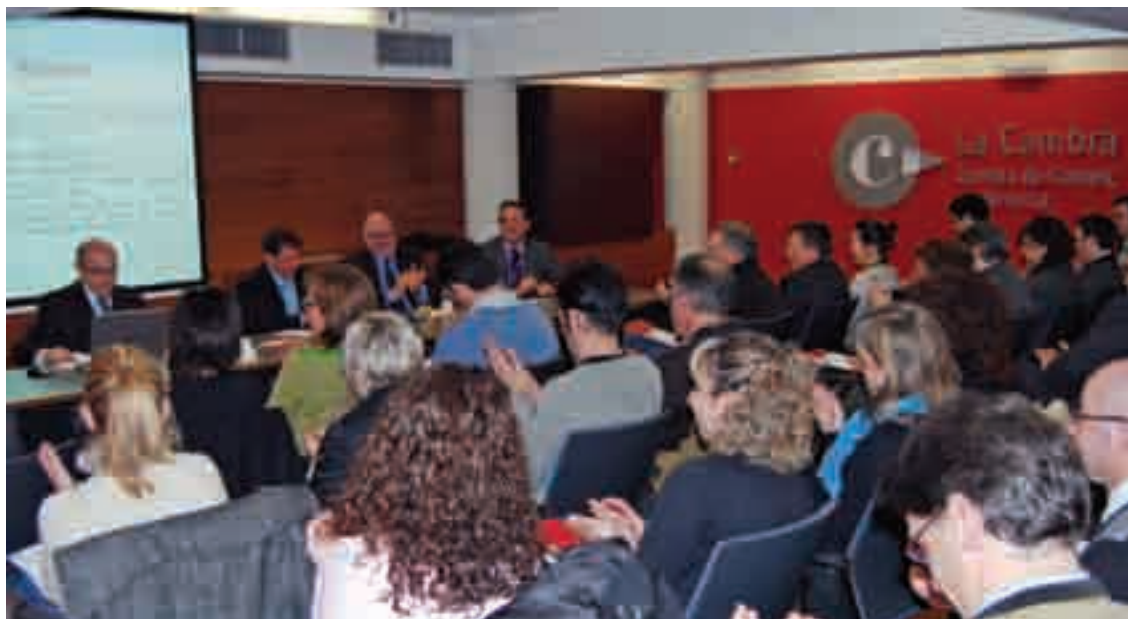
› Instantània de la sessió informativa "Com gestionar un comerç de temps de crisi"

A la sessió hi van assistir 25 persones.