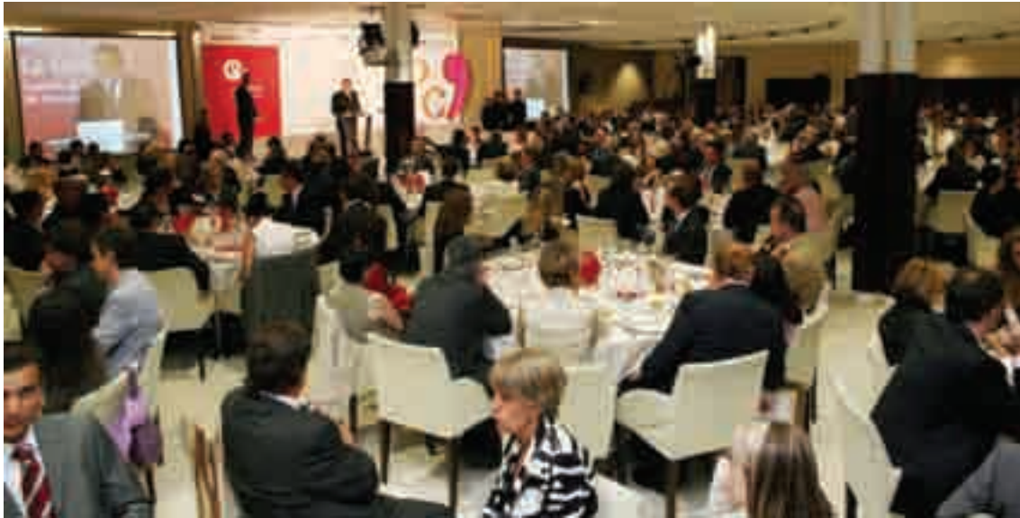
» Més de 470 empresaris van assistir a la celebració dels Premis Cambra 2009