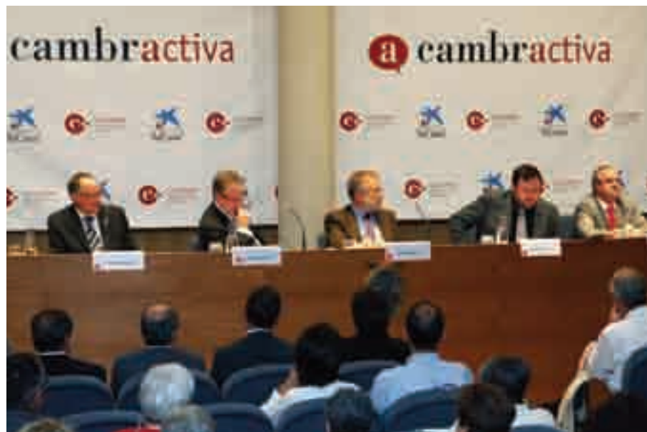
» La sessió Cambractiva "L'educació i la gestió del talent per a la societat del futur"

Aquesta sessió Cambractiva va comptar amb la participació d'un centenar d'empresaris i professionals de l'educació, que van valorar el debat amb una mitjana de 8.37 punts.