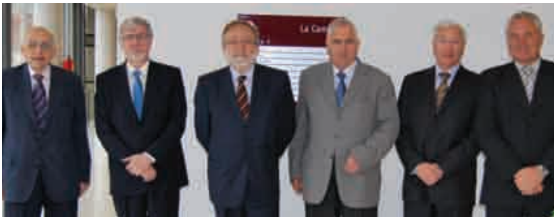
Els presidents d'institucions de Terrassa que van participar en la trobada

Els sis presidents van tractar aspectes com la situació econòmica actual, sobre la qual es van manifestar en favor de promoure una entesa entre totes les forces polítiques i els agents econòmics, empresarials i socials per consensuar mesures efectives per dinamitzar l'economia. Així mateix, van demanar la prolongació de l'actual tram en construcció del Quart Cinturó per tal que sigui una via ràpida i de suficient capacitat per al transport de persones i de mercaderies.