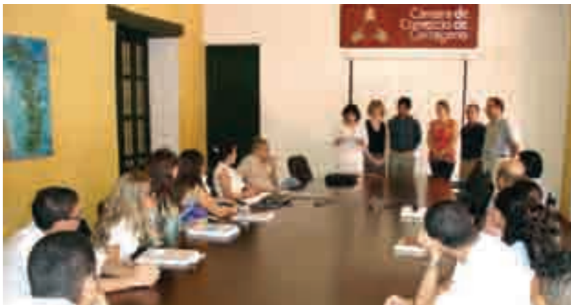
» Sessió de cloenda del curs per consultors camerals i lliurament dels diplomes acreditatius