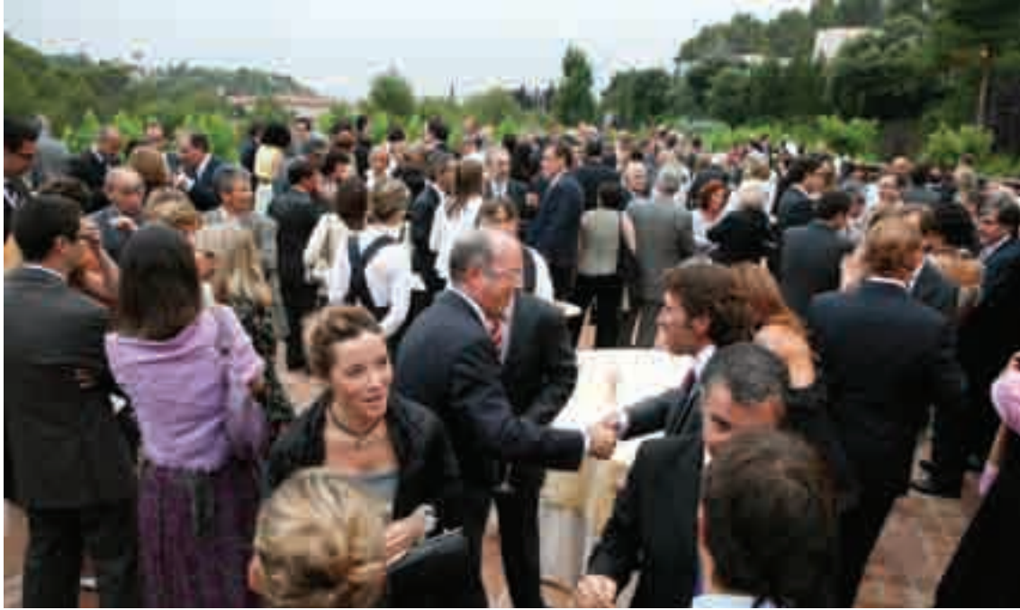
» Instantània dels exteriors de la Masia la Tartana, previ al lliurament dels guardons