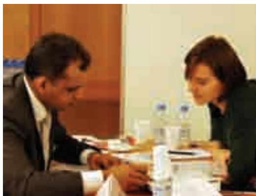
Una reunió entre una empresària catalana i un empresari de l'Índia