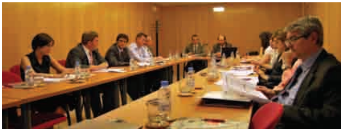
Instantània de la Comissió de Sostenibilitat i Medi Ambient