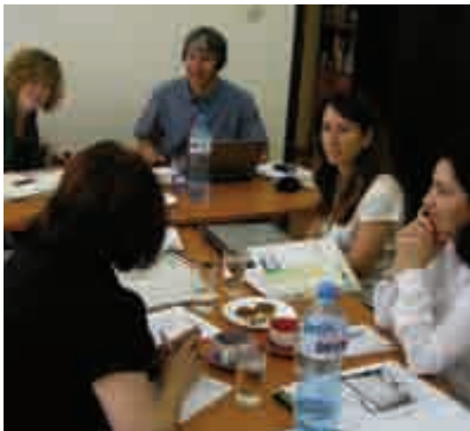
Instantània del Core Group Meeting del projecte Q-Placements a Dobrich (Bulgària)