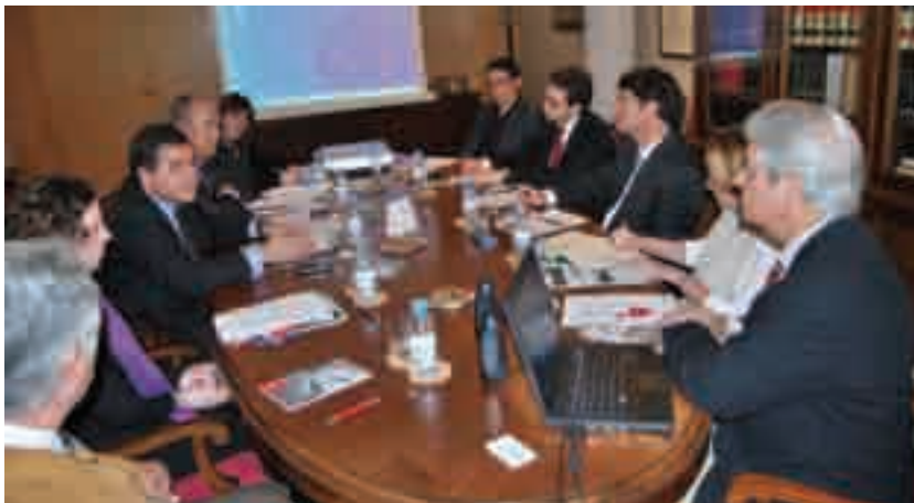
» Reunió entre la Cambra i TABASA