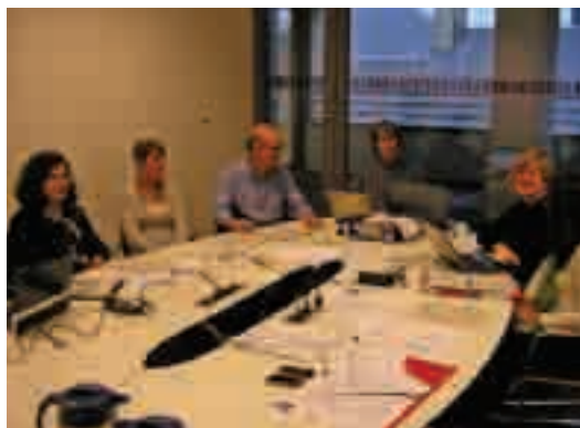
Reunió a Antwerp (Bèlgica) en el marc del projecte europeu Q-Placements

» El dia 29 de setembre la Cambra va acollir una reunió de preparació del projecte Ide-Tect, pel foment de l'esperit emprenedor França-Espanya. A la reunió van assistir diferents agents de Catalunya, Aragó i França que actualment treballen en l'assessorament i formació dels nous emprenedors.