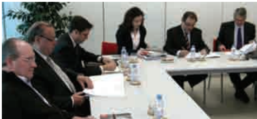
Fotografia d'una reunió del Consell de la delegació de la Cambra