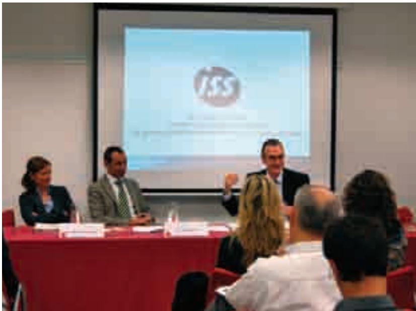
Instantània de la Jornada sobre la implementació de l'RSE en l'empresa

Empresarial, a través d'accions com ara la gestió de residus, l'estalvi energètic o la conciliació de la vida laboral i familiar, entre d'altres.