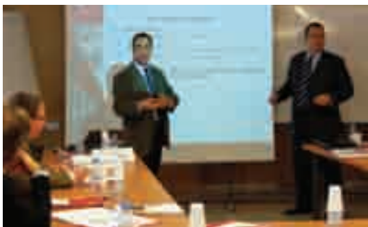
Instantània de la sessió informativa "Oportunitats i decisions d'empresa en temps de canvi"

tir experiències i debatre solucions conjuntament entre els assistents sobre la necessitat de generar cada vegada més valor afegit amb el mínim cost possible i orientar tota l'organització al mercat.