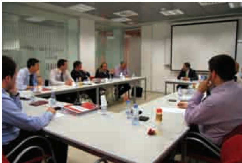
Sessió del Programa NORD de Direcció Comercial a la delegació territorial de la Cambra