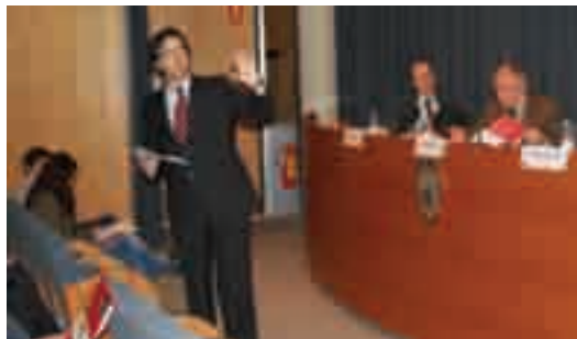
Sessió informativa sobre el posicionament de l'empresa als cercadors web

El dia 22 d'abril es va celebrar a la seu de la Cambra aquesta sessió informativa amb l'objectiu de donar a conèixer quins elements o factors fan que el lloc web d'una empresa aparegui de forma efectiva, ben posicionada i amb projecció dins dels cercadors. Aquesta sessió va comptar amb el suport del programa PIMESTIC de la Secretaria de Telecomunicacions i Societat de la Informació de la Generalitat de Catalunya.