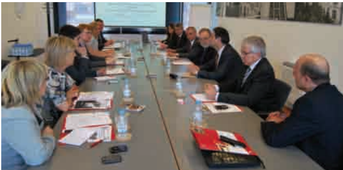
La Comissió de Formació del Consell General de Cambres en la reunió que es va celebrar a la seu de la Cambra el 23 de juny