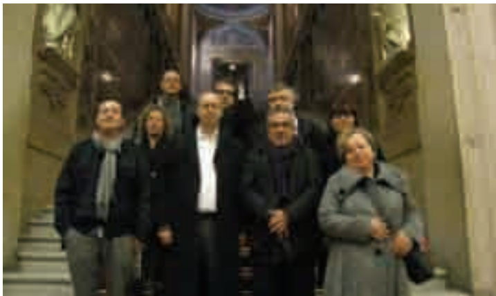
Foto de grup dels participants al viatge de prospectiva comercial de la Cambra a París