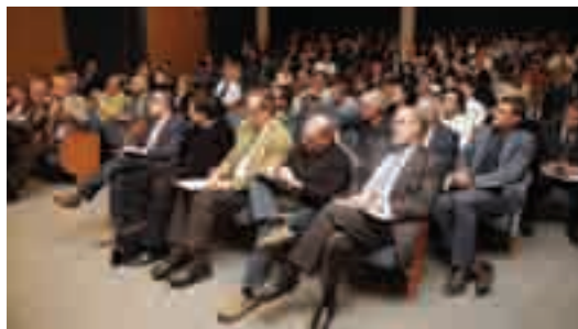
La sala d'actes de la Cambra es va omplir per a la sessió Cambractiva

La Cambra va organitzar el dia 25 de novembre una sessió Cambractiva sota el títol "Buscant sortides a la crisi". La Cambra va comptar en aquesta ocasió amb tres perfils amb visions multidisciplinàries com a ponents: Joan Majó, enginyer, exministre d'Indústria i Energia, exconseller de la Comissió Europea i autor del llibre "No m'ho crec: entendre la crisi per comprendre el món que ens espera"; José García Montalvo, catedràtic