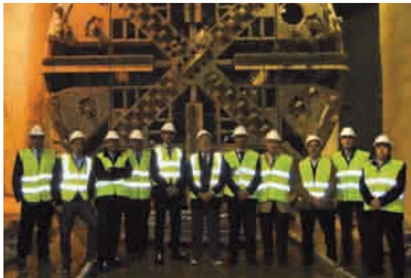
» La Cambra visita les obres de perllongament dels nous túnels d'FGC

Al llarg del recorregut per les instal·lacions els membres del Ple i del Comitè Executiu van poder conèixer de primera mà l'estat dels treballs d'excavació dels nous túnels i van veure els plànols de les tres estacions en construcció (Vallparadís, UPC, estació Nord i Can Roca) així com la màquina tuneladora amb la que s'estava realitzant la perforació del traçat.