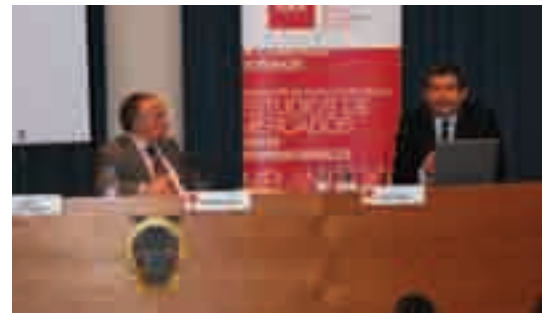
Instantània de la sessió informativa "Com vendre clients amb altres hàbits culturals"

» L'objectiu d'aquesta sessió, que va tenir lloc el 4 de juny, va ser donar una visió global sobre la influència dels hàbits culturals en les diferents formes de fer negocis, ja que no tenir en compte aquests elements pot portar al fracàs en les operacions comercials i d'inversió a l'exterior. Aquesta sessió volia donar les pautes essencials per comunicar-se, en les millors condicions, amb els nostres potencials interlocutors de diferents cultures.