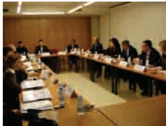
Sessió inaugural del projecte a les instal·lacions de la Cambra. 2 de febrer de 2009

El resultat del projecte és un manual per a alumnes, professors i empreses de com participar i gestionar les pràctiques amb estudiants estrangers. El manual serà publicat a l'any 2010 en 10 idiomes europeus a la web: www.q-placements.eu .