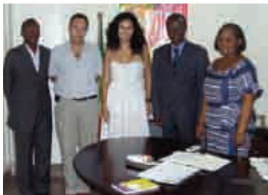
Fotografia de grup amb la delegació d'empresaris africans

Desenvolupada del 28 de gener a l'11 de febrer, aquesta missió va comptar amb el suport d'ACCÍO. Les empreses participants en aquesta missió van ser les següents: