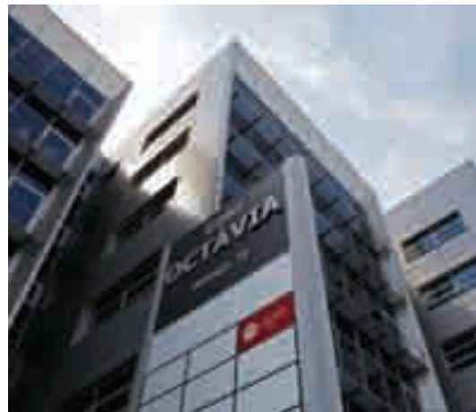
La delegació territorial de la Cambra, que dona servei als empresaris de Castellbisbal, Rubí i Sant Cugat del Vallès