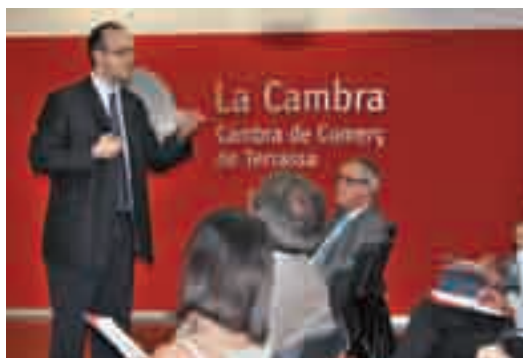
Instantània d'una de les sessions del cicle de optimització de la gestió de l'empresa