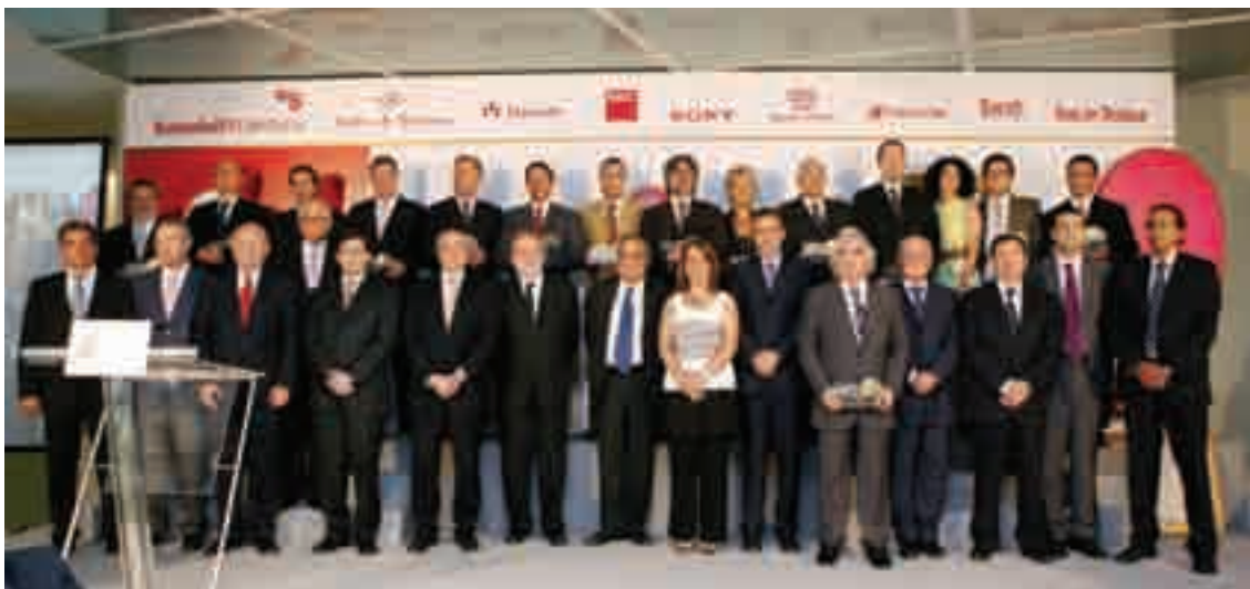
Fotografia de grup dels guanyadors dels Premis Cambra 2009, amb les autoritats i els patrocinadors

Els Premis Cambra 2009 van comptar amb el patrocini de SabadellAtlántico, Aigües de Terrassa, Finques Massachs, Audi – Sarsa Vallès, Sony, Circutor, RACC, Serafi Indústria Gràfica i Diari de Terrassa.