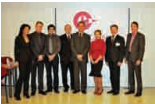
Fotografia de grup amb els empresaris de les Repúbliques Bàltiques