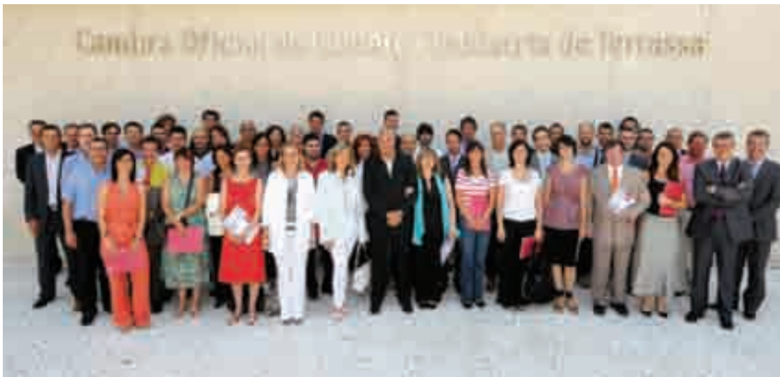
» Foto de grup d'alumnes, professors i membres de la Cambra, en la cloenda dels programes NORD de l'any 2009