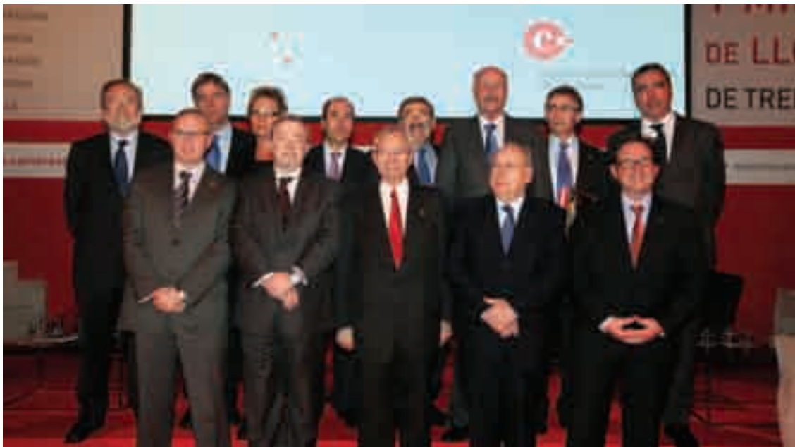
Fotografia de grup dels presidents de les 13 Cambres de Comerç de Catalunya