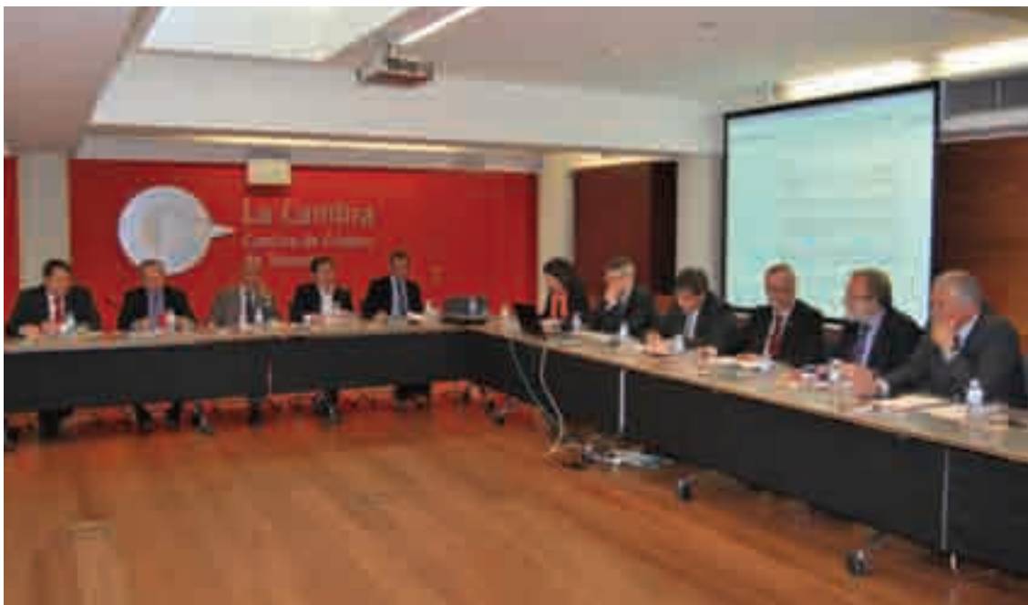
El màxim òrgan de la Cambra, reunit en la nova Sala del Ple