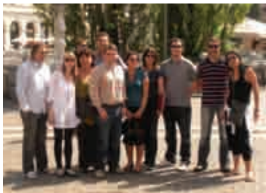
Fotografia de grup dels empresaris participants en la missió a Europa Central