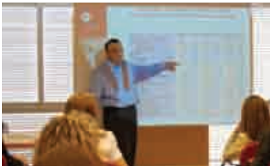
Instantània de la sessió informativa sobre el Pla de Millora Empresarial

Els dies 14 de gener i 6 de maig a la seu de la Cambra i els dies 5 de març i 1 de juliol a la delegació de l'entitat es van celebrar edicions d'aquesta sessió informativa amb l'objectiu de reflexionar sobre el context econòmic i donar a conèixer als assistents aquelles eines que tenen al seu abast per redefinir l'estratègia empresarial i optimitzar costos.