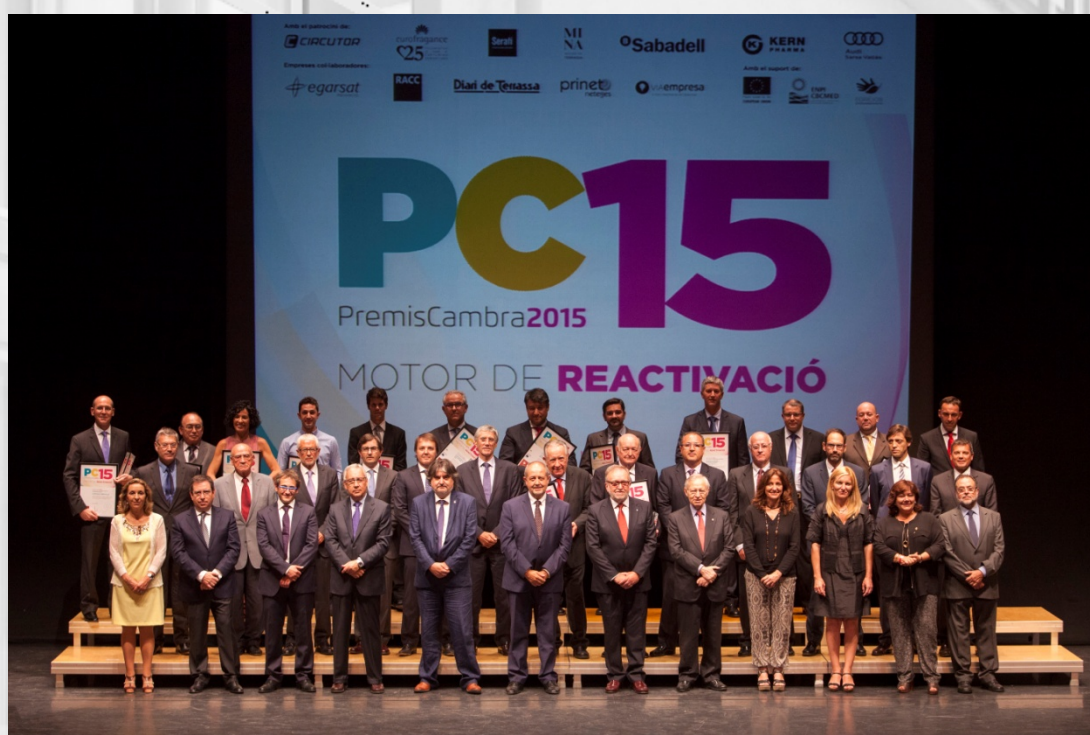
Fotografia de grup de l'acte de lliurament dels Premis Cambra 2015