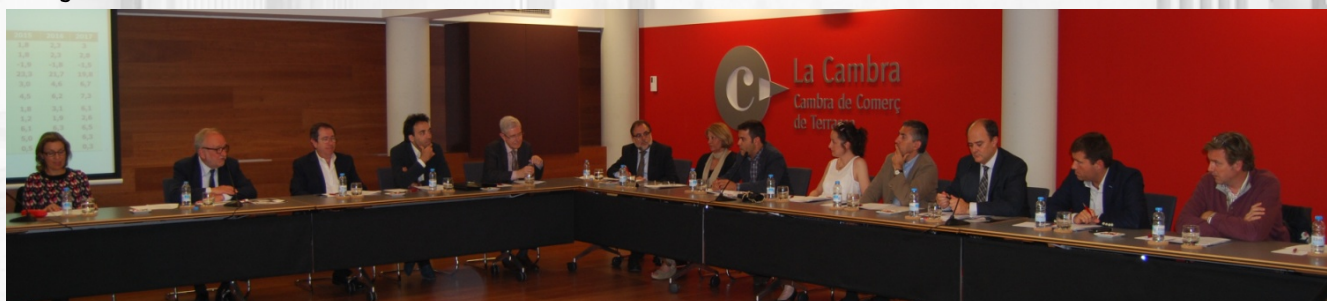
Fotografia d'una sessió del Ple de la Cambra

Format l'any 2015 per 39 persones, 35 de les quals representen els diferents sectors de l'activitat econòmica de la demarcació de Terrassa i 4 a les organitzacions empresarials, el Ple és l'òrgan suprem de govern i representació i com a tal adopta els acords principals per al desenvolupament de l'activitat de la Cambra.