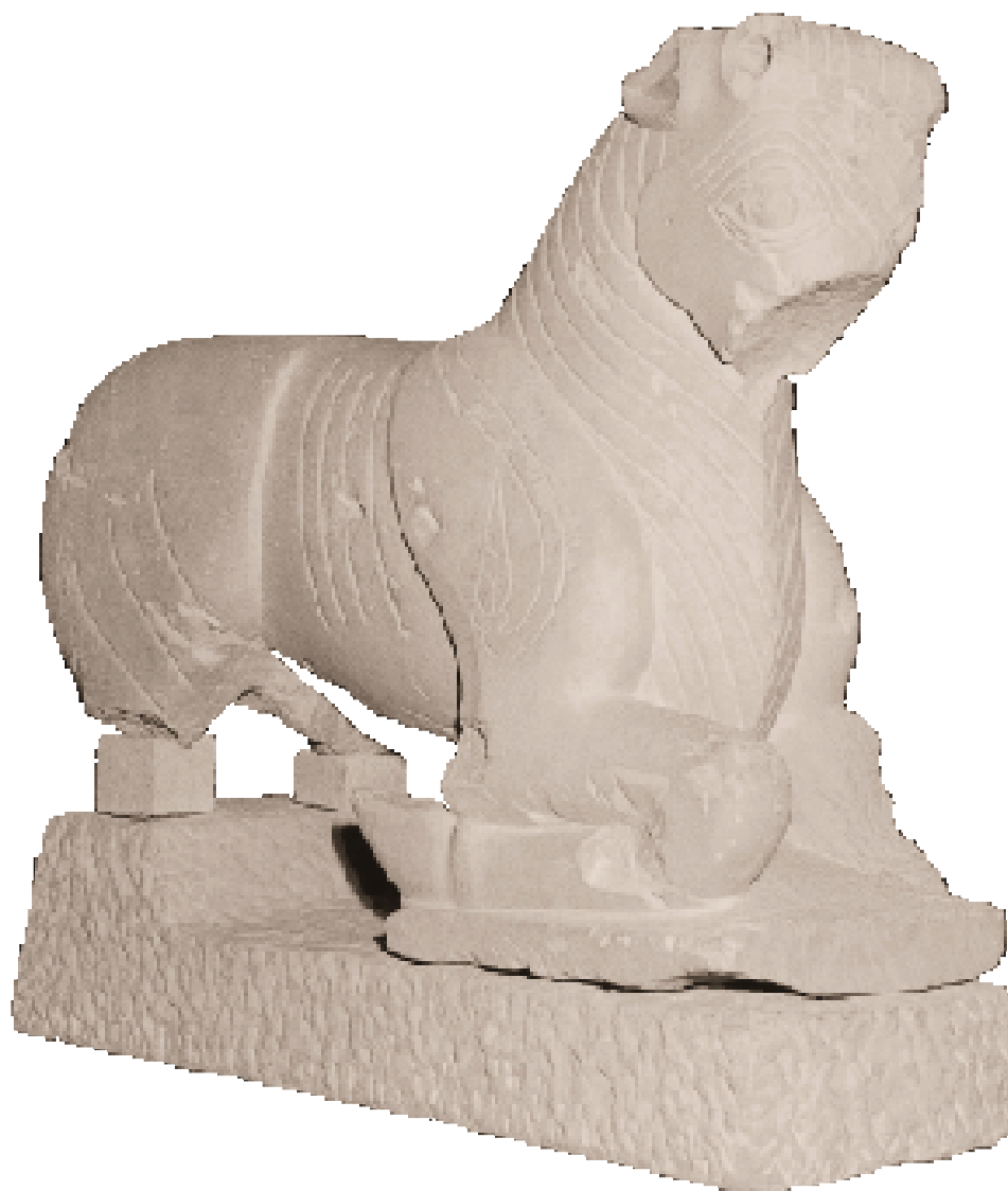
Toro de Porcuna. Porcuna (Jaén). Museo de Jaén.