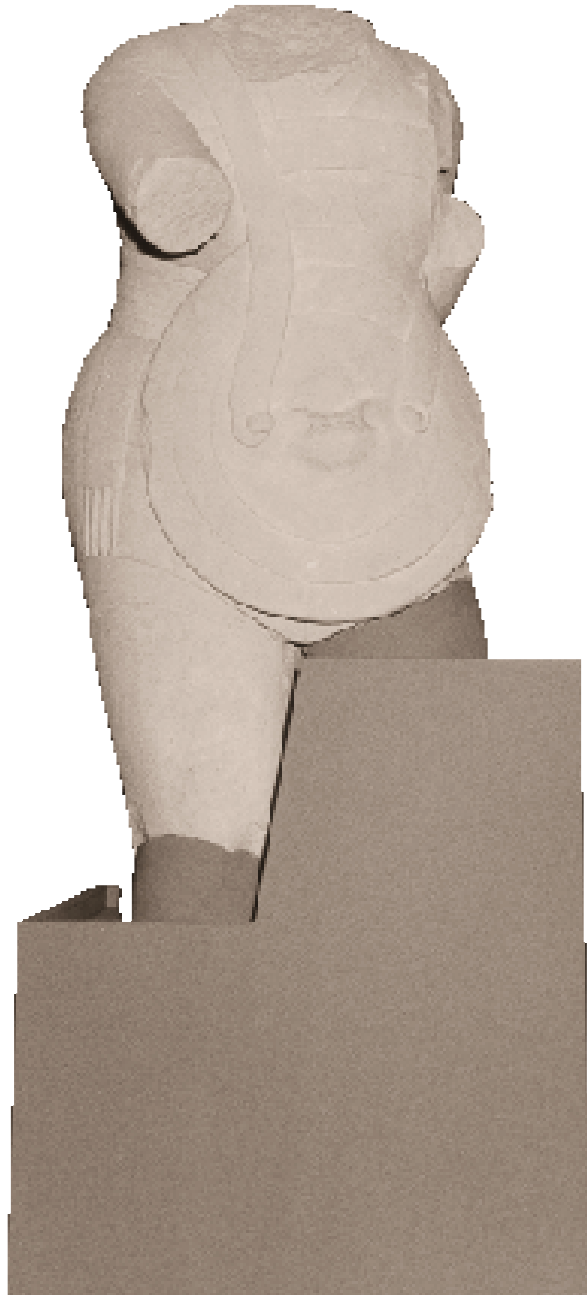
Guerrero de la Caetra (escudo).

Sala monográfica del conjunto escultórico-ibérico de Cerrillo Blanco (siglo v a. C.).