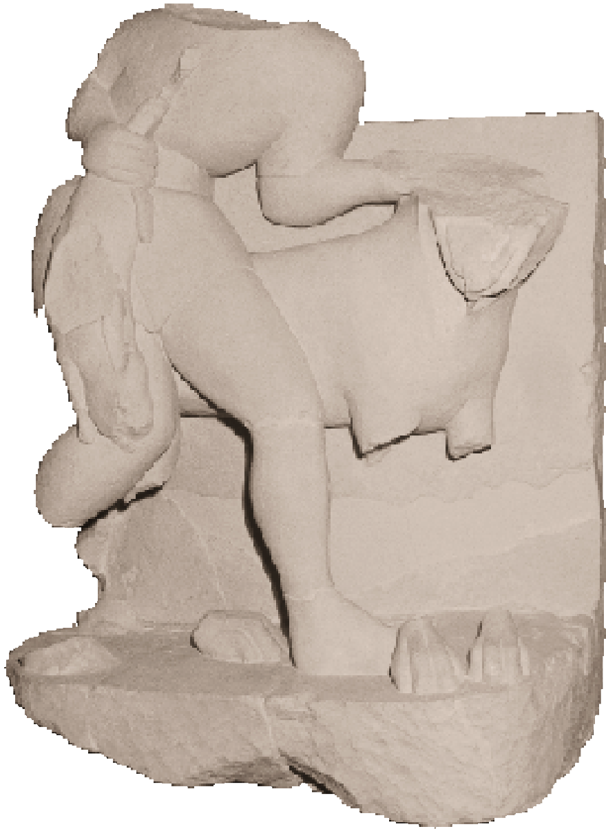
Cazador de liebre con perro.

Sala monográfica del conjunto escultórico-ibérico de Cerrillo Blanco (siglo v a. C.).