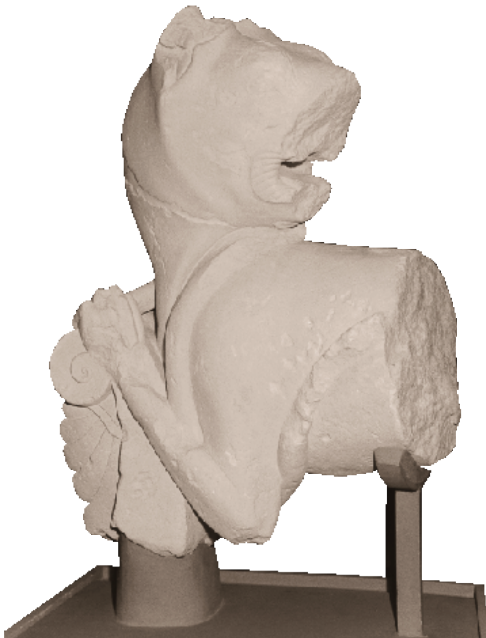
León luchando con serpiente.

Sala monográfica del conjunto escultórico-ibérico de Cerrillo Blanco (siglo v a. C.).