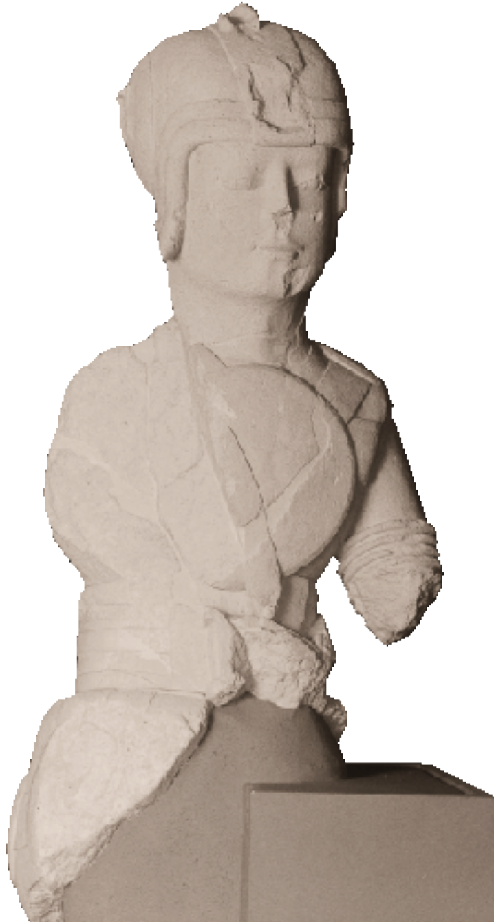
Guerrero de doble armadura.

Sala monográfica del conjunto escultórico-ibérico de Cerrillo Blanco (siglo v a. C.).