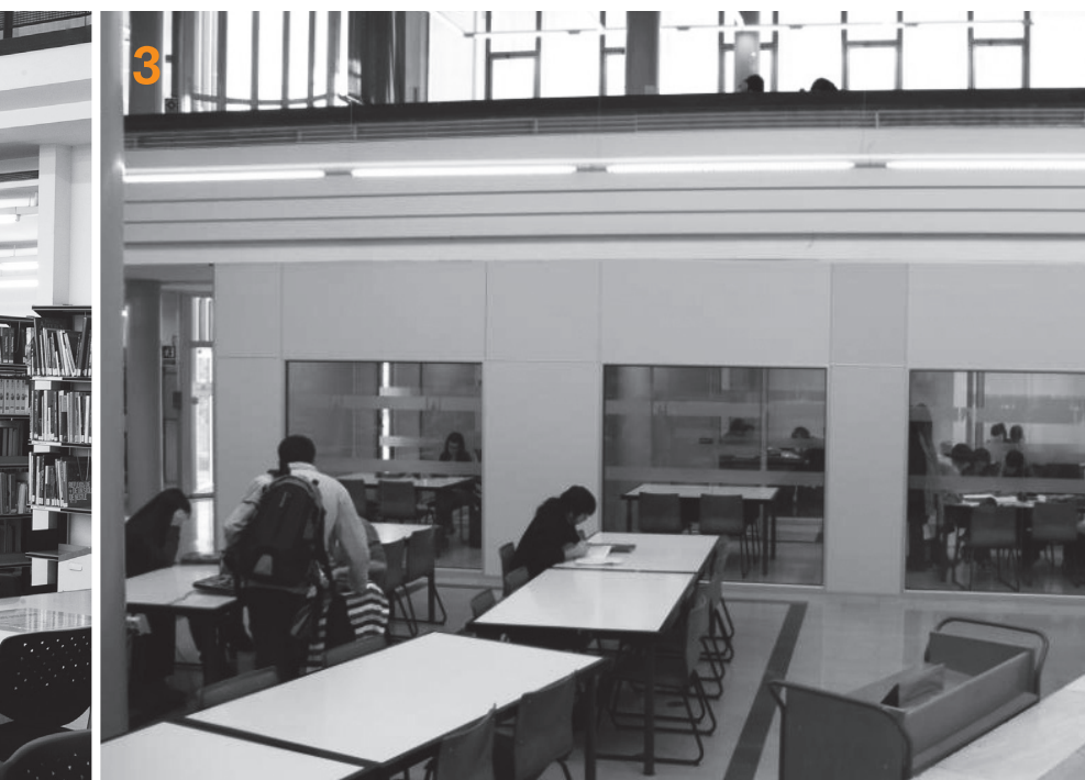
[1] Biblioteca de Comunicació i Hemeroteca General

per difondre novetats i elaboren diferents guies d'informació general o temàtiques, amb l'objectiu de facilitar el funcionament dels diferents serveis per a l'usuari. S'han elaborat 161 guies que es poden consultar a http://ddd.uab.cat/collection/guibib ♦