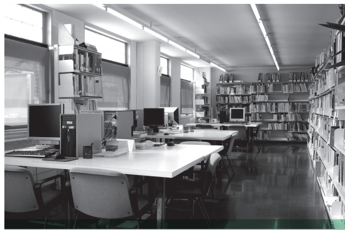
Fundació Biblioteca Josep Laporte