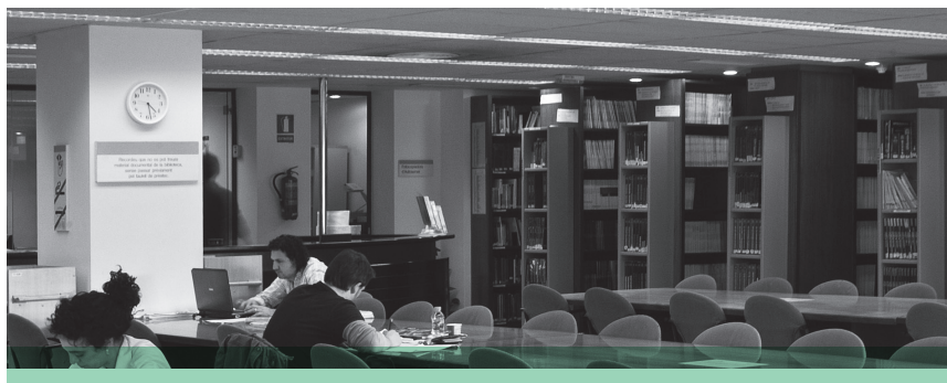
Biblioteca Universitària de Sabadell