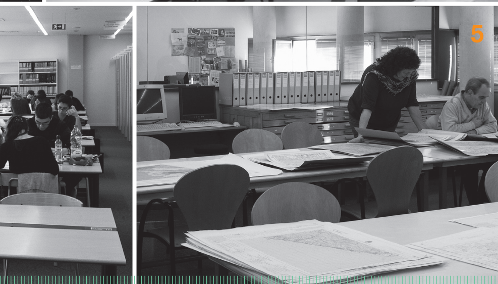
[5] Cartoteca General