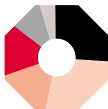
Aplicación de fondos por áreas de actividad (31.12.03)