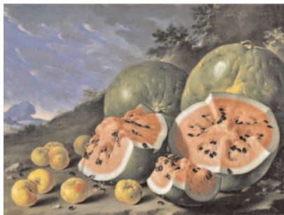
Bodegón con sandías y manzanas en un paisaje. Luis Meléndez

Los mejores jóvenes organistas del mundo participarán, del 14 al 19 de septiembre de 2009 en Daroca, Calatayud y Zaragoza, en este concurso cuyo objetivo es facilitar que los jóvenes profesionales de la interpretación de órgano de todo el mundo