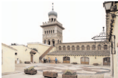
Escuela Granja Taller CAI Torrevirreina de Zaragoza