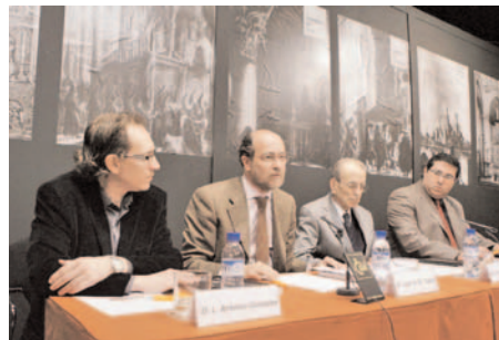
Presentación “La música en los archivos de las Catedrales”

Después de dos años de implantación del nuevo sistema de comunicación y oferta de cursos a través del correo electrónico, la respuesta continuó siendo muy favorable. En 2008 tuvo 800.000 visitas.