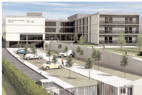
Infografía del centro Gerontológico CAI-Ozanam