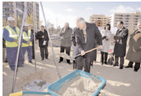
Primera piedra del centro Gerontológico CAI-Ozanam