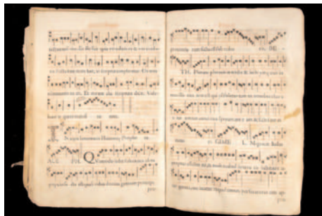
Pasionario impreso Albarracín. Archivo de Música de la Catedral