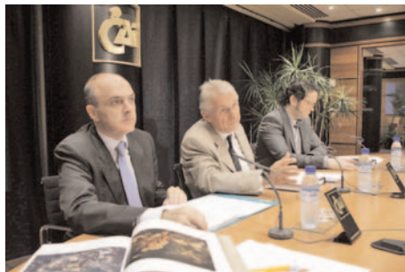
Presentación “Lucas Jordán y la Corte de Madrid”