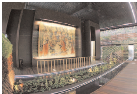
Vista general del pabellón “jardín CAI de los tapices”