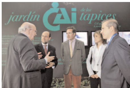
Inauguración pabellón CAI en Expo Zaragoza 2008

El 10 de julio se celebró el día Institucional de Caja Inmaculada en la Expo. Caja Inmaculada compartió esta celebración con una amplia representación de las entidades beneficiarias de su Obra Social. Para ello, se enviaron más de 400 invitaciones a fundaciones, organizaciones y asociaciones aragonesas que se dedican a cuidar personas que necesitan una atención