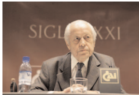
José María Segovia de Arana: “Presente y futuro de la medicina”