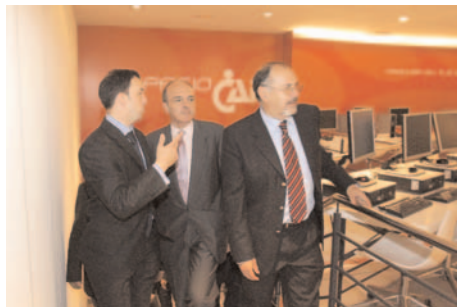
Inauguración Espacio CAI. Mayo 2008

La primera exposición recogida en este acuerdo se celebró en 2008, desde el 25 de septiembre al 8 de diciembre, en la sala