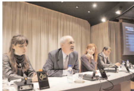
Presentación ciclo "Proyectaragón"

También se organizaron los siguientes ciclos: Jóvenes Orquestas Universitarias (en colaboración con la Universidad de Zaragoza), Música de Cámara (Conservatorio Superior de Música de Aragón), música celta, flamenco, jazz, tango y pop. Asimismo, intervinieron muchos grupos de Aragón y de distintos países.