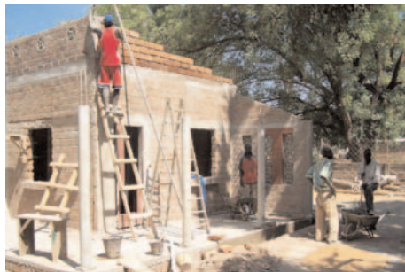
Construcción de Cooperativa de crédito y ahorro en República del Chad