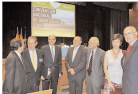
Convención Nacional de Obra Social Septiembre 2008, Zaragoza