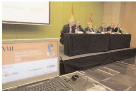
VIII Congreso Nacional de Economía Noviembre 2008, Zaragoza

El Gobierno de Aragón, la Universidad de Zaragoza y Caja Inmaculada realizan un programa de ayudas para aragoneses y sus descendientes que residan en países de América donde haya Casa de Aragón o algún Centro equivalente. Estas ayudas se destinan a realizar estudios relacionados con el docto-