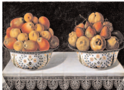
Dos fruteros sobre una mesa. Tomás Hiepes

Exposición “El bodegón español en el Prado”