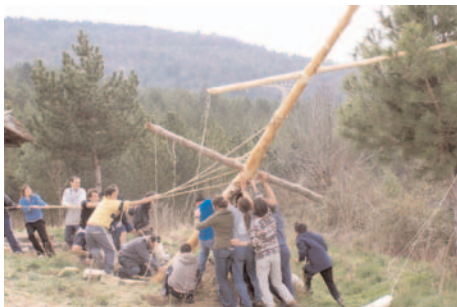
Convenio con Scouts de Aragón para rehabilitar la “Casa Sánchez” en Griébal

En 2008 continuó la colaboración con el Cabildo Metropolitano de Zaragoza para la restauración de los tapices del Museo de La Seo; se completaron los trabajos de restauración de los tapices “Los Pecados Capitales” y “Aries”.