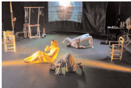
Obra de Teatro: "Desde lo invisible"