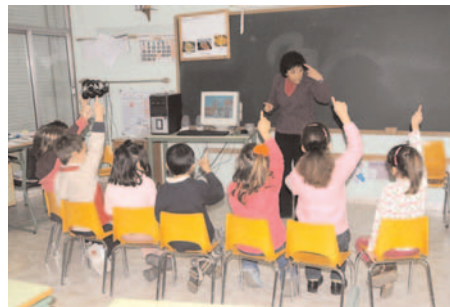
Colegio La Purísima para niños sordos