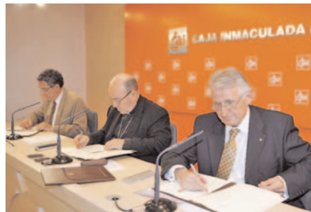
Firma del convenio para la rehabilitación de la fachada sur del Pilar