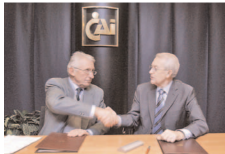
Firma del Convenio con la Fundación Federico Ozanam