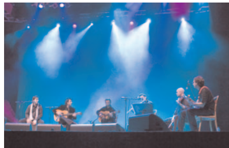
Grupo La Querencia dentro del Programa “ Noches de Verano ”

El Centro fue, desde junio de 2007 hasta junio de 2008, punto de canje de los pases de temporada de la muestra internacional Expo Zaragoza 2008; más de 42.000 personas pasaron por las instalaciones para obtener su abono o informarse.