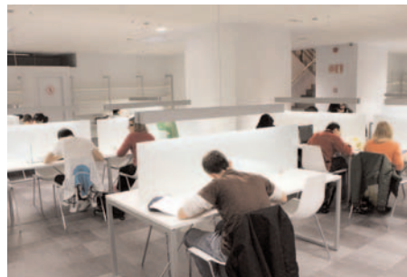
Sala de estudio de Espacio CAI