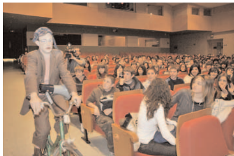
Actividad de Coup de Théâtre

Fundación CREA y Caja Inmaculada (CAI) organizaron en 2008 el “Foro de Instituciones Nacionales”, que consistió en la realización de doce seminarios especializados en Huesca, Teruel y Zaragoza. El objetivo de este ciclo de conferencias y reuniones con expertos fue difundir entre las empresas aragonesas las posibilidades de apoyo y financiación que pueden aportar a sus proyectos diversas instituciones nacionales.