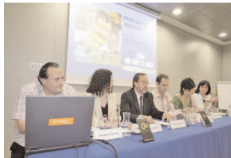
Presentación Programa ARASUR Asociación Huauquipura