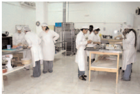
Centro Sociolaboral Las Fuentes. Fundación Adunare

El servicio, que se desarrollaba en Zaragoza capital, se amplió en 2008 a las localidades de Alcañiz y Caspe.