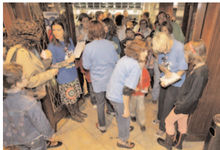
Programa “La linterna mágica”