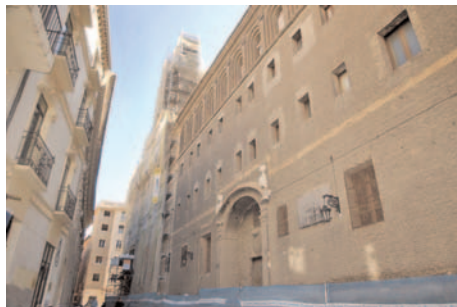
Restauración del Real Seminario de San Carlos Borromeo

Caja Inmaculada promueve, junto con el Ministerio de Educación, Cultura y Deporte, el Gobierno de Aragón, las diócesis