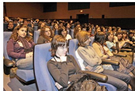
Participantes en el programa Coup de Théâtre