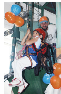
Programa CAI Montaña y Medio Ambiente