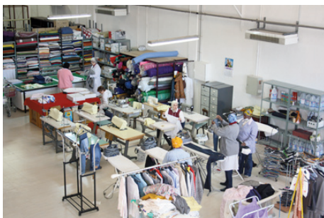
Taller de inserción laboral "A todo trapo"