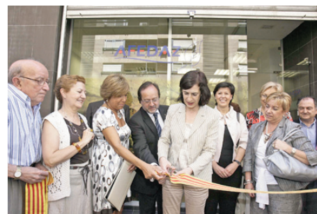
Inauguración Centro AFEDAZ. Junio 2009