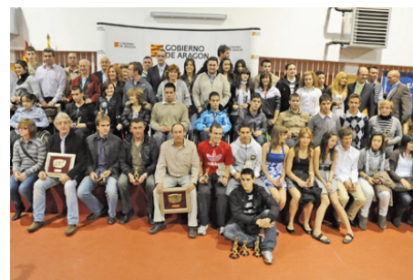
Colaboración en los Juegos Escolares de Aragón

Caja Inmaculada colaboró con Scouts de Aragón para acometer la segunda fase de rehabilitación de "Casa Sánchez", en