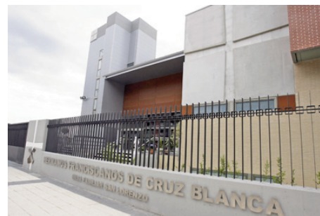
Nuevas instalaciones de la Casa Familiar San Lorenzo