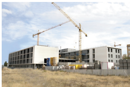
Obras de la Residencia CAI-Ozanam