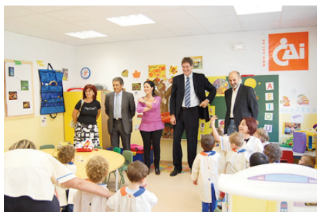
Escuela de Educación Infantil de Sariñena