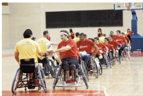
Equipo baloncesto CAI Deporte Adaptado

Se firmó un nuevo convenio de colaboración con el Club Deportivo de Disminuidos Físicos de Zaragoza, al objeto mantener los programas deportivos, formativos y de fomento de empleo que realiza el Club, dirigidos a mejorar la calidad de vida de las personas con discapacidad. Además, la aportación de Caja Inmaculada permitió al Club adquirir un vehículo adaptado para los desplazamientos que realizan los integrantes de sus equipos deportivos. De esta forma, se intensificó la estrecha colaboración que ambas entidades mantienen desde 1985.