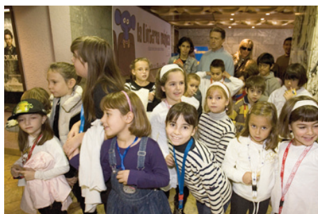
Sesión del programa "La linterna mágica"