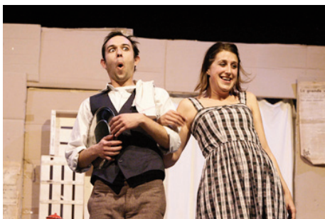
Actuación dentro del programa Coup de Théâtre

En 2009 se realizaron 166 actividades en la Escuela, con 1.871 horas de clases impartidas a las que asistieron 3.513 alumnos en las tres provincias aragonesas.