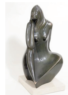
Escultura de Arellano. Huesca