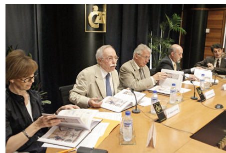
Presentación de la publicación “El cristianismo primitivo en Aragón”

“Energías renovables en Aragón”. Editado por Servicio de Estudios CAI, Cámaras de Comercio y CREA. El estudio analiza una actividad que realizan 150 empresas y crea 2.500 empleos directos en Aragón.