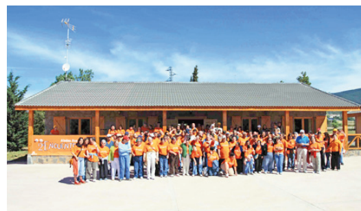
Granja Escuela en Martillué (Jaca)