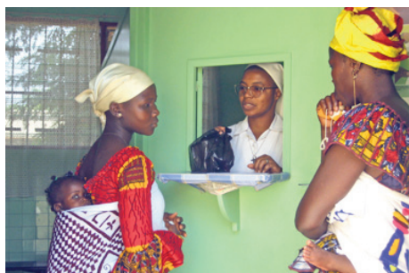
Programa de atención a enfermos de SIDA. Hospital de Dimbokro (Costa de Marfil)