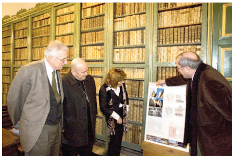
Firma del convenio para la restauración del Real Seminario de San Carlos Borromeo de Zaragoza

Caja Inmaculada colaboró con el Cabildo Metropolitano de Zaragoza para restaurar zonas y elementos de la catedral del Salvador de Zaragoza que presentaban desperfectos producidos por la humedad y antigüedad del edificio. Esta actuación garantiza la completa y mejor conservación de La Seo, considerada uno de los símbolos más destacados del patrimonio artístico de Aragón.