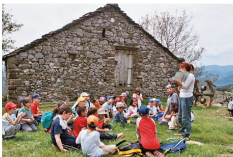
Programa Clima y Naturaleza

El Centro de Visitantes recibió en 2009 a más de 10.900 personas y participaron en las actividades programadas 5.176 escolares.