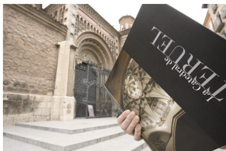
Publicación “La catedral de Teruel”