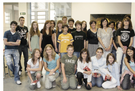
Participantes en el concurso "Se busca"