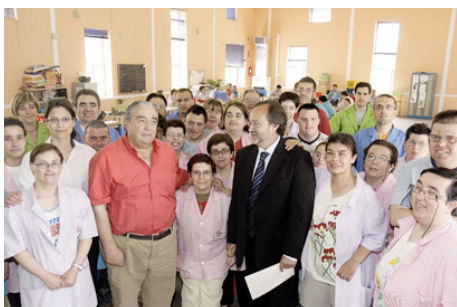
Fundación Benito Ardid en Isín (Huesca)