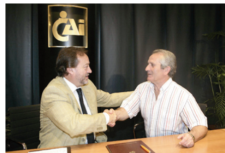
Firma convenio con fundación Adunare. Septiembre 2009