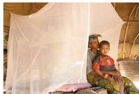
Distribución de mosquiteras contra la malaria. Colaboración con Cruz Roja en Sao Tomé y Príncipe