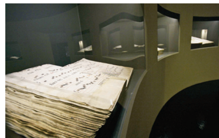
Exposición “La palabra iluminada” Sala CAI Luzán

Inaugurada en la Sala CAI Luzán el 8 de octubre, la exposición reunió una cuidada selección de manuscritos miniados, realizados entre los siglos XII y XIX, pertenecientes a los archivos