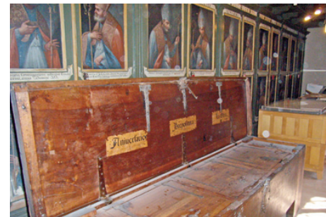
Archivo histórico de la Basílica Catedral de Nuestra Señora del Pilar

Se suscribió convenio de colaboración con el Gobierno de Aragón y el Arzobispado de Zaragoza para restaurar este emble-