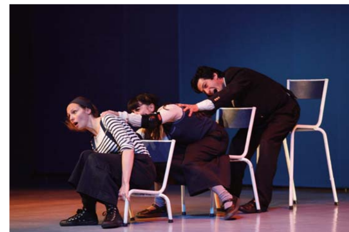
Teatro en francés.