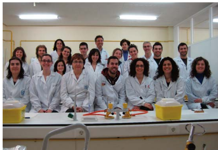
Programa Europa. Grupo de Genética de Microbacterias UZ.