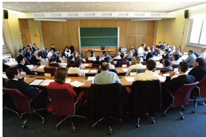
Escuela de Negocios CAI.

Todo este trabajo mantiene a la Escuela de Negocios de Caja Inmaculada como el referente en Aragón en el ámbito de la formación empresarial.