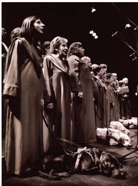
Primer premio CADIS.