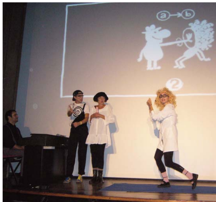
Linterna Mágica Teruel.