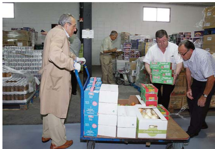
Banco de Alimentos.