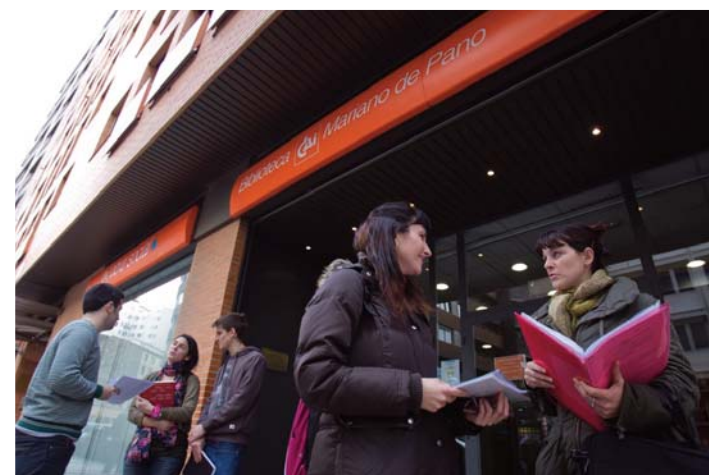
Biblioteca CAI Mariano de Pano.