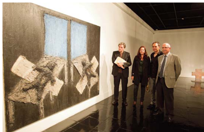
Exposición Víctor Mira

Además de a las capitales de provincia, Servicio Cultural organizó actividades en otros 31 municipios aragoneses.