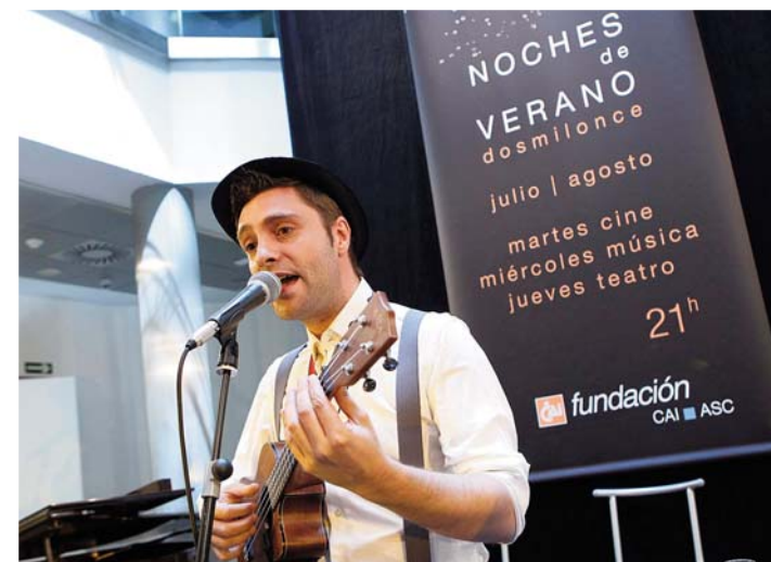
Noches de verano.

El Centro Joaquín Roncal de la Fundación CAI-ASC registró en 2011 uno de los mejores datos de participación y actividad desde que abrió sus puertas en mayo de 2005.