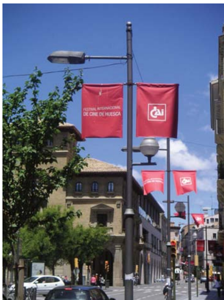
Festival Cine Huesca.