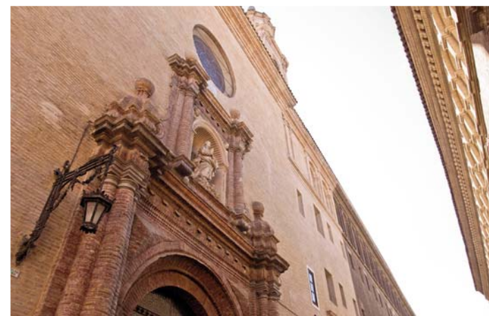
Seminario San Carlos Borromeo.

Es uno de los conjuntos artísticos barrocos más sobresalientes de Zaragoza, tanto desde el punto de vista arquitectónico como histórico. Está declarado Bien de Interés Cultural. Su restauración se está llevando a cabo en colaboración con el Gobierno de Aragón y el Arzobispado de Zaragoza.