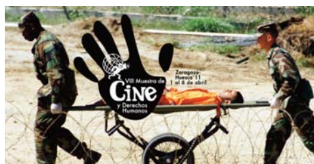
Muestra de Cine y Derechos Humanos.