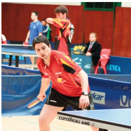
CAI Santiago Tenis de Mesa.

Con los ayuntamientos de Teruel, Huesca y otros municipios aragoneses se renovaron también las colaboraciones para difundir y promocionar la práctica del deporte y otras alternativas de ocio entre niños y jóvenes, fundamentalmente.