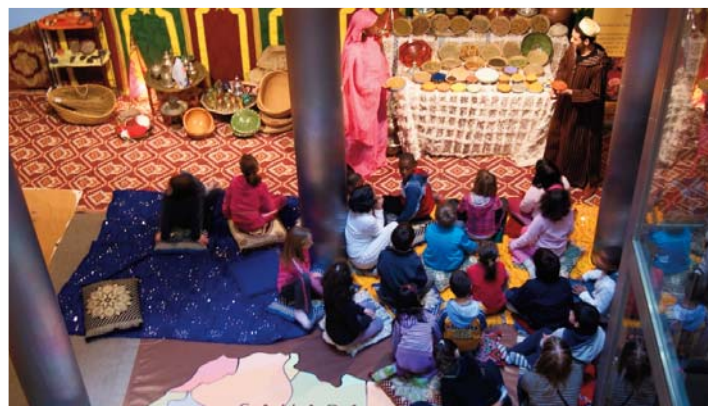
Exposición con visitas escolares.

Hay que destacar muy especialmente la cada vez mayor implicación de los centros educativos aragoneses en la programación; de hecho, más de 100 centros participaron en alguna de las actividades didácticas programadas (exposiciones, proyecciones, conciertos, etc.).