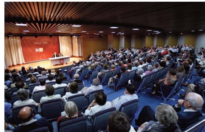
CAI Siglo XXI Muñoz Molina.

que Aragón obtenga resultados muy innovadores y prácticos en muchas ramas científicas.