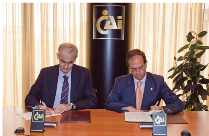
Convenio CAI y DFA.