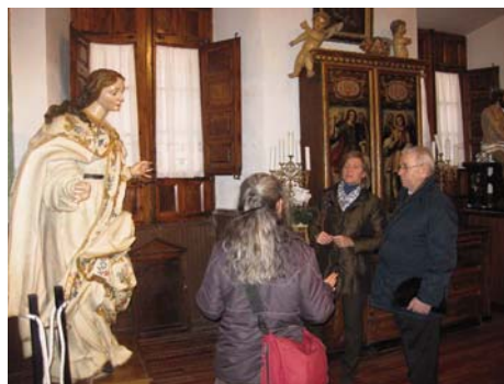
Iglesia de San Juan el Real.