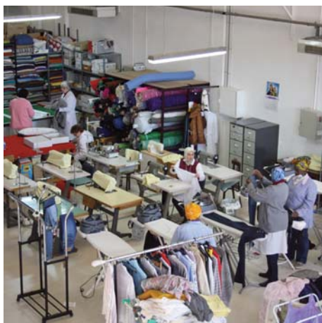
"A Todo Trapo" Huesca.