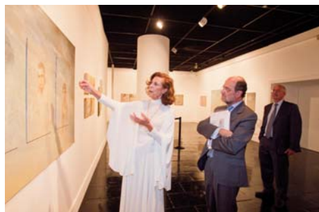
Exposición Nati Cañada

El cine ocupó un lugar importante en calendario cultural. Se organizaron ciclos dedicados a un actor (Paul Newman), a un país (Paseos por el cine francés), a una época (Clásicos en blanco y negro) o a un tema (Crisis económica, crisis moral). También se celebró el programa 'Libros al cine' para mostrar las buenas adaptaciones cinematográficas de las mejores obras de la literatura española e internacional.