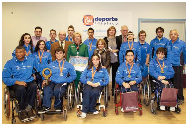
CAI Deporte Adaptado.