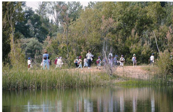
Galacho de Juslibol.