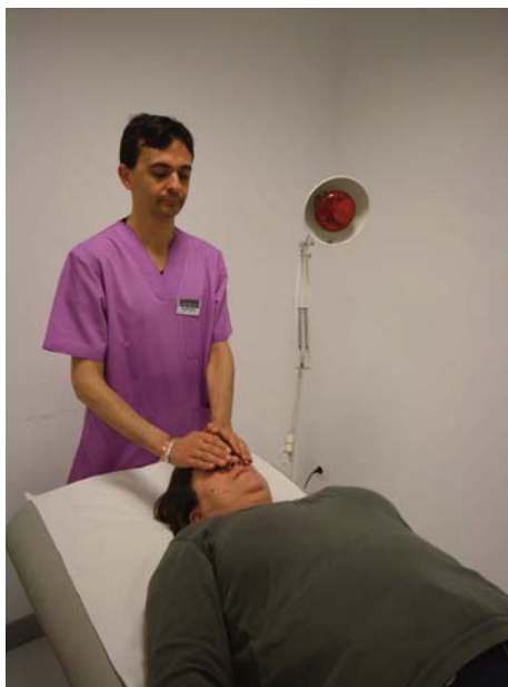
Fundación Benito Ardid.