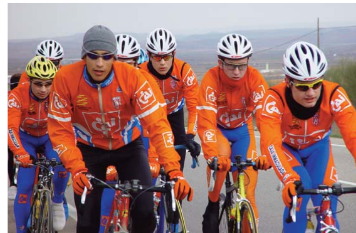
CAI Club Ciclista Aragonés.