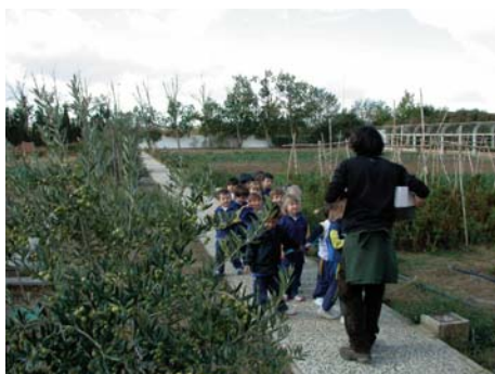
Granja Escuela CAI Torrevirreina.