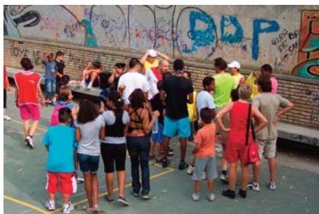
CAI, Cáritas y ASC.