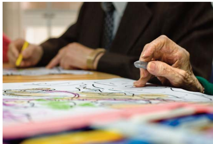
Centro de Día Torrero CAI Ozanam.