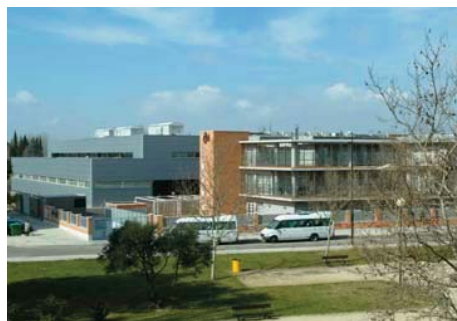
Residencia CAI AFEDAZ.