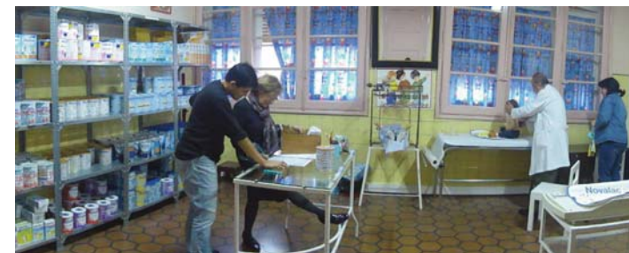
Refugio “Gota de leche”.

las tres instituciones invirtieron 300.000 euros, está ayudando a que 300 familias de Zaragoza puedan vivir dignamente y así evitar situaciones de grave exclusión social. En 2012 continuará esta labor.