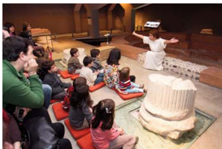
Museo en Familia.

La Obra Social colaboró con los ayuntamientos de las ciudades de Huesca y Teruel, así como de 65 de otros municipios aragone-