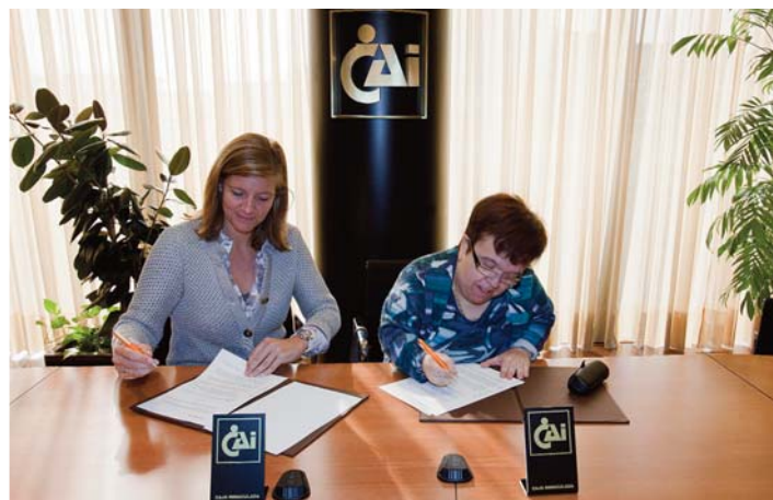
Convenio con APAC.