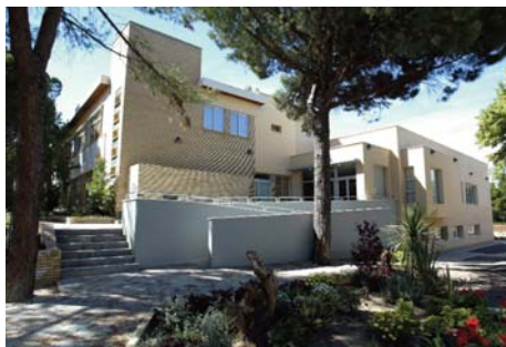
Escuela de Negocios CAI.