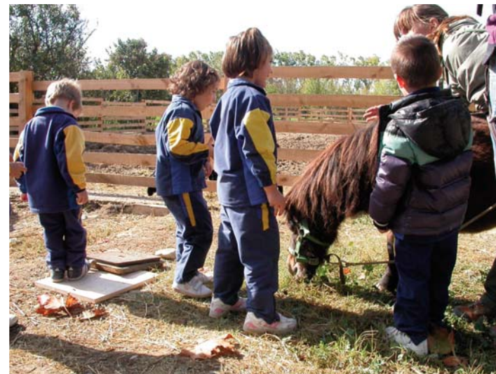
Granja Escuela CAI Torrevirreina.

La Obra Social de Caja Inmaculada y la Fundación Federico Ozanam pusieron en marcha un novedoso programa educativo y de tiempo libre para alumnos de segundo ciclo de Educación Infantil