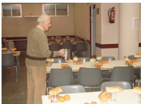
Parroquia de Nuestra Señora del Carmen. comedor.