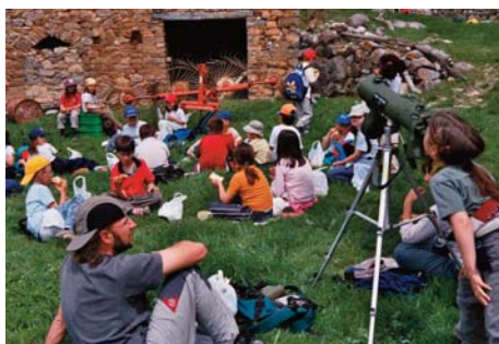
Conoce la Naturaleza de Aragón.

Su objetivo es acercar este espacio natural de Zaragoza a los ciudadanos para que ayuden a conservarlo y a difundir su excepcional valor medioambiental. En 2011, el Centro de Visitantes recibió a 12.604 personas y 4.405 alumnos participaron en las actividades programadas.