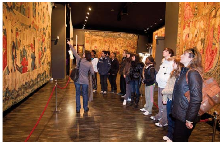
Visitas al Museo de Tapices.