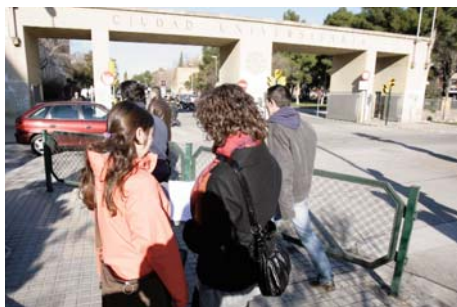
Universidad de Zaragoza.

Durante el curso se pusieron en marcha el Proyecto RSD Deporte Solidario, en colaboración con UNICEF, que fomenta el deporte como vehículo de sensibilización en temas de cooperación al desarrollo, y el Proyecto RSD Deporte ceroC02, en colaboración con la Fundación Ecología y Desarrollo.