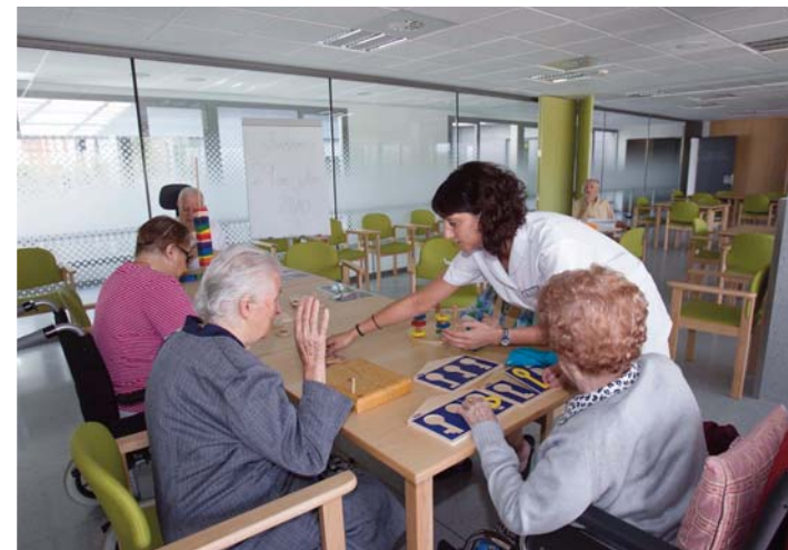
Residencia CAI Ozanam Oliver.

cursos para sus actividades. La residencia, inaugurada en 2010 y gestionada por la Fundación Federico Ozanam, es una de las obras asistenciales más importantes, tanto por la inversión, como por su importante función social. Cuenta con 210 plazas de residencia y 40 de centro de día para personas mayores. Además, da empleo a cerca de cien personas.