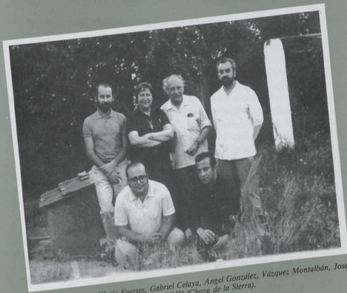
Caballero Bonald, Gloria Fuertes, Gabriel Celaya, Angel González, Vázquez Montalbán, José Agustín Goytisolo. Verano, 1969. MADRID (Choza de la Sierra).