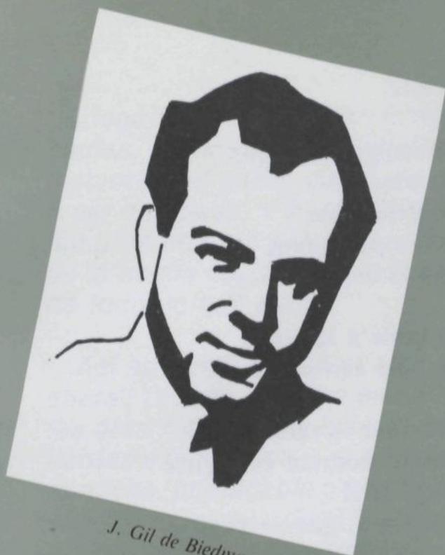
J. Gil de Biedma